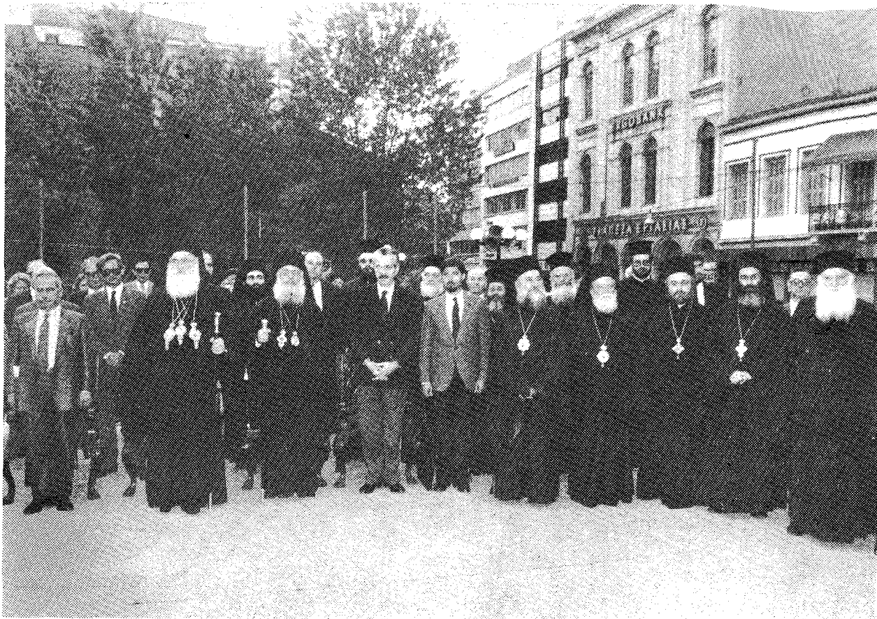
Οἱ Μακ. Προκαθήμενοι τῶν Ἐκκλησιῶν Ἱεροσολύμων καὶ Ἑλλάδος μετὰ τοὺς Σεβ. ἱεράρχες τοῦ Πιτριάρχείου, ἐνῶ ἀνακρούεται ὁ ἔθνικός μας ὕμνος στὸ τέλος τῆς τελετῆς.

εἰς μίαν στιγμήν, ὄχι ἀπλῶς ἐποχήν, κατὰ τὴν ὁποίαν ὁ κόσμος συνέχεται ἀπὸ ἕναν φόβον ὀλοκληρωτικῆς καταστροφῆς. Ἄν δὲν στρέψῃ τὸ βλέμμα καὶ τὴν προσοχὴν πρὸς τὴν Βηθλεὲμ καὶ ἂν δὲν ἀναμνησθῇ διατὶ ἦλθεν εἰς τὸν κόσμον ὁ Θεὸς τῆς ἀγάπης, πρὸς τὴν Βηθλεὲμ, ὅπου τὸ πρῶτον ἀκούγεται ἡ λέξις εἰρήνη μετὰ τὴν πνευματικὴν αὐτῆς σημασίαν καὶ δὲν διδαχθῇ ἀπὸ αὐτὴν, τότε σωτηρία δὲν ὑπάρχει. Εἶναι πρόσφατον τὸ γεγονός, τὸ ὁποῖον ὀφείλει νὰ διδάξῃ τὸν κόσμον ὅτι πρέπει κάποτε νὰ μετατρέψῃ τὰ πολεμικὰ ὄπλα εἰς ἄροτρα καὶ ἔργα εἰρηνικά, νὰ ἀγκαλιάσῃ οἱ λαοὶ ὁ ἕνας τὸν ἄλλον, ὅποτε καὶ θὰ βασιλεύσῃ ἡ εἰρήνη εἰς τὸν πλανήτην μας, τὴν ὁποίαν εὐχόμεθα ἀπὸ βάθους καρδίας ὅλοι μας».