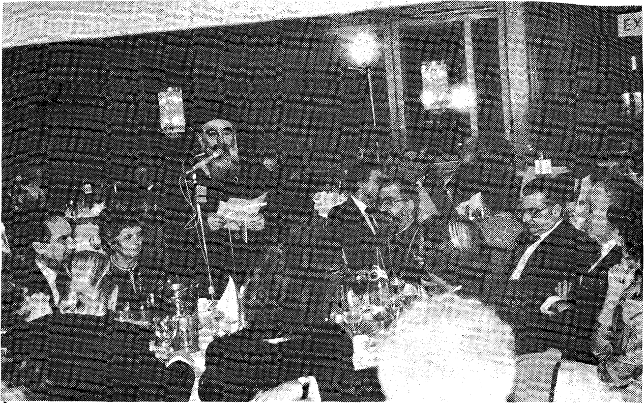
Ο Σεβ. Αρχιεπίσκοπος Θυατείρων κ. Μεθόδιος δμιλών κατά τὸ Δεῖπνο, μὲ τὸ ὁποῖο ἔκλεισε τὸ Κληρικολογικὸ Συνέδριο.

νονται προσπάθειες λειτουργίας σχολείου ἀκόμη και ἐκμάθησως Ἀγγλικῆς γλώσσας.