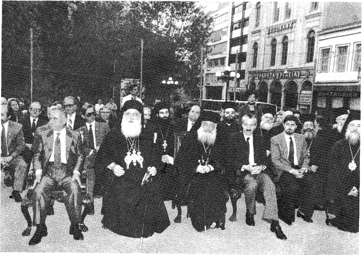
Οί Μακ. Προκαθήμενοι τοῦ Πατριαρχείου Ἱεροσολύμων καὶ τῆς Ἐκκλησίας τῆς Ἑλλάδος περιβαλλόμενοι ἀπὸ τοὺς δημάρχους Βηθλεέμ καὶ Ἀθηναίων στὴν τελετὴ ἀδελφοποιήσεως.

πόλεων Ἀθῆνας - Βηθλεέμ, πρὸς ὄφελος τῆς εἰρηνικῆς συνύπαρξης τῶν Λαῶν καὶ τοῦ πανανθρώπινου ἀγώνα γιὰ τὸ σταμάτημα τῶν πυρηνικῶν ἐξοπλισμῶν.