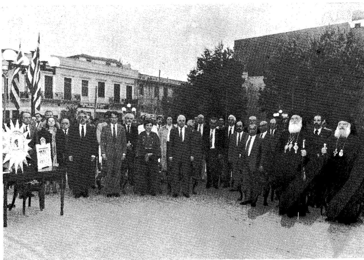
Οἱ Ὑπουργοὶ Ἐσωτερικῶν κ. Ἀγ. Κουτσόγιωργας, Ἐθν. Παιδείας καὶ Θρησκευμάτων κ. Ἀντ. Τρίτσας κ.ἄ. ἐπίσημοι στὴν τελετῇ. Δεξιὰ διακρίνονται οἱ σεπτοὶ Προκαθήμενοι τῶν Ἐκκλησιῶν Ἱεροσολύμων Ἑλλάδος.

Ἐκ παραλλήλων αἱ Ἀθηναὶ προικισμέναι μὲ τὴν ἔκπαυλον καλλιτεχνίαν ποῦ ἐκφράζεται ἕως τῶν ἡμερῶν ἡμῶν μὲ τὸν καλλιμάριμαρον Ναὸν τῆς Παλλάδος Ἀθηναῖς, τὸν Παρθενῶνα, τὸν μετέπειτα Ναὸν τῆς Παρθένου, εἶχον ἐπιβλητῆ εἰς τὸν κόσμον μὲ τὸν ἀνυπαγόμιστον πολιτισμὸν, τοὺς φιλοσόφους, τοὺς ἠγτορας, τοὺς ἱστορικοὺς καὶ τοὺς ἐπιστήμονας. Εἰς τὸ κλεινὸν τοῦτο ἄστυ, τὸ δημοκρατικὸν πνεῦμα τῶν Ἀθηναίων καὶ ἡ συνεχῆς πνευματικὴ καὶ ἐκπολιτιστικὴ αὐτῶν ἐπίδρασις εἰς τοὺς πέριξ λαοὺς, προετοίμασαν τὸν κάλυκα καὶ τὴν ὠσθήκη, μέσα εἰς τὰ ὁποῖα γονιμοποιήθηκε τὸ πνεῦμα καὶ ἡ διδασκαλία τοῦ Χριστιανισμοῦ καὶ συννοήσθηκε μὲ τὴν ἑλληνικὴν σκέψιν διὰ νὰ κατακυριεύσῃ τὸν κόσμον. Ἡ ἀρχαία λοιπὸν φιλοσοφία τῶν Ἑλλήνων προσέφερε ὅλον τὸν λογικὸν τῆς ἐξοπλισμὸν, τὴν συλλογιστικὴν σκέψιν τῆς καὶ τὴν μεθοδολογίαν τῆς εἰς τὴν ἀνάπτυξιν τῆς