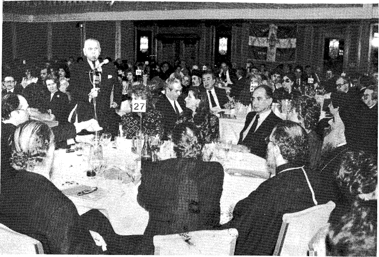
Στιγμιότυπο από την προσφώνηση του Προέδρου της Παγκοσμίου Ένωσης 'Αποδήμων Κυπρίων και της 'Ελληνικής Κυπριακής 'Αδελφότητας Δρος Όμ. Χαπίπη κατά το Δείπνο του Κληρικολαϊκού Συνεδρίου.

καρτερικότητα. Ο κοινός εκπαιδευτικός φορέας, χωρίς την 'Εκκλησία επικεφαλής δεν μπορεί να λειτουργήσει.