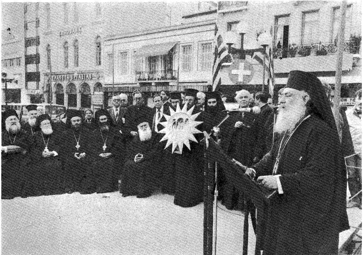
Τὸ «ἀστέρην» τῆς Βηθλεέμ, ἀναμνηστικὸ δῶρο τοῦ Μακ. Πατριάρχη Ἱεροσολύμων κ. Διοδώρου πρὸς τὸν Δῆμο Ἀθηναίων.