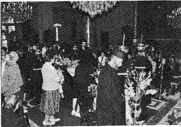
Κληρικοί καὶ λαϊκοὶ κατῶδουνοὶ συμπροσεύχονται γιὰ τὴν ἀνάπαυση τῆς ψυχῆς τοῦ ἀκαλοῦ ποιμένου των.

Ἡ πολυετής καὶ στενὴ συνεργασία μας στὴν Ἄρτα καὶ στὰ Γιάννενα ἐν συνεχείᾳ, ἀπὸ τότε πὸς ὡς Διάκος ἀκόμη προσελαμβάνεσο στὴν Μητρόπόλῃ μου (ὡς Ἄρτης) ἕως τότε πὸς σὲ εἶχα στὰ Γιάννενα ὡς βοηθὸ μου Ἐπίσκοπο Δωδώνης, ἐπαυξάνει τὴ συγκίνηση καὶ τὴ λύπη μου γιὰ τὸν ἀπροσδόκητο θάνατό σου.