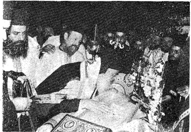
Ὁ Μακ. κ. Σεραφεῖμ δίδει τὸν «τελευταῖον ἀσπασμόν» στὸν κοιμηθέντα ἀείμνηστο Μητροπολίτη.

Μακαριώτατε, με ὠρίσατε ὁμιλητὴν εἰς τὴν ἀχαρὴν σημερινὴν σὺναξιν καὶ δηλῶ τὴν ἀδυναμίαν μου νὰ ὁμιλήσω διὰ τὸν Ἐπίσκοπον, ὁ ὁποῖος εἶναι ἐπίγειος ἄγγελος καὶ οὐράνιος ἄνθρωπος· καὶ μάλιστα νὰ σκιαγραφῆσω τὴν προσωπικότητα ἐνὸς Ἱεροαρχοῦ τοῦ μεγέθους τοῦ Μητροπολίτου Ν. Σμύρνης Χρυσοστόμου. Θὰ κάμω τὸ τόλμημα, ὅχι δι' ἡμᾶς τοὺς Ἐκκλησιαστικούς, ποῦ τὸν γνωρίσαμε, ἀλλὰ διὰ τὸν πολὺ λαὸν ὡς ἕνα δίδαγμα, ὡς ἕνα μὴ πραγματικὴ ἀπολογία τῆς Ἐκκλησίας στὸ σύγχρονον κόσμον.