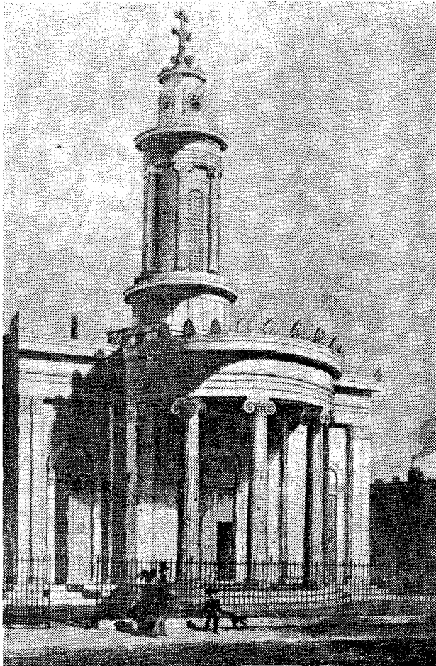
Ὁ Ἑλληνικὸς Ναὸς τῶν Ἁγίων Πάντων ἐν Λονδίῳ.

τῆς Ἐθνικῆς μας ταυτότητος καὶ τῆς θρησκευτικῆς μας κληρονομιάς εἶναι καθήκον ὄλων.