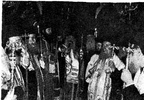
'Ο Μακ. κ. Σεραφεῖμ, ἐν μέσῳ 'Αρχιερέων, προϊσταται τῆς νεκρωσίμου 'Ακολουθίας.

«'Αλλὰ τῆς διακονίας μου ταύτης τίς ὁ ἐν χρόνῳ φορεὺς καὶ ἐνσαρκωτῆς; Φορεὺς ὁ ἀσίγαστος πόθος καὶ νόστος τῶν ἀπανταχοῦ τῆς 'Ελληνίδος καὶ ξένης γῆς διαθερμαινόμενος, ἐπ' ἐλπίδι στεροῦ, ψυχικός καὶ πνευματικός κόσμος τοῦ τιμίῳ καὶ μαρτυρικοῦ 'Ελληνικοῦ στοιχείου τοῦ ἐκ τῆς 'Ιωνίας γῆς ἔλκοντος τὴν καταβολὴν καὶ καταγωγὴν, ἐνσαρκωτῆς δὲ καὶ ἐμπροσθέντος διερχομένου, ὁ ἐν μέσῳ ἡμῶν διὰ τῆς πατρικῆς αὐτοῦ παρουσίας τιμῶν καὶ συγχαίρων κατὰ τὴν ἱερὰν ταύτην δι' ἡμᾶς καὶ ἱστορικὴν ὄντως ἡμέραν, προϊστάμενος τοῦ ἀποστολικοῦ τῶν 'Αθηναίων Θρόνου καὶ Πρόεδρος τῆς 'Εκκλησίας τῆς 'Ελλάδος σεβαστός μοι Γέρον 'Αρχιεπίσκοπος 'Αθηνῶν κ. Σεραφεῖμ, ὅστις ἔθεσεν ὡς ἐν ἐκ τῶν πρώτων μελημάτων αὐτοῦ, ἀφ' ἧς ἐν τῷ 'Αρχιεπισκοπικῷ ἀνήλθε Θρόνῳ, τὴν πραγμάτωσιν τοῦ διακαοῦς πόθου τοῦ