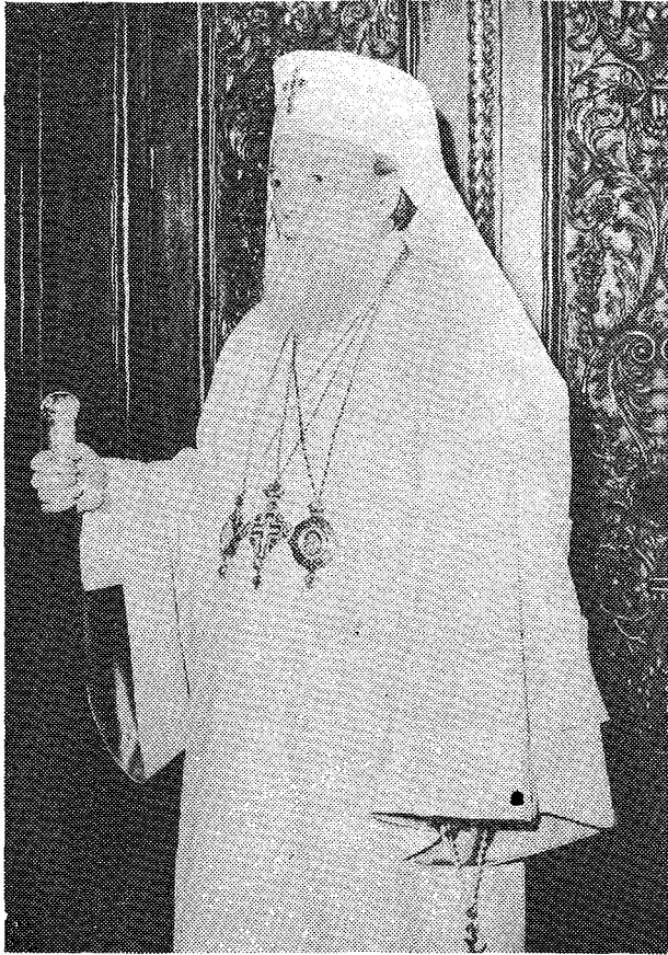
Ο νεοεκλεγείς Μακ. Πατριάρχης Ρουμανίας κ. Θεόκτιστος.

και ιδιαίτερα στην καινούργια μας κοινωνία». Κάνοντας σύντομη ανασκόπηση της εκκλησιαστικής ζωής και δραστηριότητας του νέου Πατριάρχου, ο Σεβ. Τρανσυλβανίας κ. Αντώνιος αναφέρθηκε κυρίως στην περίοδο 1950-1962, όταν ο νυν Πατριάρχης ως βοηθός Επίσκοπος και στενός συνεργάτης του μεγάλου τότε Πατριάρχου Ίουστινιανού, συνέβαλε ουσιαστικά στον προσανατολισμό της εκκλησιαστικής ζωής και της εκκλησιαστικής πραγματικότητας στις καινούργιες κοινωνικές και πολιτικές συνθήκες, που διαμορφώθηκαν στην Ρουμανία μετά τον 6' παγκόσμιο πόλεμο, βοήθησε να βρεθούν λύσεις σε κρίρια προβλήματα της Εκκλησίας όσον αφορά κυρίως τις σχέσεις ανάμεσα στην Εκκλησία και στο κράτος. "Επειτα, η εμπειρία, την οποία είχε ο Σεβ. Θεόκτιστος ως Επίσκοπος ARAD, ως Μητροπολίτης Όλτεστίας και, τέλος ως Μητροπολίτης Μολδαβίας είναι μια μοναδικής εμπειρίας, που επέτρεψε σ' αυτόν να γνωρίσει όλες περίπου τις περιοχές της Ρουμανίας. "Εχουμε την πεποίθηση —κατέληξε στον λόγο του ο Σεβ. Τρανσυλβανίας— ότι θα είσθε πιστοί κήρυξ της ορθόδοξου διδασκαλίας' ότι θα συνεχίσετε την παράδοση των τεσσάρων μεγάλων προκατόχων σας' ότι θα εντάξετε όρθως την Εκκλησία στον σύγχρονο κόσμο' ότι θα υπηρετήσετε πιστά, μαζί με όλους μας, μαζί με όλόκληρή μας την Εκκλησία, την Πατρίδα μας και τον λαό στον οποίο ανήκουμε' ότι θα καθο-