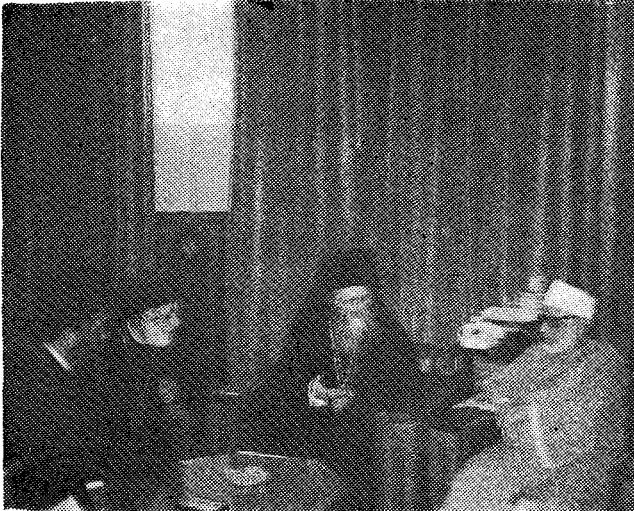
Ὁ Οἰκουμενικὸς Πατριάρχης κ. Δημήτριος με τὸν μεγάλο ἱερέα τῆς Αἰγύπτου. Μαζί του ὁ Πατριάρχης Ἀλεξανδρείας κ. Παρθένιος και ὁ Μητροπολίτης Ἑρμοπόλεως κ. Παῦλος.

«Παναγιώτατε Πάτερ και Δέσποτα, Μακαριώτατε Πατριάρχα Ἀλεξανδρείας, σεβασμιώτατοι και τιμιώτατοι Ἀρχιερεῖς τῶν δύο τιμίων προσβυτερῶν τῆς ἐν Χριστῷ διακονίας και ἀγαπητοὶ ἀδελφοί,