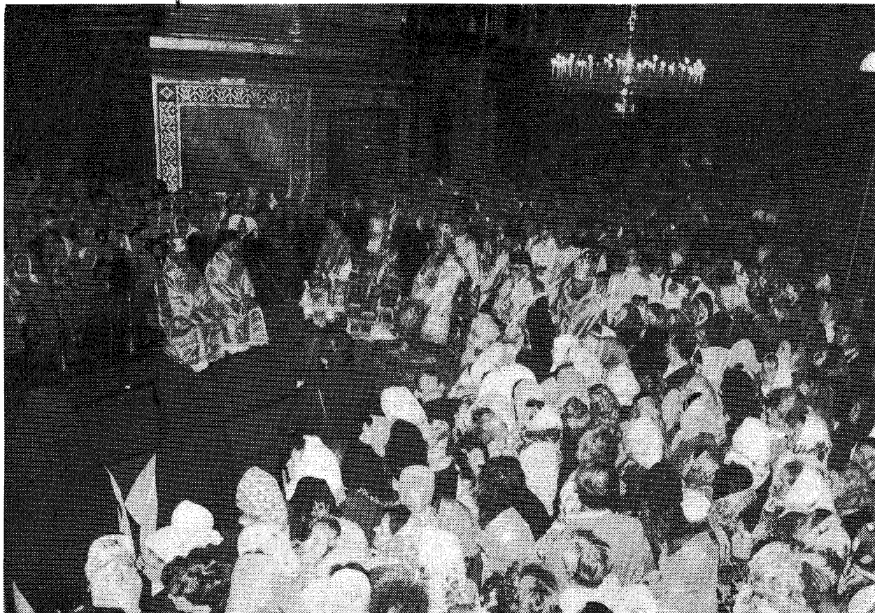
Στιγμιότυπον ἐκ τῆς Θ. Λειτουργίας ἐν τῇ Ἱ. Μονῇ Ποισάεφ (Οὐκρανία).

Ἄς ζητήσωμεν σήμερον ὅλοι μαζί τὴν μεσιτείαν τῆς Παναγίας «ἵνα μὴ ἦ σκίσμα ἐν τῷ σώματι» τῆς Ὁρθοδοξίας, «ἀλλὰ τὸ αὐτὸ ὑπὲρ ἀλλήλων μεριμνῶσι τὰ μέλη» (Α' Κορ. 12,25), εἰς δόξαν Θεοῦ καὶ ζῶ-