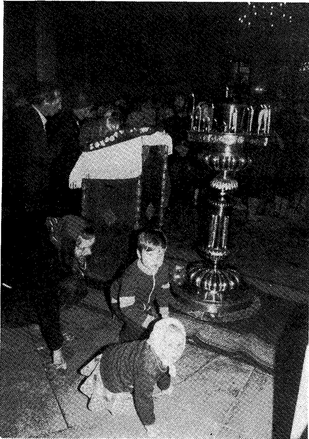
Στιγμιότυπον ἐκ τοῦ ἑσπερινοῦ ἐν τῇ Ἱ. Μονῇ Δανιὴλ ἐν Μόσχᾳ.

Ἐκκλησίας τῆς Ρωσσίας τοῦ σκηνώματος τούτου τῆς δόξης Κυρίου καὶ συγχαίρομεν ἐπὶ τούτῳ ταῖς ἀρμοδίαις Ἀρχαῖς τῆς Χώρας ταύτης.