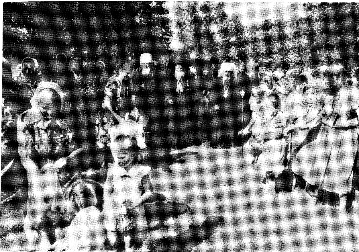
Σκηνή ἐκ τῆς Οὐκρανίας. Παιδιά ραΐουν μὲ ἄνθη τὸν δρόμον, τὸν ὅποιον διασχίζει ἡ Α.Θ.Π. ὁ Οἰκουμενικὸς Πατριάρχης, μεταβαίνων εἰς τὸν ἐνοριακὸν ναὸν των.

σαν μαρτυρίαν τῆς Ὁρθοδόξου Ἐκκλησίας εἰς τὸν ἀνήσυχον καὶ παραπαίοντα σύγχρονον κόσμον. Τὴν μαρτυρίαν ἡμῶν ταύτην καλεῖται νὰ διακονήσῃ καὶ ἡ Ἁγία καὶ Μεγάλη Σύνοδος, τὴν ὁποίαν ἐν φόβῳ Θεοῦ, ἐν ὑπευθυνότητι καὶ ἐν προσευχῇ ἐτοιμάζομεν ὄλαι αἱ κατὰ τόπους Ὁρθόδοξοι ἀδελφοὶ Ἐκκλησίου, ὑπὸ τὴν ἡγεσίαν καὶ τὴν συντονιστικὴν ἐνέργειαν τῆς πρωτοθρόνου Ἐκκλησίας τῆς Κωνσταντινουπόλεως.