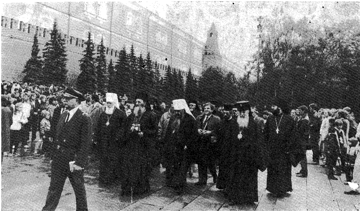
Μετά τὴν ὑπὸ τῆς Α.Θ.Π. τοῦ Οἰκουμενικοῦ Πατριάρχου κ. Δημητρίου κατάθεσιν στεφάνου εἰς τὸ Μνημεῖον τοῦ Ἀγνώστου Στρατιώτου πρὸ τοῦ Κρεμλίνου.

ἀγαθῶ τῶν λαῶν αὐτῆς καὶ εἰς συμβολὴν εἰς τὴν παγκόσμιον εὐημερίαν καὶ πρόοδον.