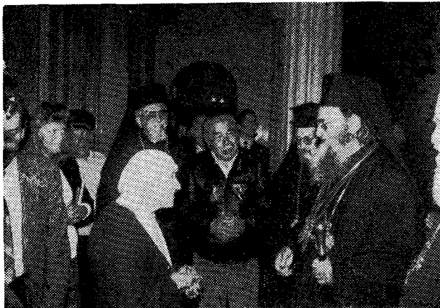
Ἡ Α.Θ.Π. ὁ Οἰκουμενικὸς Πατριάρχης κ. Δημήτριος μετὰ τῆς ἀδελφῆς Τερέζας, κατόχου βραβείου Νόμπελ εἰρήνης, ἐν Μόσχᾳ.

Ἰερώτατοι ἅγιοι ἀδελφοί, ἀγαπητοὶ πατέρες, ἐξοχώτατοι καὶ ἐντιμώτατοι, τέκνα ἐν Κυρίῳ ἀγαπητά,