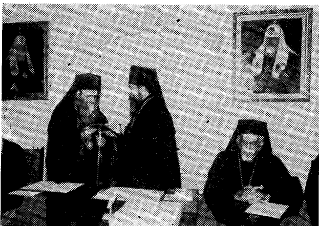
Ἀπονομή τοῦ διπλώματος τοῦ Ἐπιτίμου Διδάκτορος εἰς τὴν Α.Θ.Π. τὸν Οἰκουμενικὸν Πατριάρχην κ. Δημήτριον.

Εἶναι θαδεῖα ἡ χαρὰ ἡμῶν τε καὶ τῶν σὺν ἡμῖν, ἐπισκεπομένων ἐπισήμως τὸ ὄνομαστὸν τοῦτο φητώριον τῶν ὀρθοδόξων θεολογικῶν γραμμάτων, τὸ ὁ-