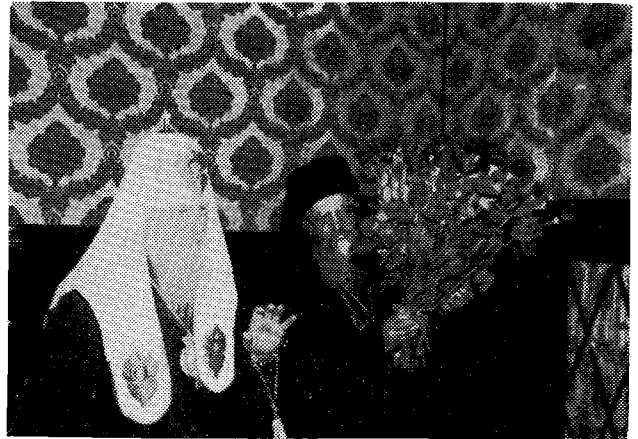
Προσφορά ἀνθέων εἰς τὴν Α.Θ.Π. τὸν Οἰκουμενικὸν Πατριάρχην κ. Δημήτριον ὑπὸ τοῦ Μακ. Πατριάρχου Μόσχας κ. Ποιμένου.

Τὸν Μακ. Πατριάρχην Μόσχας καὶ πάσης Ρωσίας κ. Ποιμένα ὁ Οἰκουμενικὸς Πατριάρχης ἐπεσκέ-