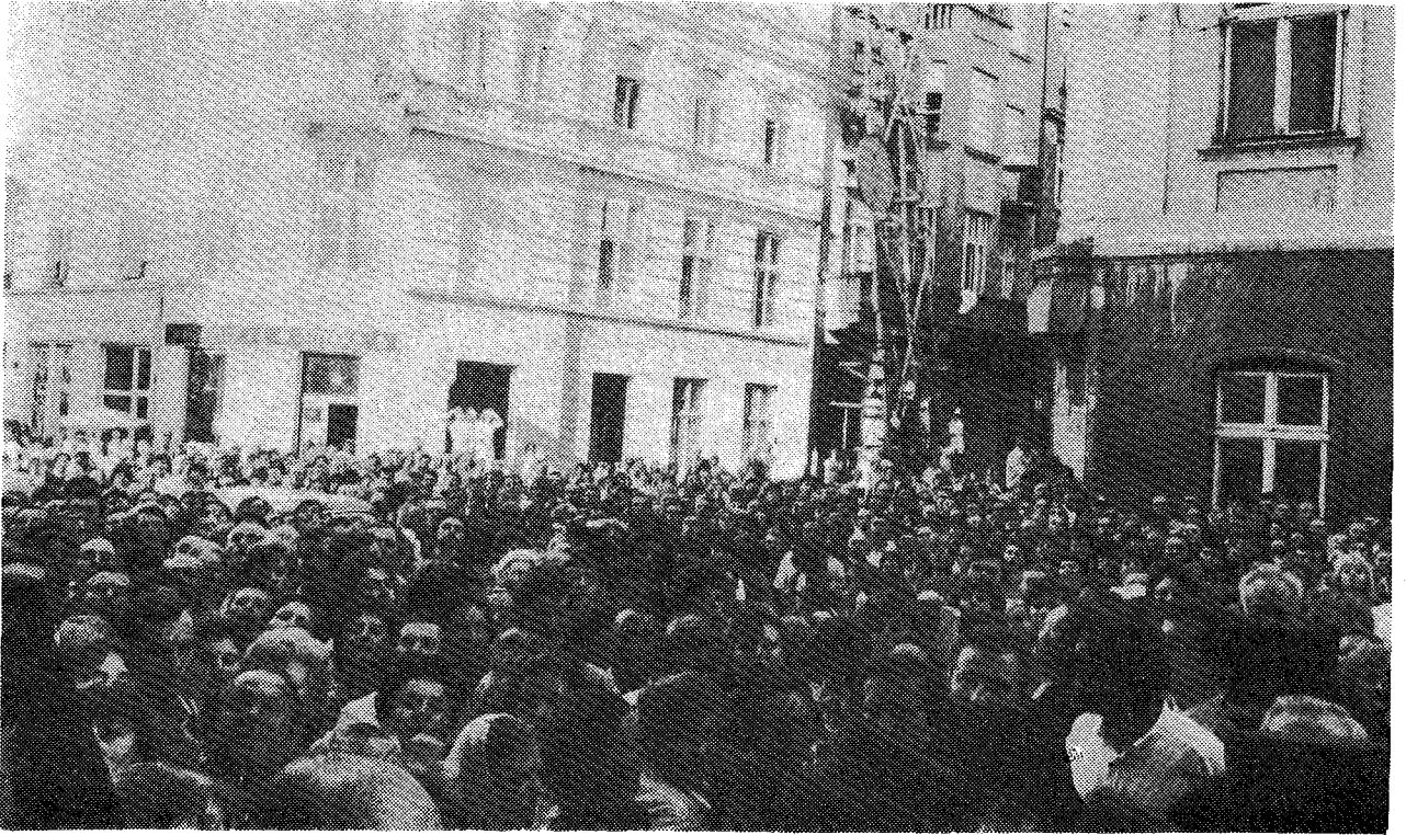
Πλήθη πιστών ἐν Λβῶφ (Οὐκρανία) ἀναμένουν πρὸ τοῦ Ἱ. Ναοῦ τῆς Μεταμορφώσεως, ἵνα ἴδουν τὴν Α.Θ.Π. τὸν Οἰκου- μενικὸν Πατριάρχην κ. Δημήτριον.

διαγαρόντας («ἐν ἀγνείᾳ καὶ σεμνῇ πολιτείᾳ») καὶ θεο- θέντας ἐν αὐτῇ Ἁγίους νὰ προσβέουσι ὑπὲρ τῶν ση- μερινῶν μοναχῶν, ὥστε καὶ αὐτοὶ νὰ περιπατοῦν ἀ- ξίως τῆς κλήσεως ἧς ἐκλήθησαν (Ἐφ. 4,1), «μὴ κα- τὰ σάρκα, ἀλλὰ κατὰ πνεῦμα» (Ρωμ. 8,1).