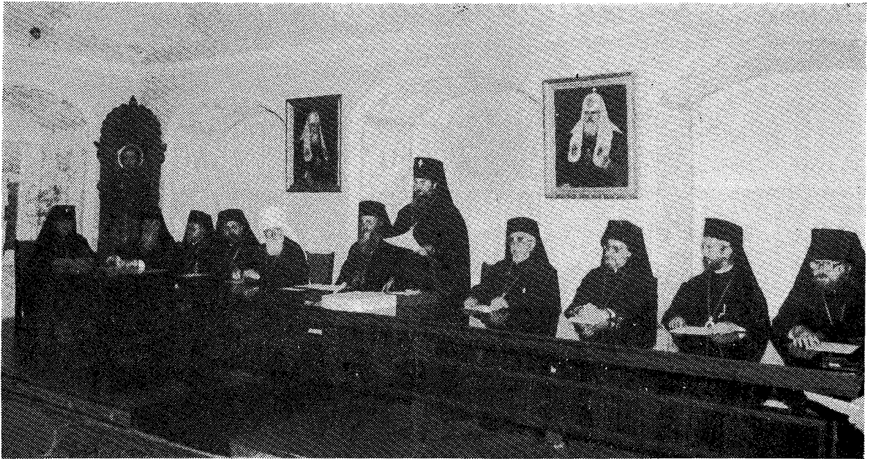
Στιγμιότυπον ἐκ τῆς ἀνακηρύξεως τῆς Α.Θ.Π. τοῦ Οἰκουμενικοῦ Πατριάρχου κ. Δημητρίου εἰς Ἐπίτιμον Διδάκτορα ἐν τῇ Θεολογικῇ Ἀκαδημίᾳ Μόσχας (Ζαγκόρσκ).

λέγεται καὶ ὅ,τι πράττεται σήμερον μεταξὺ αὐτῶν.