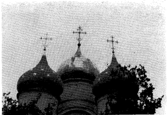
Τροῦλλοι ἐν Ζαγκόρσκ.

Τὴν Τετάρτην, 19 Αὐγούστου, ἡ Α. Θ. Πανα-