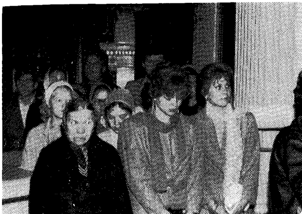
Στιγμιότυπον ἐκ τῆς παρακολουθήσεως Θ. Λειτουργίας ἐν Λένινγκραντ.

καὶ ἀγαπητὸς ἐν Κυρίῳ ἀδελφὸς κύριος Ποιμὴν καὶ νῦν ὁ Ἱερωτάτος καὶ πεφιλημένος ἐν Πνεύματι ποιμενάρχης τῆς ἐπαρχίας ταύτης, ἀλλὰ καὶ πάντες ὑμεῖς, ὁ κληρὸς καὶ ὁ λαὸς τῆς Ἐκκλησίας ταύτης, νὰ τελέσωμεν σήμερον τὴν Θεῖαν Λειτουργίαν εἰς τὸν περικαλλῆ καὶ ἱστορικὸν τοῦτον Ναόν. Εἴη τὸ ὄνομα τοῦ Κυρίου εὐλογημένον διὰ τὴν μεγάλην αὐτὴν δωρεάν.