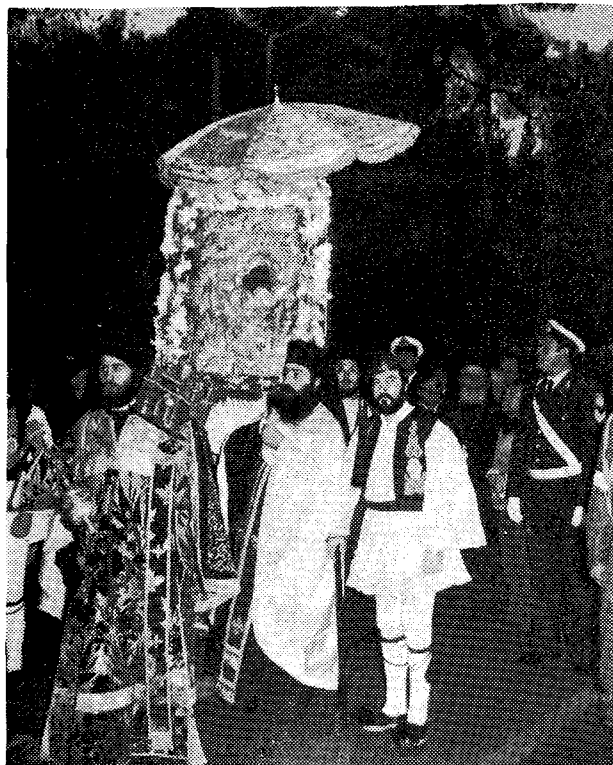
Ἡ Ίερᾶ Εικόνα μεταφέρεται στο χῶρο τῆς ἐπίσημης ὑποδοχῆς.

Ἡ Λεωφόρος Ἀμαλίας, ἡ Πλατεία Συντάγματος και ἡ Πλατεία του Μητροπολιτικοῦ Ναοῦ εἶχαν σημαιστολισθῆ με ἑλληνικῆς και θυζαντινῆς σημαίες ἀπὸ τῆν προηγούμενη ἡδῆ μέρα.