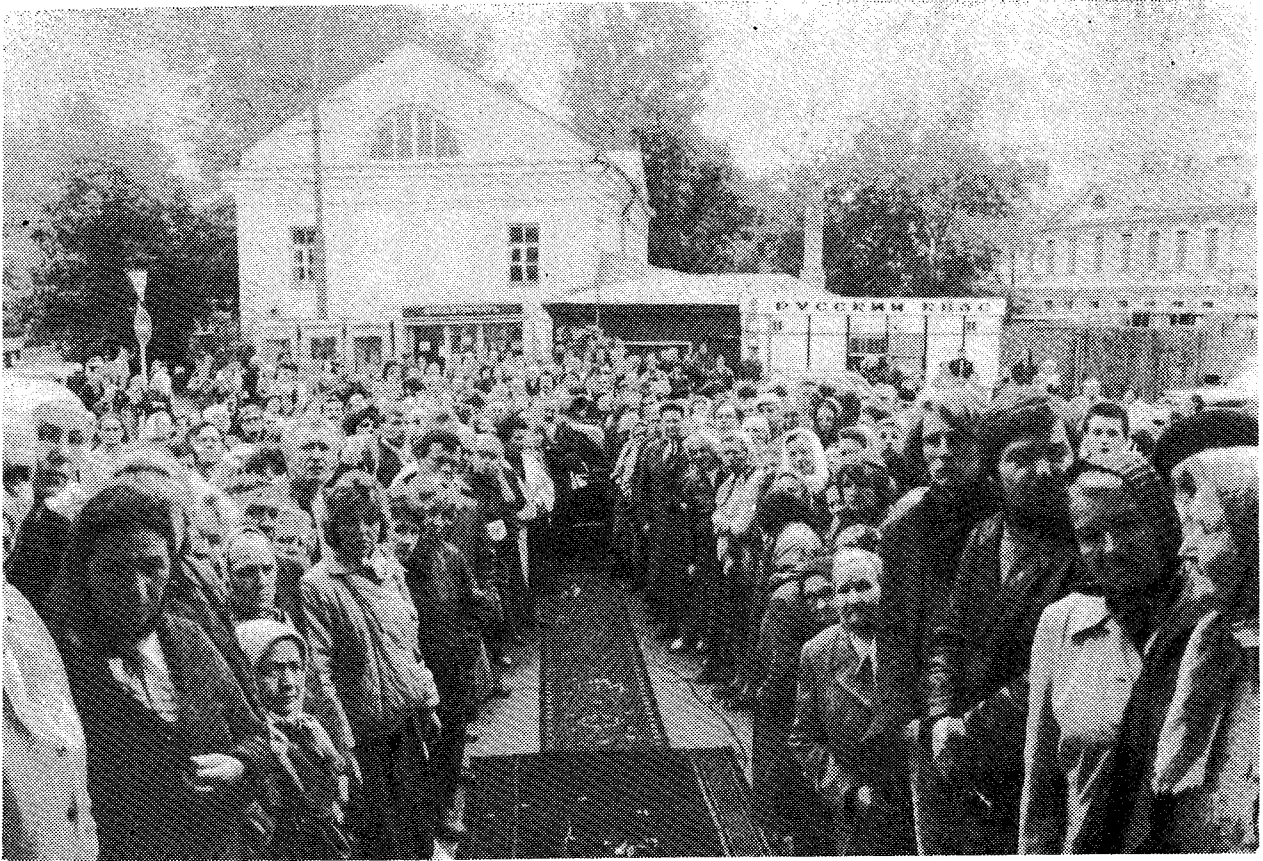
Πλήθη πιστῶν τῆς Μόσχας ἀναμένουν τὴν ἐκ τοῦ Ἱ. Νεοῦ ἔξοδον τῆς Α.Θ.Π. τοῦ Οἰκουμενικοῦ Πατριάρχου κ. Δημητρίου.

γιότης ἐπεσκέφθη τὴν περιώνυμον Μονὴν (Λαύραν) τοῦ Zagorsk. Ἐγένετο εἰς τὸν Ἀρχηγὸν τῆς Ὁρθοδοξίας μεγαλειώδης καὶ συγκινητικὴ ὑπόδοχή ἀπὸ μέρους τῶν μοναχῶν καὶ τῶν κατακλυσάντων τὴν Μονὴν καὶ τὰ περίξ πιστῶν. Ὁ Πατριάρχης Δημήτριος ἐν ἀρχῇ προσεκύνησε τὸ ἱερὸν Λεῖψανον τοῦ ἱδρυτοῦ τῆς Μονῆς καὶ πωλιούχου τῆς ρωσικῆς γῆς Ἁγίου Σεργίου τοῦ Ραδονέξ καὶ ἐν συνεχείᾳ ἐτέλεσεν ἐν συλλειτουργίᾳ μετὰ τοῦ Μακ. Πατριάρχου Μόσχας τὴν Θεῖαν Λειτουργίαν ἐν τῷ Ἱερῷ Ναῷ τῆς Ἁγίας Τριάδος τῆς Λαύρας ταύτης. Εἰς τὸ τέλος τῆς Θ. Λειτουργίας ὁ Μακ. Πατριάρχης Μόσχας κ. Ποιμὴν προσεφώνησε τὴν Α. Θ. Παναγιότητα, εἰπὼν: