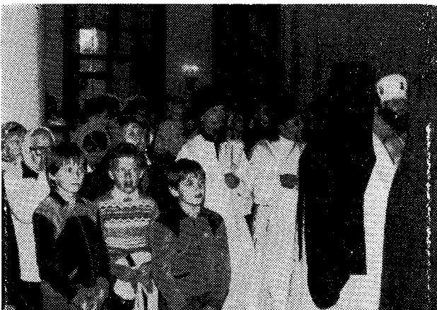
Στιγμιότυπον ἐκ τοῦ Ἑσπερινοῦ ἐν τῇ Ἱ. Μονῇ Δανιήλ (Μόσχα).

Ἐκφράζομεν τὴν χαρὰν ἡμῶν καὶ τῆς καθ' ἡμᾶς Ἐκκλησίας διὰ τὴν πρόσφαιον ἀπόδοσιν εἰς τὴν διάθεσιν καὶ τὴν διακονίαν τῆς ἀδελφῆς Ἀγιοτάτης