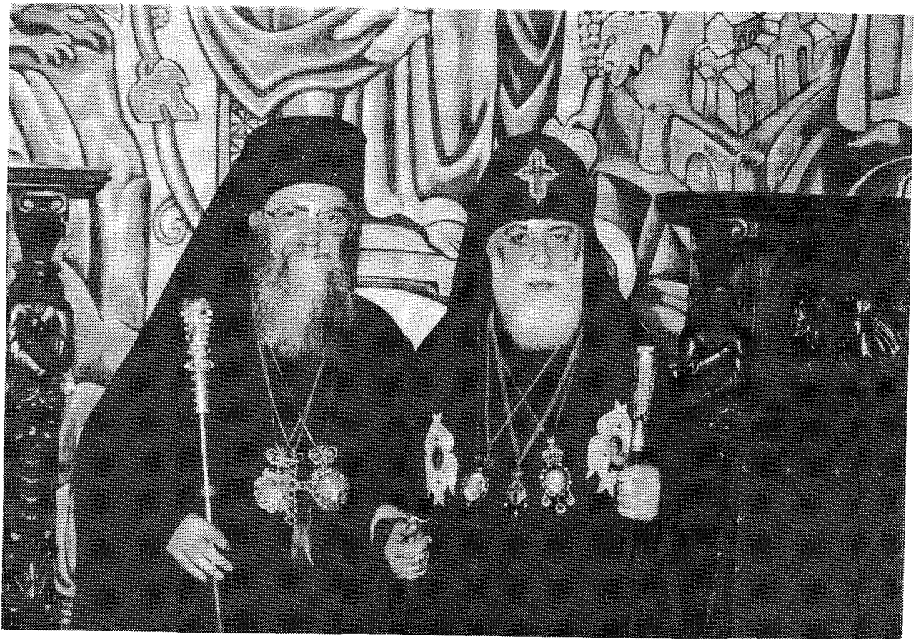
Ἡ Α.Θ.Π. ὁ Οἰκουμενικὸς Πατριάρχης κ. Δημήτριος μετὰ τοῦ Μακαριωτάτου Ἀρχιεπισκόπου Μετοχέτης καὶ Τιφλίδος καὶ Καθολικοῦ πάσης Ἰβηρίας κ. Ἡλίας τοῦ Β΄.

Δόξαν καὶ αἶνον ἀναλέμπομεν τῷ Δομήτορι τῆς Ἐκκλησίας Χριστῷ τῷ Θεῷ ἡμῶν, διὲ ἠξίωσεν ἡμᾶς ἵνα ἐκκληρώσωμεν ἐνδόμωχον ἱερὸν πόθον ἡμῶν καὶ ἀντιεπισκεφθῶμεν τὴν Ὑμετέραν γεραρὰν Μακαριό-