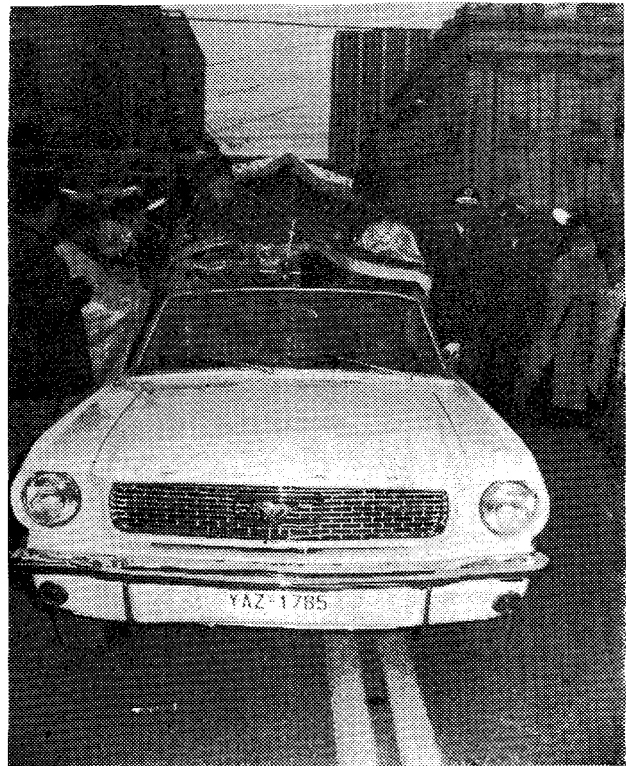
Καθ' ὁδὸν πρὸς τὴν Ἀθήνα.

καὶ Ρωστικοῦ, ἱερομονάχους Γερβάσιο καὶ Νικόλαο, ἐπιβιβάσθηκε σὲ πολυτελὲς ἀνοικτὸ αὐτοκίνητο, καὶ ἡ Ἱερὰ Κοινότης σὲ εἰδικὸ στρατιωτικὸ πούλμαν. Σχηματίσθηκε αὐτοκίνητο πομπή, μὲ τιμητικὴ συνοδεία μοτοσυκλετιστῶν τῆς Ἑλληνικῆς Ἀστυνομίας, ἣ ὁποία προχώρησε διὰ μέσου τῶν λεωφόρων Ποσειδῶνος καὶ Συγγροῦ πρὸς τὴν Ἀθήνα. Συγκινητικὲς ἦταν οἱ ἐκδηλώσεις εὐλαβείας τῶν πιστῶν, κατὰ τὴν διαδρομὴ αὐτῆ, ἰδίως στὸ χῶρο τοῦ «Φίξ», ὅπου παρέμεινε γιὰ λίγα λεπτὰ ἡ αὐτοκίνητοπομπή. Γονατιστὸς ὁ κόσμος, μὲ λαμπάδες στὰ χέρια, ἐξέφραζε μὲ τὸν πῦρ πη-