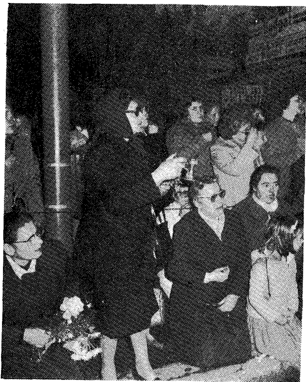
Έκδηλώσεις εὐλαβείας τῶν πιστῶν.

νε στο ύψος της Πύλης του Άδριανού, και ταυτόχρονα το Πυροβολείο του Λυκαβηττού χαιρέτιζε την άφιξη της Ίερᾶς Εικόνας με είκοσιένα κακονιοβολισμούς. Προηγούνταν αυτοκίνητο της Άστυνομίας και αυτοκίνητο της Άρχιεπισκοπῆς με τον παν. Πρωτοσύγκελλο - εκπρόσωπο του Μακαριωτάτου, τον παν. Πρωτεπιστάτη, τον Θεοφιλέστατο Ροδοστόλου και τον Πολιτικό Διοικητή του Άγίου Όρους, και ακολουθούσαν το άνοικτο αυτοκίνητο με την Ίερῆ Εικόνα, το αυτοκίνητο του Σεβ. Μητροπολίτου Πειραιῶς, με τον Σεβ. Μητροπολίτη Δημητριάδος, τᾶ αυτοκίνητα του Υπουργοῦ Έμπορικῆς Ναυτιλίας με τον Άντιπρόεδρο τῆς Βουλῆς και τον Γεν. Γραμματέα του Υπουργείου, του Νομάρχη, τῆς Ίερᾶς Κοινότητος και ἄλλων ἐπισήμων. Στο ὕψος τῆς ὁδοῦ Ὁθωνος στάθμευσαν, ἔγινε ἡ ἀποβίβαση τῆς Ίερᾶς Εικόνας, τῆν ὁποία παρέλαβαν τέσσερις ἀρχιμανδρίτες τῆς Άρχιεπισκοπῆς, και σχηματίσθηκε πομπή μέχρι τὸ χῶρο τῆς ἐπίσημης ὑποδοχῆς, τὸ Μνημεῖο του Άγνώστου Στρατιώτου.