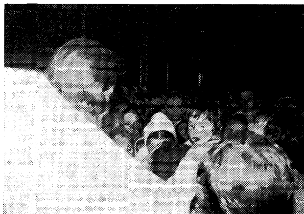
Θ. Κοινωνία ἐν τῇ Ἱ. Μονῇ Ποτσάεφ (Οὐκρανία).

Κατὰ τὴν ἐορτὴν τῆς Κοιμήσεως τῆς Θεοτόκου θὰ ἔχωμεν τὴν εὐλογία νὰ συλλειτουργήσωμεν ἐν Τιφλίδι μετὰ τοῦ ἀδελφοῦ Προκαθημένου τῆς Ἀγιο-