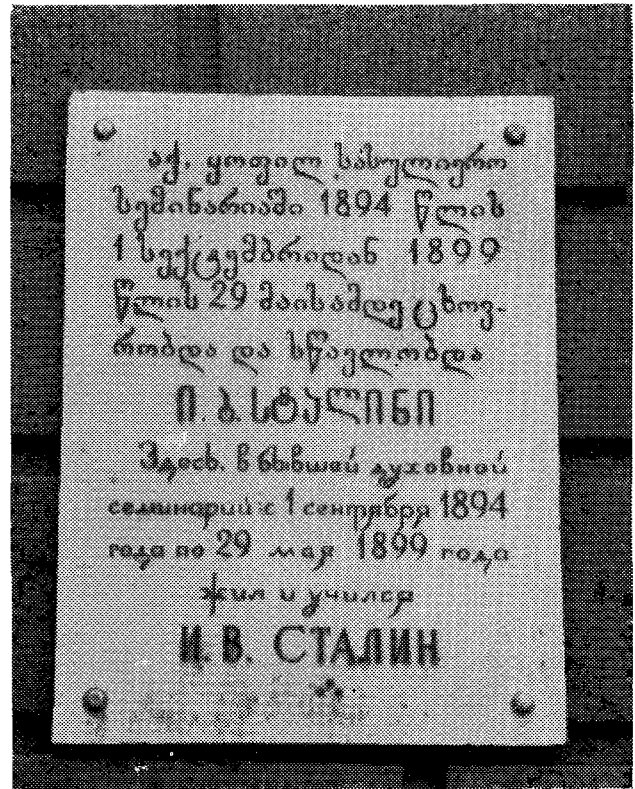
Πλάξ ἐν Τιφλίδι τῆς Γεωργίας μαρτυροῦσα ὅτι ὁ Στάλιν διέ-τέλεσεν ἱεροσπουδαστὴς ἐν τῷ Θεολογικῷ Σεμιναρίῳ τῆς Γεωργίας.

Ἀργότερον, ἡ Α.Θ. Παναγιότης ἐπεσκέφθη τὴν ἀρχαίαν Μετσχέτην, πρώτην πρωτεύουσάν τῆς Γεωργίας, καὶ τὸν ἐκεῖσε ἀρχαῖον Ναὸν τῶν 12 Ἀποστόλων (Βασιλικὴ τοῦ 11ου αἰῶνος), κτισθέντα ἐπὶ τοῦ ἀρράφου χιτῶνος τοῦ Κυρίου. Ἐντὸς τοῦ Ναοῦ τούτου, εἰς ὃν κατὰ τὸ ἔθος γίνονται αἱ ἐλθρονίσεις τῶν Προκαθημένων τῆς Ἐκκλησίας Γεωργίας, ὁ Μακ. Καθολικὸς προσεφώνησε τὴν Α.Θ. Παναγιότητα ἥτις καὶ ἀπήτησε καταλλήλως.