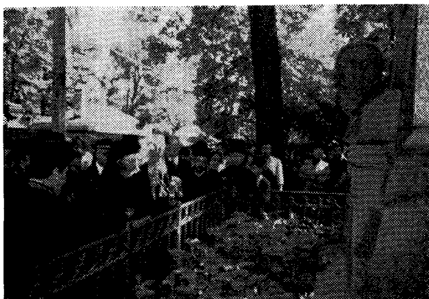
Ἡ Α.Θ.Π. ὁ Οἰκουμενικός Πατριάρχης καταθέτει ἄνθη εἰς τὸν τάφον τοῦ Ντοστογιέφσκυ.

Τὴν Δευτέραν, 24ην Αὐγούστου, ὁ Πατριάρχης Δημήτριος ἐπεσκέφθη τὸν Ἱερὸν Νεκροταφειακὸν Ναὸν τοῦ Ἁγίου Βλαδιμήρου, ἐν τῷ ὁποίῳ φυλάσσεται θαυματουργὸς εἰκὼν τῆς Θεομήτορος τοῦ Καζάν, ἔνθα ἐψάλη Δοξολογία. Ἐν συνεχείᾳ προσεκύνησεν εἰς τὸν Ἱερὸν Ναὸν τῆς Παναγίας τοῦ Σμολένσκ, ἔνθα καὶ ὁ τάφος τῆς μακαρίας Ξενίας, μεγάλως εὖ-