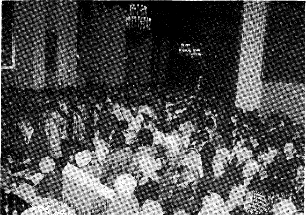
Στιγμιότυπον ἐκ τῆς Θ. Λειτουργίας ἐν τῷ Ἱ. Ν. Ἀγ. Τριάδος τῆς Λαύρας Ἀλ. Νέφσκι (Λένινγκραντ).

ρίας, καὶ ἐπεσκέφθη τὸν ἀδριάντα τοῦ Μεγάλου Πέτρου.