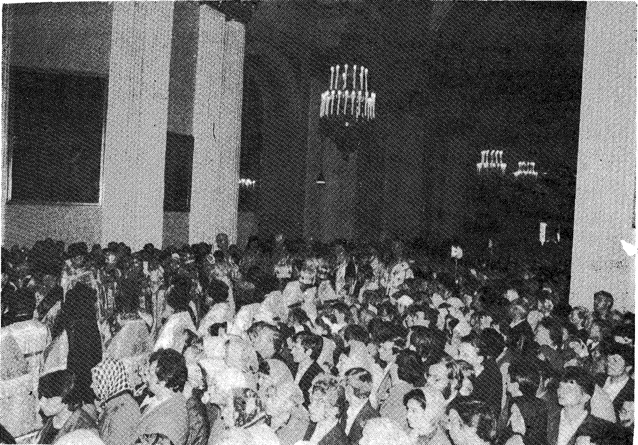
Στιγμιότυπον ἐκ τῆς Θ. Λειτουργίας ἐν τῷ Ἱ. Ναφ Ἁγ. Τριάδος τῆς Λαύρας Ἀλ. Νέφσκι (Λένινγκραντ). Ἐν τῷ μέσῳ τοῦ πλήθους τῶν πιστῶν διακρίνονται πολλοὶ νέοι.

ρας, τὰς ὁποίας δηλόδομεν ἐν Μόσχᾳ, τῇ ἔδρᾳ τοῦ Μακαριωτάτου ἀδελφοῦ Πατριάρχου Ποιμένος, ἡ ὑμετέρα ἀγάπη εἶχε τὴν εὐγένειαν νὰ μᾶς προσκαλέσῃ εἰς τὴν ἱστορικὴν ταύτην πόλιν, τὴν θεόσωσιον αὐτῆς ἐπαρχίαν, διὰ νὰ συνεχίσωμεν νὰ γενώμεθα δεσποτικῆς ξενίας, τῆς πατροπαράδοτον ἀδραμιαίας φιλοξενίας τοῦ εὐγενοῦς Ρωσικοῦ λαοῦ. Σᾶς εὐχαριστοῦμεν θερμότατα διὰ τὴν πρόσκλησιν καὶ τὴν ὑποδοχὴν σήμερον τὴν πρωΐαν.