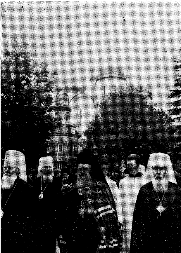
Ὁ Παναγιώτατος Οἰκουμενικὸς Πατριάρχης κ. Δημήτριος μετὰ ῥώσων Ἱεραρχῶν ἐν τῷ περιβάλλῳ τῆς Ἱ. Μονῆς - Λαύρας Ἀγ. Σεργίου ἐν Ζαγκόρσκ.

Παναγιώτατε! Ἐν μεγάλῃ ψυχικῇ ταραχῇ καὶ ἐγ-