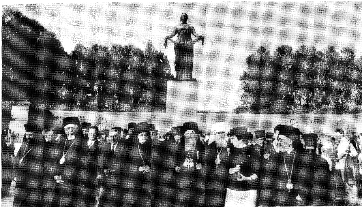
Πρὸ τοῦ Μνημείου τῶν πεσόντων κατὰ τὸν Β' Παγκόσμιον Πόλεμον (Λένινγκραντ).

Περὶ τὴν 16ην ὥραν καθ' ὁδὸν πρὸς τὸ ἀεροδρόμιον τοῦ Λένινγκραντ κατέθεσεν ὁ Οἰκουμενικὸς Πατριάρχης στέφανον εἰς τὸ ἥρωον τῆς Νίκης τῆς πόλεως, τὴν δὲ 17ην ὥραν ἀνεχώρησεν ἀεροπορικῶς διὰ Λβῶφ, προπεμφθεὶς ὑπὸ τοῦ οἰκείου Μητροπολίτου, τοῦ Κυβερνητικοῦ ἐκπροσώπου, κ.ἄ..