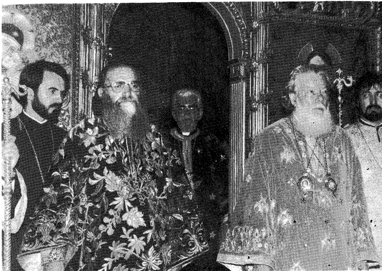
Οἱ Προκαθήμενοι τῶν Ἐκκλησιῶν Κωνσταντινουπόλεως κ. Δημήτριος καὶ Ρουμανίας κ. Θεόκτιστος εἰς τὴν Ὁραϊαν Πύλην, κατὰ τὸ συλλεῖτουργον.

ξων σχέσεων δυνάμεθα σήμερον νὰ προετοιμάζωμεν ἀπὸ κοινοῦ καὶ ἀρμονικῶς τὴν Ἁγίαν καὶ Μεγάλην Σύνοδον ἡμῶν, ἔργον, εἰς τὸ ὁποῖον οὐσιαστικῶς καὶ οἰκοδομητικῶς συμβάλλει ἀπ' ἀρχῆς ἢ καθ' Ὑμᾶς Ἐκκλησία, Μακαριώτατε, καὶ λέγομεν τοῦτο πρὸς τιμὴν αὐτῆς καὶ χάριν τῆς δικαιοσύνης. Εὐχηθῶμεν σήμερον ὁμοῦ ὅπως τὸ Πνεῦμα τὸ Ἅγιον ταχέως ἀγάγη ἡμᾶς εἰς τὴν σύγκλησιν τῆς Συνόδου ταύτης, ἣ ὁποία θὰ δώσῃ νέον δυναμισμὸν εἰς τὴν Ἐκκλησίαν ἡμῶν καὶ θὰ τὴν καταστήσῃ ἰκανωτέραν νὰ ἀνταποκριθῆται εἰς τὰς ἀπαιτήσεις τῶν καιρῶν καὶ εἰς τὰς σημερινὰς ἀνάγκας τῶν τέκνων τῆς.