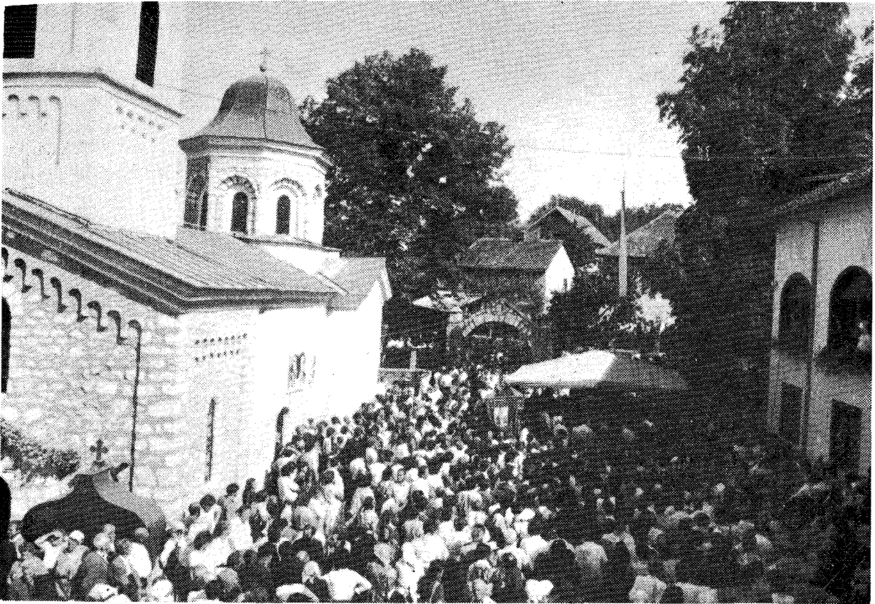
Γενική ἄποψις τῆς Ἱ. Μονῆς Τάβνας, τὴν ὁποίαν ἐπισκέφθη ἡ Α.Θ. Παναγιότης, ὁ Οἰκουμενικὸς Πατριάρχης κ. Δημήτριος.

Σὰς εὐλογῶ ὀλοψύχως. Προσεύχομαι διὰ Σὰς. Ὁ Θεὸς μαζί Σας», ἐνῶ τὸ πλῆθος προέβαινε εἰς συνεχεῖς ἐκδηλώσεις ζητωκραυγάζον. Καὶ ἐν Βάλιεβο προσελθόντες ἐχαιρέτισαν τὸν Πατριάρχην οἱ πολιτικοὶ ἄρχοντες τοῦ τόπου, ἦτοι ὁ Δήμαρχος καὶ ὁ Ἀντιδήμαρχος κ.κ. DUSA MIHAILOVIC καὶ MILOS MITROVICH.