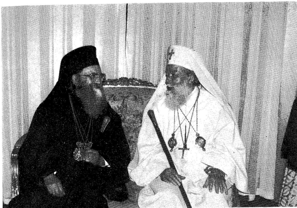
Ἡ Α.Θ.Π. ὁ Οἰκουμενικὸς Πατριάρχης κ. Δημήτριος, συνομιλῶν μετὰ τοῦ Μακ. Πατριάρχου Ρουμανίας κ. Θεοκτίστου.

ἐπὶ διμερῶν, διορθοδόξου καὶ διαχριστιανικοῦ ἀντικειμένου θεμάτων.