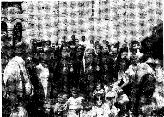
Ὁ Παναγιώτατος Οἰκουμενικὸς Πατριάρχης κ. Δημήτριος και ὁ Μακ. Πατριάρχης Σέρβίας κ. Γερμανὸς ἐν τῇ Ἱ. Μονῇ Γκρατοανίτσας (Κοσσυφοπέδιον).

Ἐν συνεχείᾳ, ὁ Πατριάρχης Δημήτριος ἐπισκέφθη τὴν Μονὴν τῆς Κοιμήσεως τῆς Θεοτόκου Κραγκούγεβατς, γενόμενος δεκτὸς ὑπὸ τοῦ οἰκείου Ἐπισκόπου Σεβ. Σουμαδίας κ. Σάββα, ὅστις, ἐν μέσῳ ἐνθουσιῶντος λαοῦ, προσεφώνησεν ἐπικαίρως τὴν Α. Θ. Παναγιότητα κατὰ τὴν φαλεῖσαν ἐν τῷ Καθολικῷ τῆς Μονῆς δοξολογίαν, προσειποῦσαν εἰς ἀπάντησιν λόγους καταλλήλους τῇ περιστάσει.