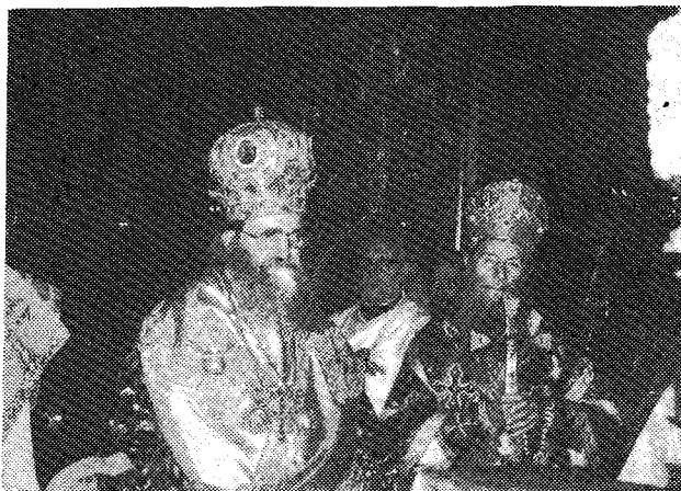
Έκ τῆς συνλειτουργίας τῶν Προκαθημένων τῶν Ἐκκλησιῶν Κωνσταντινουπόλεως καὶ Σερβίας ἐν τῇ Καθεδρικῇ Ναῶ Βελιγραδίου.

ἐν Βελιγραδίῳ καὶ ἄλλου πολυπληθοῦς ἐκλεκτοῦ ἀκροατηρίου.