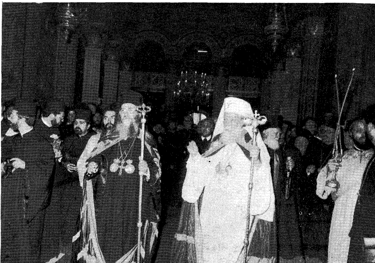
Ἡ Α.Θ. Παναγιώτης ὁ Οἰκουμενικός Πατριάρχης κ. Δημήτριος καὶ ὁ Μακαριώτατος Πατριάρχης Ρουμανίας κ. Θεόκτιστος κατὰ τὴν Δοξολογίαν ἐν τῷ Καθεδρικῷ Ναῷ Βουκουρεστίου.

ἐαυτὴν ὡς συνταντιζομένην πρὸς τὴν ἐδῶ Ἀγιοιᾶτην Ἐκκλησίαν, χαίρουσα μὲ τὴν χαρὰν καὶ λυπουμένη μὲ τὰς θλίψεις τῆς τετιμημένης καὶ ὑπερηφάνου ταύτης Ἐκκλησίας.