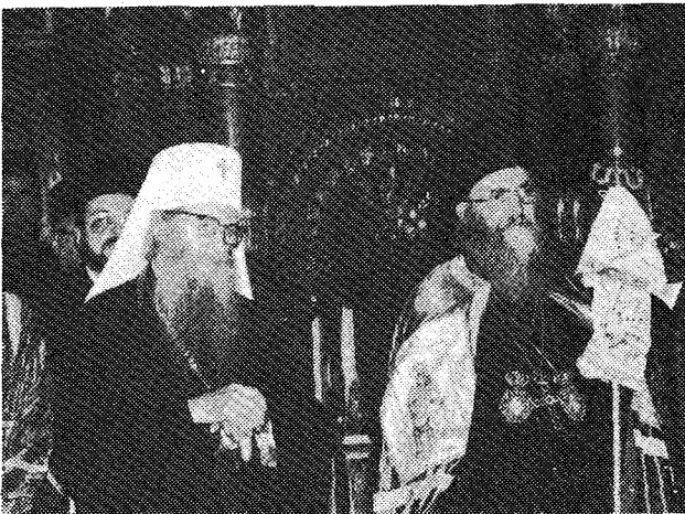
Οἱ Προκαθημένοι τῶν Ἐκκλησιῶν Κωνσταντινουπόλεως καὶ Σερβίας Παναγιώτατος κ. Δημήτριος καὶ Μακαριώτατος κ. Γερμανός, ἐν τῇ Καθεδρικῇ Ναῶ τοῦ Βελιγραδίου.

Μετὰ τὴν ἀνάγνωσιν τοῦ «ἐπαίνου» τοῦ Τιμωμένου σεπτοῦ Ὑποψηφίου καὶ τῆς ἀποφάσεως τῆς Σχολῆς, ὡς καὶ τοῦ σχετικοῦ Διπλώματος ὑπὸ τοῦ Πρυτάνεως αὐτῆς Ἀρχιμ. Εἰρηναίου Μπούλοβιτς, ἀπενεμήθη εἰς τὸν Παναγιώτατον Οἰκουμενικὸν Πατριάρχην «λόγῳ τῆς ἐν ἀφοσιώσει καὶ σεμνότητι διακονίας καὶ μεγάλης προσφορᾶς Αὐτοῦ πρὸς τὴν περίσειμον ἡμῶν Μητέρα Ἐκκλησίαν τῆς Κωνσταντινουπόλεως καὶ τὴν ὅλην Ὀρθοδοξίαν» τὸ Δίπλωμα καὶ τὰ συναφῆ διάσημα, ἐν μέσῳ συγκινητικῆς ἀτμοσφαιρᾶς καὶ πολλαπλῶν ἐκδηλώσεων σεβασμοῦ, τιμῆς καὶ ἀγάπης πρὸς τὴν ὑψηλὴν προσωπικότητα τοῦ Τιμωμένου ὑπὸ πάντων τῶν παρόντων, ὀρθίων καὶ παρατεταμένως χειροκροτοῦντων. Ἡ