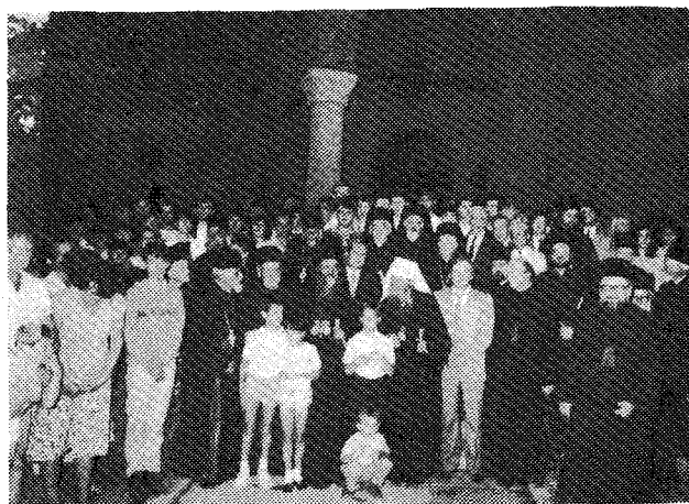
Ἡ Α.Θ.Π. ὁ Οἰκουμενικὸς Πατριάρχης κ. Δημήτριος καὶ ὁ Μακαριώτατος Πατριάρχης Σερβίας κ. Γερμανός εἰς τὰ Προπύλαια τῆς Θεολογικῆς Σχολῆς τοῦ Βελιγραδίου, ἐν μέσῳ τῶν Καθηγητῶν καὶ τῶν Σέρβων καὶ Ἑλλήνων φοιτητῶν.

Τὴν Δευτέραν, 14ην Σεπτεμβρίου, ἡ Α. Θ. Παναγιώτης, συνοδευομένη πάντοτε ὑπὸ τοῦ Μακ. Πατριάρχου τῶν Σέρβων καὶ τῶν μελῶν τῆς Ἱερᾶς Συνόδου τῆς