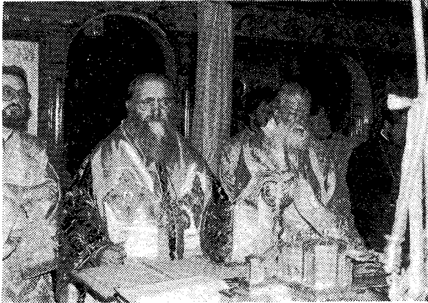
Στηγμιότυπον ἐκ τῆς συλλειτουργίας τῶν δύο Προκαθημένων.

Καθολικῆς καὶ Ἀποστολικῆς Ὁρθοδόξου ἡμῶν Ἐκκλησίας.