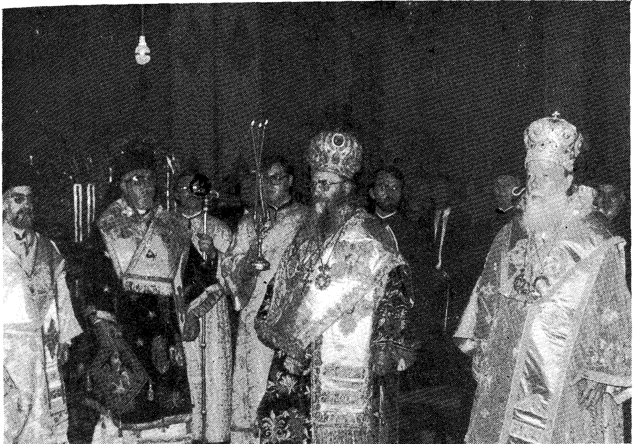
Ἐκ τῆς συλλειτουργίας τοῦ Παναγιωτάτου Οἰκουμενικοῦ Πατριάρχου κ. Δημητρίου καὶ τοῦ Μακαριωτάτου Πατριάρχου Ρουμανίας κ. Θεοκτίστου ἐν τῷ Καθεδρικῷ Ναῷ Βουκουρεστίου.

γματοποιήθη ἐν τῷ Πατριαρχικῷ Ναῷ ἡ συλλειτουργία τῶν δύο Πατριαρχῶν, Οἰκουμενικοῦ καὶ Ρουμανίας, περιστοιχουμένων ὑπὸ τῶν Ἀρχιερέων τῆς Συνοδείας τῆς Α. Θ. Παναγιότητος καὶ τῶν Μητροπολιτῶν Ὀλτενίας Νέστορος, Βανάτου Νικολάου, Μπουζαίου Ἐπιφανίου καὶ Ἀλμπαγιουλίας Αἰμιλιανοῦ, ἐπὶ παρουσίᾳ συμπάσης τῆς Ἱεραρχίας τῆς Ἐκκλησίας Ρουμανίας, ἐκπροσώπων τοῦ διπλωματικοῦ κόσμου καὶ πλήθους πιστῶν.