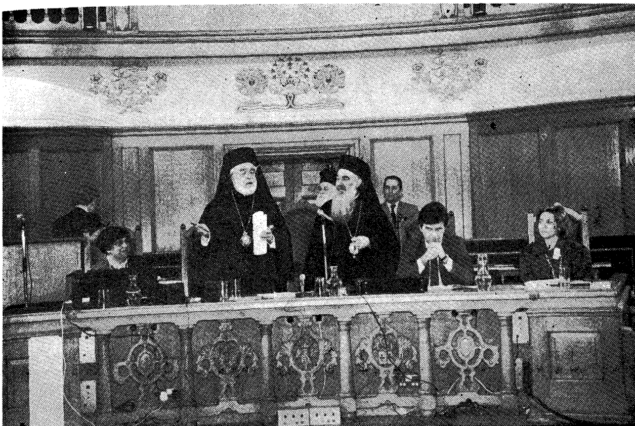
Στιγμιότυπο από τὸ Συνέδριο. Στὸ κέντρο εἶναι οἱ Σεβ. Ἀρχιεπίσκοποι Ἀμερικής κ. Ἰάκωβος καὶ Θαατεῖρων κ. Ἰάκωβος.

θμόν Πρωτ. Α 552 καὶ ἡμερομηνίαν 15 η Νοεμβρίου παρὶπλευσαντος ἔτους γράμμα τῆς ὑμετέρας ἀγαπητῆς Ἱερότητας, ὑποβαλλούσης τῇ Ἐκκλησίᾳ δι μεταξὺ λ' Ἰανουαρίου - α' Φεβρουαρίου ἀρξαμένου ἔτους δὲ πραγματοποιηθῶσιν ἐν τῇ θεοσώσιμῃ αὐτῆς Ἐπαρχίᾳ, ἐπ' εὐκαιρίᾳ τῆς ἐορτῆς τῶν τριῶν Ἱεραρχῶν, Συνέδριον καὶ Συμπόσιον, ἀμφότερα ἀφιερωμένα εἰς τὴν Ἀπόδημον Ἑλληνίδα.