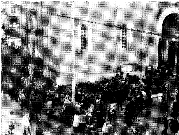
Εἰσβολὴ τεκμήριο τῆς πίστεως τοῦ λαοῦ.

Ἀπὸ τὴν ἐπομένη κιόλας, σύμφωνα μὲ τὸ καταρτισθὲν πρόγραμμα Ἀκολουθιῶν, ἄρχισαν νὰ τελοῦνται τὸ πρῶτ' Ὁρθρὸς καὶ θεία Λειτουργία, στὶς 11 π.μ. ἰ. Παράκληση, τὸ ἀπόγευμα Ἑσπερινὸς καὶ ἰ. Παράκληση καὶ τὸ βράδυ Ἀπόδειπνο μὲ τοὺς Χαιρετισμοὺς πρὸς τὴν Ὑπεραγία Θεοτόκο. Τοὺς Ἀγιορείτες Πατέρες ποὺ ἐγαλλάσσονταν στὸ διακόνημα τοῦ Προσμοναρίου τῆς Ἱερᾶς Εἰκόνας, τοὺς βοηθοῦσαν κληρικοὶ τῆς Ἱερᾶς Ἀρχιεπισκοπῆς, ἐνῶ στὸ Ἀναλόγιο διακονοῦσαν οἱ ἱεροφάστες τοῦ Ναοῦ καὶ ἄλλων Ναῶν τῆς Ἀρχιεπισκοπῆς, κληρικοὶ καὶ λαϊκοί, οἱ μοναχὲς τῆς Ἱερᾶς Μονῆς Παντοκράτορος Νταοῦ Πεντέλης κ.ἄ.