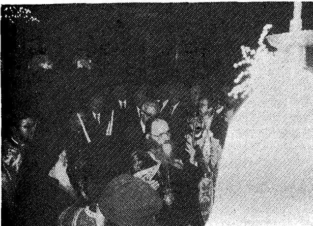
Ἁ Παναγιώτατος προσευχόμενος ἐνώπιον τῆς Ἱερᾶς Εἰκόνας.

Ἡ Ἱερὰ Κοινότης συμμετείχε στήν ἐπίσημη ὑποδοχή τῆς Α.Θ.Π. τοῦ Οἰκουμενικοῦ Πατριάρχου κ.κ. Δημητράκη κατὰ τὴν ἐπίσημη ἐπίσκεψη τοῦ Πατριάρχου στήν Ἐκκλησία τῆς Ἑλλάδος, καθώς καί σέ ὅλες τίς λατρευτικές καί λοιπές τιμητικές ἐκδηλώσεις πού ἔλαβαν χώρα κατὰ τὴν ἐπίσημη ἐπίσκεψη τοῦ Πατριάρχου στήν Ἐκκλησία καί τὴ χώρα μας: στήν πομπή καί τὴ Δοξολογία (Παρασκευή, 13 Νοεμβρίου), στὸν Ἑσπερινὸ στὸν Ἱερὸ Ναὸ Ἁγίου Παντελεήμονος Ἀχαρνῶν (Σάββατο, 14 Νοεμβρίου), στὸ Πατριαρχικό καί Συνοδικὸ Συλλεiturγο στὸ Μητροπολιτικὸ Ναὸ Ἀθηνῶν (Κυριακή, 15 Νοεμβρίου), καί στίς ἐπίσημες δεξιώσεις καί τὰ γεύματα.