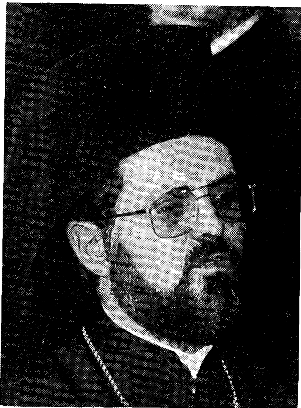
Ὁ Σεβ. Μητροπολίτης Λαοδικείας κ. Ἰάκωβος.

εὐκαιρίαν ὡς τε Ὑπογραμματεὺς καὶ ὡς Ἀρχιερατῆα τῆς Ἁγίας καὶ Ἱεράς Συνόδου νὰ διαισθανθῶ καὶ νὰ ἴδω διὰ τῶν ὀφθαλμῶν τῆς ψυχῆς μου τὴν Θεῖαν Πρόνοιαν, τὸ Πανάγιον Πνεῦμα, νὰ ἐπενεργῇ θαυμασίως, νὰ κατευθύνῃ κατὰ τὸ ἅγιον Αὐτοῦ δέλημα τὰ διαβήματα Ὑμῶν καὶ νὰ ἀποτελῇ πάντο-