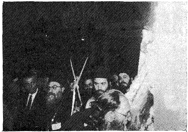
Ἁ Παναγιώτατος ἀσπάζόμενος τὴν Εἰκόνα τοῦ «Ἄξιόν Ἔστι».

Παρακολουθοῦμεν μετὰ προσοχῆς καί ἐνδιαφέροντος τὴν Ἱερὰν Σας πορείαν εἰς τὰς ἀπανταχοῦ τῆς γῆς αὐτοκεφάλους Ὄρθοδόξους Ἐκκλησίας καί συναγαλλόμεθα μεθ' Ὑμῶν, ὁρῶντες ἢ ἀκούοντες περὶ τῆς λαμπρᾶς ὑποδοχῆς, μεθ' ἧς γίνεσθε δεκτὸς ἐπὶ τοῦ ὀρθοδόξου κλήρου καί λαοῦ ἐκάστης χώρας, τὴν ὁποῖαν ἐπισκέπτεσθε καί τῶν αἰσθημάτων ἀγάπης καί