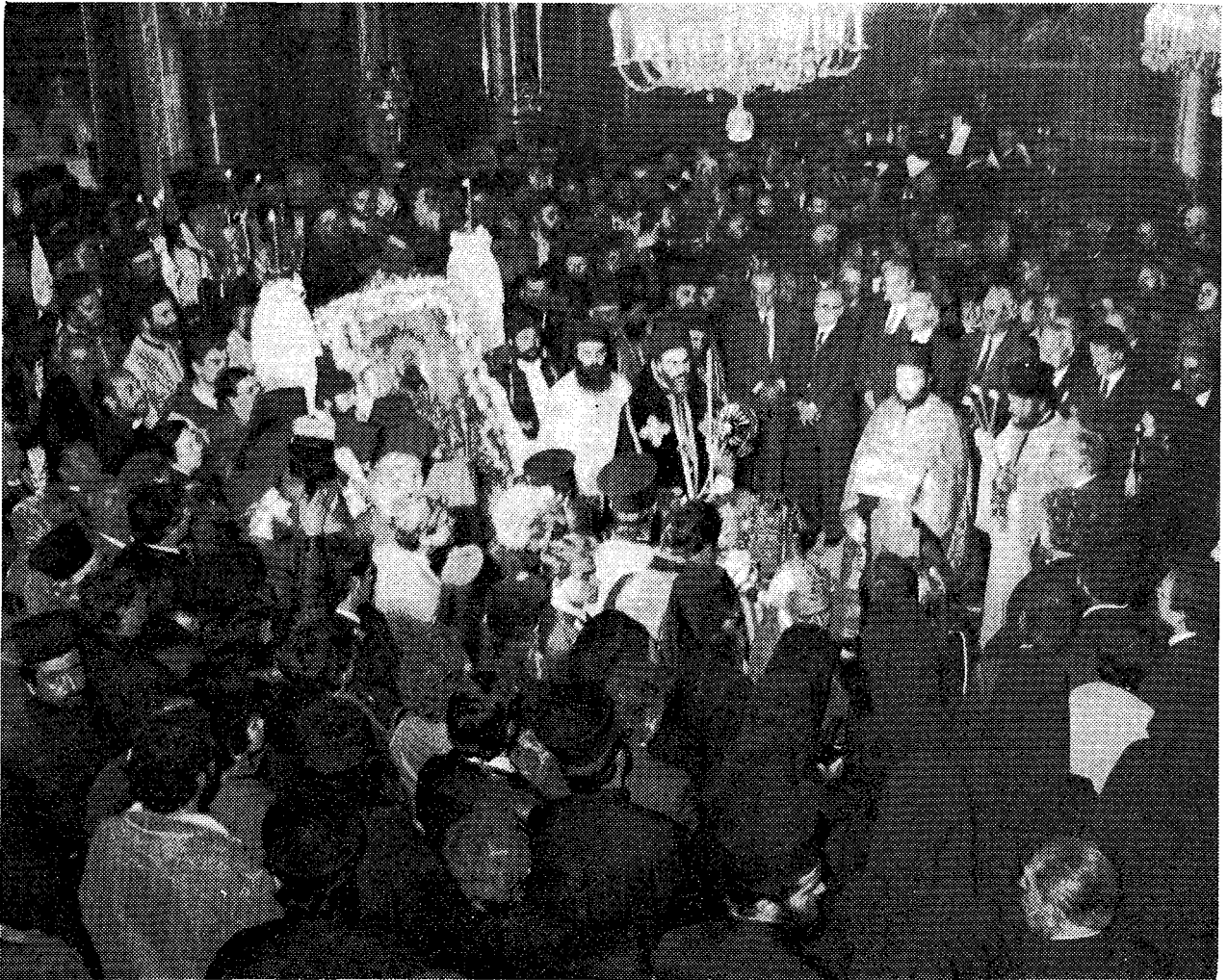
Στιγμιότυπο ἀπὸ τὴν ἐπίσημη Δοξολογία στὸν Καθεδρικό Ἱερό Ναό Ἀθηνῶν

εἶσθε ὁ δήμαρχος τῶν Ἀθηναίων. Καὶ ἐπειδὴ ἔχετε συνείδησιν τοῦ χρέους σας, βλέπομεν μὲ συμπάθειαν τὴν προσπάθειάν σας, διότι τὸ ἔργον σας δὲν εἶναι ἀπλῶς δύσκολον νὰ ὑλοποιηθῇ, ἀλλὰ πραγματικὸς ἀθλός, ἐὰν κατορθωθῇ.