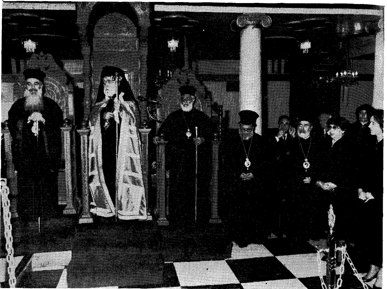
Στιγμιότυπο ἀπὸ τὸν Μέγαν Ἑσπερινὸν στὸν Ἱερό Καθεδρικό Ναὸ τῶν Ἁγίων Πάντων.

«Ἡ ὠραιότης τῆς Ἀποδήμιου Ἑλληνίδος». Ἡ ἐκλογή τοῦ θέματος αὐτοῦ δικαιολογήθηκε στὸν Πρόλογο τῆς ἑμιλίας ἀπὸ τὸν ἑμιλητὴ ὡς ἐξῆς: «Ὅλα ὅσα γράφτηκαν γιὰ τὸ Ἔτος τῆς Ἀποδήμιου Ἑλληνίδος καὶ ὅλα ὅσα χθὲς ἐλέχθησαν στὸ Παγκόσμιο Συνέδριο τῶν Ἀποδήμιων Ἑλληνίδων... δημιουργοῦν τὸ ἐρώτημα, ἐὰν ἀπὸ τὴν σκοπιὰ τῶν ἐμφύτων προδιαθέσεων τῆς Ἑλληνίδος θὰ ἠμπορούσαμε νὰ ἐπισημάνουμε ἓνα μέγιστο κοινὸ παρονομαστὴ καὶ παράγοντα, ὁ ὁποῖος ὡς ἐνοποιὸς πλαστικὴ δύναμις ἐμψυχώνει, διαμορφώνει, χρωματίζει καὶ καθιστᾷ ὁμογενεῖς καὶ ὁμοιογενεῖς τὶς πολύμορφες δραστηριότητες τῶν Ἀποδήμιων Ἑλληνίδων, χαρίζοντας ἐνότητα μέσα στὴν ποικιλομορφία τους. Ὁ ἐνοποιὸς αὐτὸς παράγων ἀπὸ ἀποψὶ γυναικειᾶς διοσφαιρας καὶ ψυχολογίας εἶναι ἡ πραγματικὴ ὠραιότης, ἡ ἀληθινὴ ὁμορφιά, ἡ ὁποία στεφανώνει τὴ γνωστὴ φυσικὴ χάρι κάθε Ἑλληνίδος... Γι' αὐτὸ, γιὰ νὰ μὴ ἐπαναλάβουμε καὶ στὴν ἑμιλία αὐτὴ ὅσα καθ' ἕλλην καὶ κατὰ τόσον συναρπαστικὸ τρόπο ἔχουν ἤδη λεχθῆ καθ'