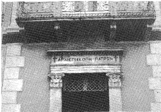
Πρόσοψις μεγάρου Ἀρχιεπισκοπῆς μετὴν ἐπιγραφὴν τοῦ κτήτορος.

δωσε τὴν σειρὰν τῶν ἐκκλησιαστικῶν λόγων του εἰς τὰ Εὐαγγέλια πασῶν τῶν Κυριακῶν τοῦ ἑνιαυτοῦ, διέ- νευμεν ἀνὰ ἓνα τόμον δωρεὰν εἰς ὅλους τοὺς ναοὺς, πόλεων καὶ χωρίων τῆς ἀρχιεπισκοπῆς, διὰ νὰ ἀνα- γινώσκειται κάθε Κυριακὴν, ὁ ἀντίστοιχος λόγος ἐκ τοῦ συγγράμματός του, ἀντὶ τοῦ «Κοινωνικοῦ».