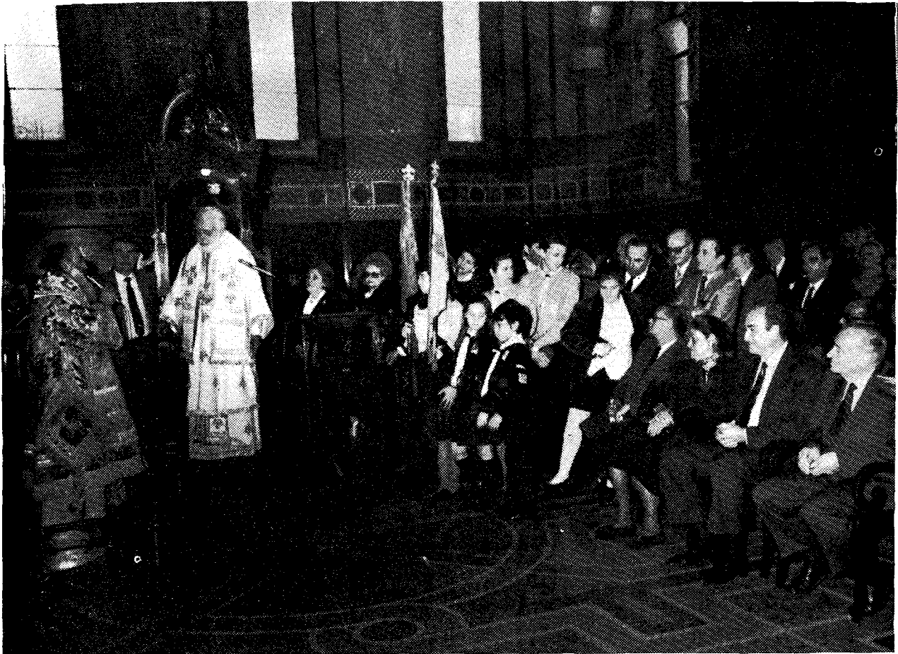
Στιγμιότυπο ἀπὸ τὴν Θεία Λειτουργία στὸν Ἱ. Καθεδρικό Ναό τῆς τοῦ Θεοῦ Σοφίας τῆ στιγμῆ, ποὺ ὁ Σεβ. Ἀρχιεπίσκοπος Ἀμερικῆς κ. Ἰάκωβος ἀκούει τὴν προσφώνησι τοῦ Σεβ. Ἀρχιεπισκόπου Θουατείρων κ. Μεθοδίου.

τόσον τοῦ περιεχομένου, ὅσον καὶ τῆς μορφῆς τῆς ὁμιλίας του καὶ προέτεινε τὴν μετάφρασι καὶ ἔκδοσί της στὴν ἀγγλικὴ γλῶσσα, γιὰ νὰ διανεμηθῆ σὲ ὅλες τὶς Ἑλληνίδες τῆς Ἀμερικῆς. Στὴ συνέχεια ὁ Ἅγιος Ἀμερικῆς ἐπήνεσε τὸ ἔργο καὶ τὶς λαμπρὲς πρωτοβουλίες τῆς Ἱ. Ἀρχιεπισκοπῆς Θουατείρων, ἐξῆρε τὴν πρὸς τὴν Ἐκκλησία ἀγάπη τῶν Ἑλλήνων τῆς Μ. Βρεταννίας καὶ ἄλλη μιὰ φορά ἐπεσήμανε τὴ σημασία τοῦ συνεδρίου καὶ παρουσίασε προανάκρουσμα τοῦ συγκλονιστικοῦ ἐγκωμίου, ποὺ ἔφαλε στὴν ἀπόδημο Ἑλληνίδα τὸ θράδυ τῆς ἰδίας ἡμέρας στὸ Παγκοινοτικὸ Συμπόσιο, στὸ ὁποῖο ἦταν τὸ κύριο τιμῶμενο πρόσωπο. Ἐπίσης παρουσίασε ἄλλη μιὰ φορά τὴν σύζυγο τοῦ ἀμερικανοῦ γεροστιαστοῦ κυρία Κάθριν Πόρτερ καὶ ἐξῆρε τὴν αὐτοθυσία της πρὸς χάρι τοῦ Κυπριακοῦ Ἑλληνισμοῦ. Ἀνάλογη ὑπῆρξεν ἡ ἐκ μέρους τοῦ Σεβ. Ἀρχιεπισκόπου Θουατείρων κ. Μεθοδίου εὐχαριστήρια προσφώνησις πρὸς τὸν Σεβ. Ἀρχιεπίσκοπο Ἀμερικῆς κ. Ἰάκωβο.