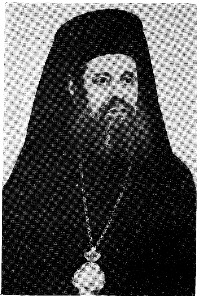
Ὁ μακαριστὸς Μητροπολίτης Ἄρτης κυρὸς Ἰγνατίος.

ἐκτην ὥραν — μετὰ τοῦ Κυρίου ἡμῶν, τὴν ἀγίαν ψυχὴν του. Πάμπολλα δέ, εὐρισκόμενα σήμερον εἰς ὄριμον ἡλικίαν — εἰς τὴν ἡλικίαν καθ' ἣν ἀναθεωρεῖ ὁ ἄνθρωπος τὰς δοθεῖσας αὐτῷ ἐν νεότητι συμβουλὰς καὶ νοουθεσίας — ἀπαρτίζον τὸν προῆρα τοῦ ποιμνίου τῆς Ἐκκλησίας τῆς νήσου Σαλαμῖνος. Δύναμαι ἐξ ὀνόματός των, νὰ εἶπω εἰς τὸν ἀπερχόμενον πνευματικόν των πατέρα, νὰ ἐνθυμηθῇ ἐνώπιον τοῦ θρόνου τοῦ Θεοῦ, ὅτι εἶναι οἰκειοὶ τῆς πίστεως ὅλοι αὐτοί. Καὶ νὰ τοὺς ἐνθυμηθῇ ὡς τοὺς ἐνεθυμείτο εἰς τὰς προσευχάς του. Καὶ ὅλοι αὐτοί, ἀποδεικνύον τὴν πνευματικὴν των οἰκειότητα, διαβεβαιοῦντες αὐτόν, ὅτι «ἐν ταῖς πλατείαις» αὐτῶν «ἐδίδαξεν...», ἐδίδαξεν τὸν λόγον τοῦ Θεοῦ, λόγῳ καὶ ἔργῳ. («Ἐφαγεν ἐνώπιόν των καὶ ἔπιεν»). Πολλὸν θὰ ἤθελον νὰ τὸν συναντήσουν κάποτε «ἐν τῇ βασιλείᾳ τῶν Οὐρανῶν». Εἶναι ἀληθές, ὅτι θὰ συναντήσωμεν ἀλλήλους ἐκεῖ. «Ναὶ ἐκεῖ, νὰ ἐκεῖ, θέλομεν ποτὲ συναντηθεῖ, ὦ Πατέρις Οὐρανό, τρισευδαίμων καὶ τρισποθητή», ὡς ἔφαλλον μὲ τὴν γλυκεῖαν φωνὴν του, μετὰ τοῦ Χριστιανικοῦ ὁμίλου τῶν Νεανίδων τῆς Νήσου Σαλαμῖνος. Ὅντως ἡ χριστιανικὴ ἀθανασία, ἔχει ὡς βάσιν, τὴν συνέχισιν τῆς προσωπικότητός μας, ἥτις μάλιστα ἐπὶ τὸ τε-