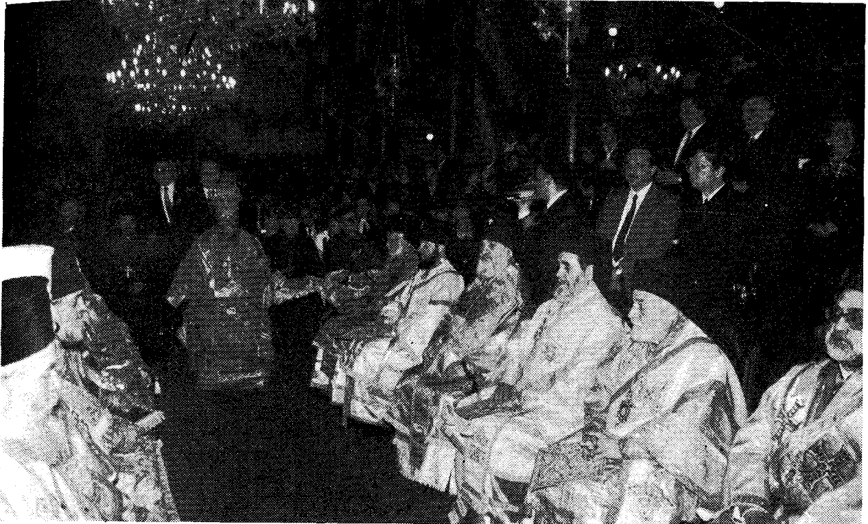
Στιγμιότυπον ἀπὸ τὴν πανηγυρικὴν καὶ πολυαρχιερατικὴν θείαν Λειτουργίαν εἰς τὸν πατριαρχικὸν ἱ. ναὸν Ἁγίου Γεωργίου.