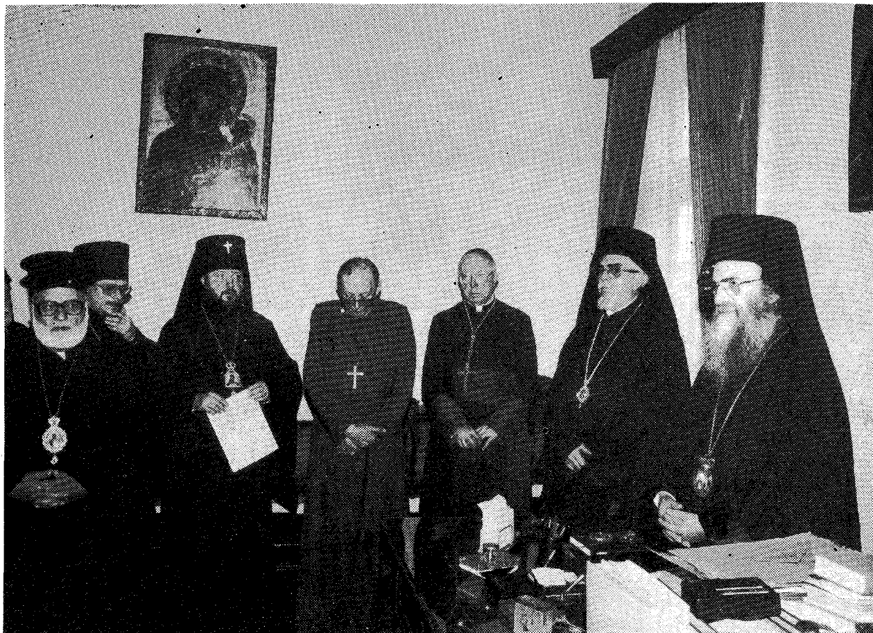
Ἡ Α.Θ.Π. ὁ Πατριάρχης κ. Δημήτριος ἔχων ἐκ δεξιῶν αὐτοῦ τὸν Σεβ. Μύρων κ. Χρυσόστομον, τὸν Καρδινάλιον κ. Ἰω. WIL-LEBRANDS, τὸν Ἐπίσκοπον κ. Η. HILL (Ἀγγλικανόν), τὸν Σεβ. Ἀρχιεπίσκοπον Σμολένσκ κ. Κύριλλον, τὸν Ἀρχιμ. Βεν. Κάντερς (Ρώσους) καὶ τὸν Σεβ. Μητροπολίτην Ἐπιφανείας κ. Ἠλίαν (Ἀντιοχείας).

μένω Θεῷ διὰ τὰ μεγάλα καὶ θαυμαστά ἀγαθὰ Του.