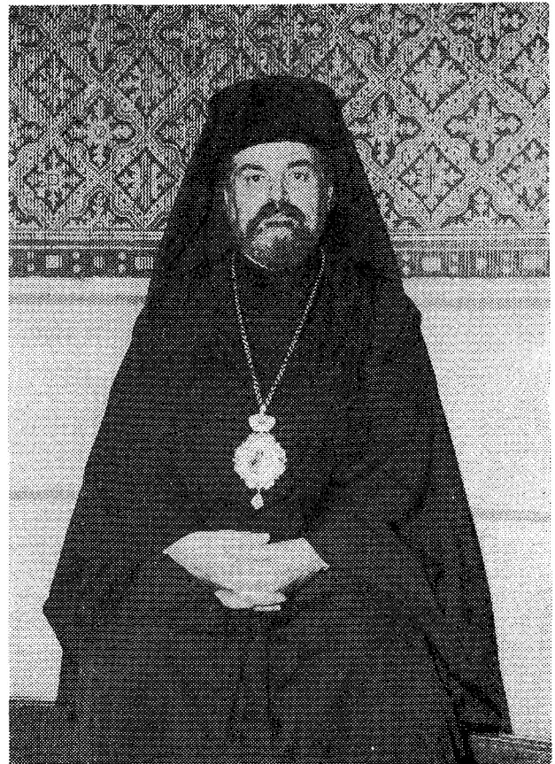
Ὁ Σεβ. Μητροπολίτης Γαλλίας καὶ Ἐξάρχος Ἰθρηίας κ. Ἱερεμίας

Σεβασμιώτατε καὶ ἀγαπητέ ἐν Χριστῶ ἀδελφέ Δέρκων κύριε Κωνσταντῖνε. Χαίρω ἰδιαιτέρως πὸν ἡ Μήτηρ Ἐκκλησία ὠνόμασε τὸ προσφιλὲς πρόσωπόν σου εἰς ἐκπροσώπησίν της κατ' αὐτὴν τὴν τελετὴν.