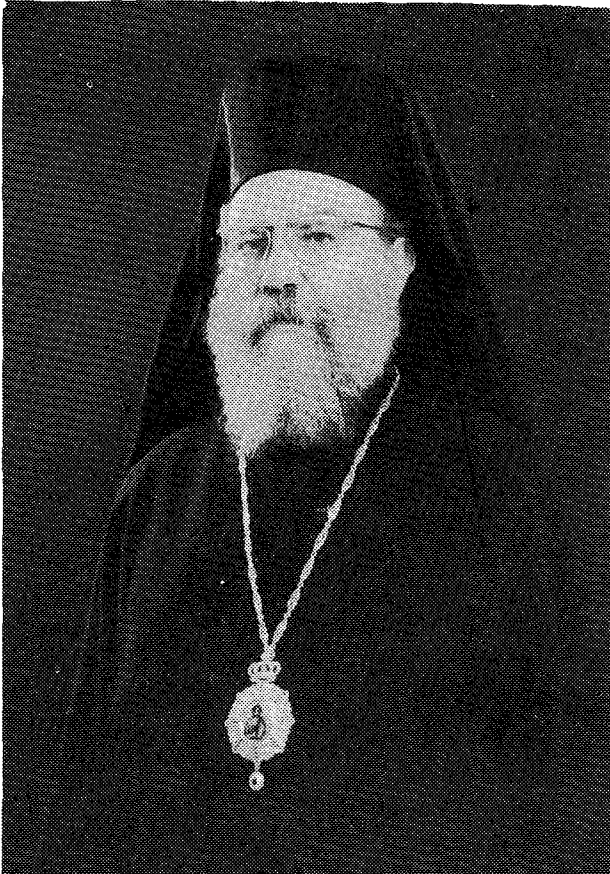
Ὁ Σεβ. Μητροπολίτης Λήμνου κ. Ἰερόθεος.

σωποι ἀνώτατοι ἀξιωματικοὶ τῶν τεσσάρων ἀρχηγῶν, Στρατοῦ, Ναυτικοῦ, Ἀεροπορίας καὶ Ἀστυνομίας, ἐλθόντες ἐξ Ἀθηνῶν, αἱ πολιτικαὶ καὶ στρατιωτικαὶ ἀρχαὶ καὶ ὁ ἱερός κληρὸς τῆς Νήσου καὶ πλῆθος λαοῦ, οἱ ὅποιοι παντοιοτρόπως ἐξέφραζον τὸν ἐνθουσιασμόν των διὰ τὸν νέον Μητροπολίτην των.