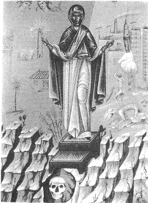
Έργον Εθαγγέλου Παχυγιαννάκη.

Τò Πάσχα του 1984 ή Ο.Α.Κ. φιλοξένησε τούς Έλληνες καλλιτέχνες, που μετέχουν στο πρόγραμμα.