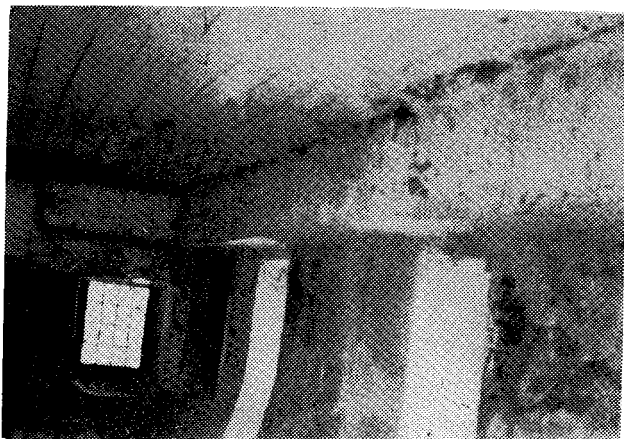
Ἡ ΒΑ. πλευρά τῆς τραπέζης.

τέχνη, εὐαισθησία καὶ σεβασμὸ πρὸς τὴν παραδοσιακὴ γραμμὴ.