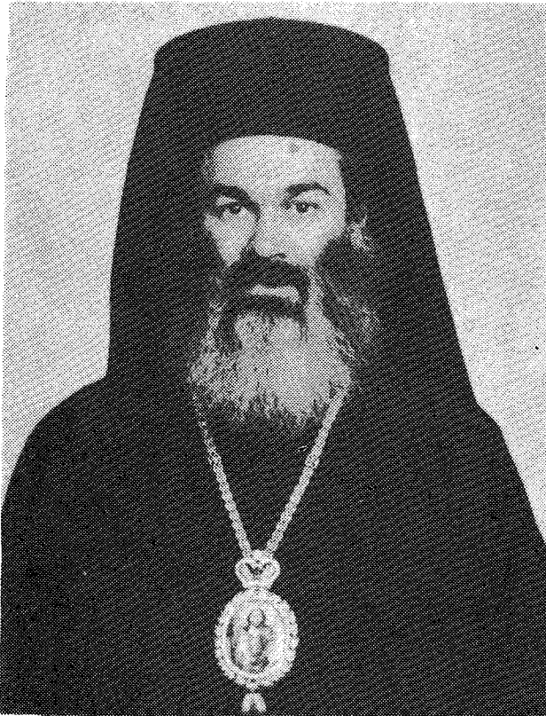
Ὁ Σεβ. Μητροπολίτης Λαρίσης καὶ Τυρνάβου κ. Δημήτριος ὁ Δ΄.

Ἡ Ἱερά Σύνοδος τῆς Ἱεραρχίας τῆς Ἐκκλησίας τῆς Ἑλλάδος συνήλθε σέ ἔκτακτη Συνεδρίαση, ὑπὸ τὴν προεδρία τοῦ Μακ. Ἀρχιεπισκόπου Ἀθηνῶν καὶ πάσης Ἑλλάδος κ.κ. Σεραφεῖμ, τὴν Τρίτη 10 Ὀκτωβρίου 1989, στὸ Συνοδικὸ Μέγαρο καὶ προέβη στὴν πλήρωση τῆς κενῆς Μητροπολιτικῆς ἑδρας Λαρίσης καὶ Τυρνάβου.