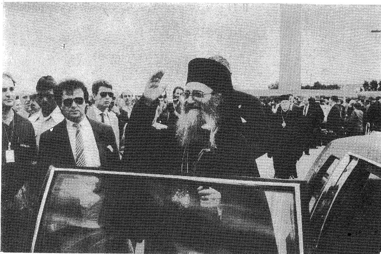
Ἡ Α. Θ. Παναγιότης εὐλογεῖ τοὺς Ὀμογενεῖς, ποὺ ἔσπευσαν νὰ τὸν καλωσορίσουν στὴ Βάση ANDREWS τῆς Οὐάσιγκτον, ὅπου τοῦ ἐπιφυλάχθηκε ἐπίσημη ὑποδοχὴ (Φωτ. Δ. Πανάγου).

Ἡ Ὀρθοδοξία σήμερον δὲν εἶναι ξέρον ἢ παρεπίδημον στοιχεῖον ἐν Ἀμερικῇ. Ἀποτελεῖ πλέον σάρκα ἐκ τῆς σαρκός της καὶ ὅτιοῦν ἐκ τῶν ὁστέων της. Ἡ φωνή της ἀκούεται μετὰ προσοχῆς καὶ σεβασμοῦ, καὶ οἱ ἐκκλησιαστικοὶ ἡγέται της ἔχουν λόγον βαρύνοντα εἰς τὴν ὄλην πορείαν τῶν ἐν τῇ Χώρα ταύτῃ πραγμάτων. Εἴμεθα, λοιπόν, ἐγγνώμονες εἰς τὸν Θεὸν καὶ εἰς τὴν Χώραν ταύτην, διότι ἐπέτρεψαν εἰς τὴν Ἐκκλησίαν μας νὰ ἔχη μίαν τοιαύτην παρουσίαν καὶ συμμετοχὴν εἰς τὴν ζωὴν τῆς Ἀμερικανικῆς Συμπολιτείας.