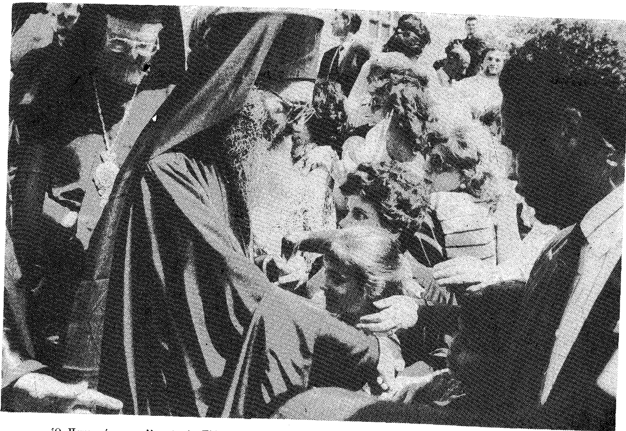
Ὁ Παναγιώτατος εὐλογεῖ πᾶ Ἑλληγόπουλα κατὰ τὴν ἐπίσκεψή του στὶς Η.Π.Α. (Φωτ. Δ. Πανάγου).

τὸ ἐπιτακτικὸν αἶτημα τῆς πνευματικῆς ἀνεξαρτησίας, ἣτις ἐπιτυγχάνεται διὰ τῆς ἐκ τοῦ Θεοῦ ἐξαγωγῆς καὶ τῆς ἐφαρμογῆς τοῦ θελήματος Αὐτοῦ. Μακρὰν τοῦ Θεοῦ ὁ ἄνθρωπος δὲν δύναται νὰ παραμείνῃ ἐλεύθερος καὶ ἀνεξάρτητος: ὑποδουλώνεται εἰς τὸ κακὸν καὶ αἰχμαλωτίζεται, διότι θέτει ἑαυτὸν ἔξω ἀπὸ τὴν προσηλυτικὴν ὁμολογίαν τῆς χάριτος τοῦ Θεοῦ.