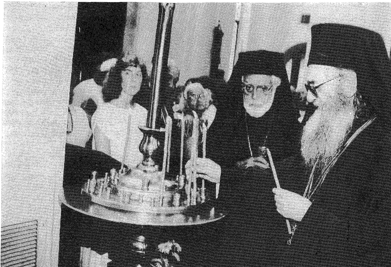
Ὁ Παναγιώτατος Οἰκουμενικὸς Πατριάρχης κ. Δημήτριος ανάβει κερὶ στὸν ἱερὸ ναὸ εὐθὺς μετὰ τὴν ἀφιξή του στὴν Οὐάσιγκτον.

ίας, αἱ ὁποῖαι ὑπῆρξαν τὰ θεμέλια τῆς Χώρας των καὶ διὰ τὰ ὁποῖα ἠγωνίσθησαν καὶ ἐμόχθησαν οἱ πρόπατορές των. Ὁ κόσμος σήμερον ἀντιμετωπίζει, λόγω ἀκριβῶς τῶν ἐπιτευγμάτων τῆς τεχνολογίας καὶ ἔνεκα τῆς ὑλικῆς εὐδαιμονίας του, τεράστια προβλήματα ἠθικῆς καὶ πνευματικῆς φύσεως, τὰ ὁποῖα ἀπειλοῦν νὰ ἀφανίσουν ὀλόκληρον τὸ οἰκοδόμημα τοῦ πολιτισμοῦ μας καὶ αὐτὸν ἀκόμη τὸν πλανήτην μας. Ἡ Χώρα αὐτὴ πρέπει νὰ ἠγηθῆ μιᾶς ἠθικῆς καὶ πνευματικῆς ἀναγεννήσεως διὰ τὸ καλὸν τῆς ἀνθρωπότητος. Τοῦτο ἀποτελεῖ τὴν εὐχὴν καὶ τὴν ἔκκλησίαν μας, καθὼς ἀφικνούμεθα εἰς αὐτήν.