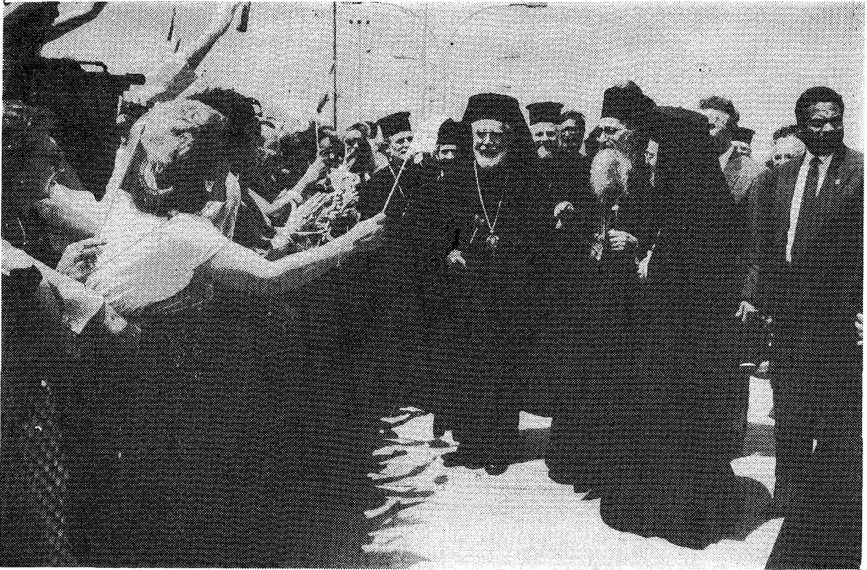
Οἱ Ὀμογενεῖς ὑποδέχθηκαν μὲ ἐνθουσιασμό τὸν Οἰκουμενικὸ Πατριάρχη στὶς Η.Π.Α. Δίπλα του διακρίνονται ὁ Μητροπολίτης Γέρων Χαλκηδόνος κ. Βαρθολομαῖος καὶ ὁ Ἀρχιεπίσκοπος Β. καὶ Ν. Ἀμερικῆς Γέρων κ. Ἰάκωβος (Φωτ. Δ. Πανάγου).

τισμὸν καὶ περιπυσσόμεθα ἀδελφικῶς, πρώτιστα μὲν πάντων τὴν ὑμετέραν περισπούδαστον Ἱερότητα, προσφιλέστατε ἐν Κυρίῳ ἀδελφε καὶ συλλειτουργῆ Ἀρχιεπίσκοπε Ἀμερικῆς Βορείου καὶ Νοτίου κύριε Ἰάκωβε, εἶτα δὲ τοὺς περὶ ὑμᾶς ἁγίους Ἀρχιερεῖς, εὐλογοῦντες ἅμα πατρικῶς τὸν εὐλαβέστατον κληρὸν καὶ τὸν πιστὸν λαὸν τῆς Ἱερᾶς ἡμῶν ἐνιαῦθα Ἀρχιεπισκοπῆς, εἶτα δὲ καὶ τὰς ἀρχὰς τῆς Χώρας ταύτης ἐν τῷ προσώπῳ τοῦ Ὑπουργοῦ Ἀπομάχων Ἐξοχωτάτου κυρίου Ἐδουάρδου Ντερβίνσκι καὶ τοῦ Διευθυντοῦ Πρωτοκόλλου τοῦ Λευκοῦ Οἴκου Ἐξοχωτάτου κυρίου Ἰωσήφ Ρέντι καὶ πάντας ὅσοι ἠγαθύνθησαν νὰ παρευρίσκωνται ἐνιαῦθα ὑποδεχόμενοι ἡμᾶς καὶ τὴν συνοδείαν ἡμῶν. Κύριος ὁ Θεός, ὁ εὐλογητὸς εἰς τοὺς αἰῶνας, εὐλογῆσαι πάντας ὑμᾶς καὶ συμπαντα τὸν λαὸν τῆς ἐνδόξου Συμπολιτείας ταύτης.