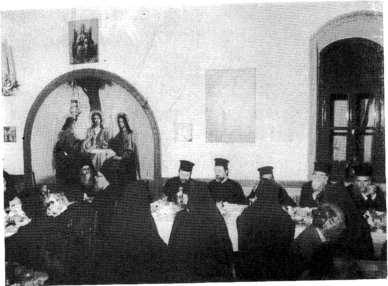
Στήν Τράπεζα τοῦ Κελλίου τοῦ Ἁγίου Νικολάου στοῦ Μπουραζέρι, όπου φιλοξενήθηκε ὁ Παναγιώτατος μετὰ τὴ συνοδεία του κατὰ τὴν παραμονή του στὴν ἀθωνικὴ πολιτεία.

λος Σόροσκ τῆς αὐτῆς ἐποχῆς καὶ ἀργότερον ὁ ἅγιος Μάξιμος ὁ Γραικὸς ἐνίσχυσαν περαιτέρω τοὺς δεσμούς τῶν ρώσων μετὰ τῶν ἀγιορειτῶν.