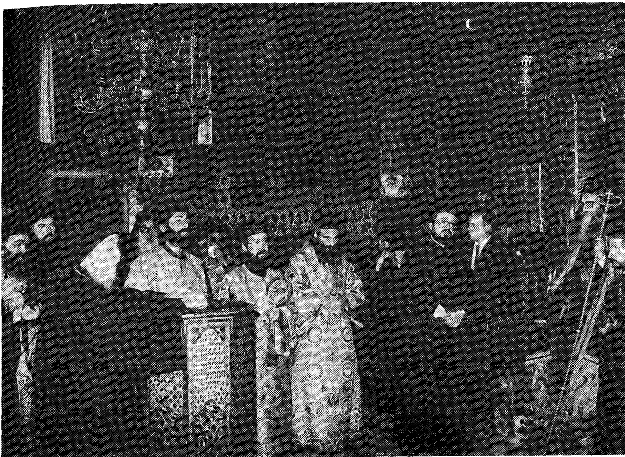
Ἀπὸ τῆ Δοξολογία στὸ Καθολικὸ τῆς Ἱερᾶς Μονῆς Μεγίστης Λαύρας.

ἐνδιαφέροντος τοῦ Θεοῦ. Ὅπου δὲν ὑπάρχουν θλίψεις καὶ δοκιμασίαι, ἐκεῖ ἀπουσιάζει ὁ Θεός. Εἶναι ἀρκετὸν ἡμεῖς καὶ εἰς τὰς θλίψεις νὰ αγωνιζώμεθα καὶ νὰ μένωμεν ἐδραῖοι ἐν τῇ πίστει καὶ τῇ ἐλπίδι τῆς δόξης τοῦ Θεοῦ. Τότε ὄχι μόνον δὲν στενοχωρούμεθα, κατὰ τὸν μέγαν Ἀπόστολον Παῦλον, «ἀλλὰ καὶ κανχόμεθα ἐν ταῖς θλίψεσιν, εἰδότες ὅτι ἡ θλίψις ὑπομονὴν κατεργάζεται, ἡ δὲ ὑπομονὴ δοκιμὴν, ἡ δὲ δοκιμὴ ἐλπίδα, ἡ δὲ ἐλπίς οὐ καταισχύνει» (Ρωμ. 5, 3-4). Ἡ ἀντάρξια, ἡ ἀνταρῆσκια, ἡ κατάρκισις καὶ ὁ ἐγωϊσμός ἀποτελοῦν μέγαν κίνδυνον διὰ τοὺς ἄνευ θλίψεως ζῶντας, ὅπως τοῦτο φαίνεται σαφῶς εἰς τὸ φαρισαϊκὸν ἦθος καὶ ἕφος τῆς παραβολῆς τοῦ Τελώνου καὶ Φαρισαίου. Ἀλλοστε τὸ μόνον πῦρ τὸ ὁποῖον φοβούμεθα οἱ χριστιανοὶ δὲν εἶναι τὸ πρόσκαιρον, ἀλλὰ τὸ αἰώνιον καὶ ἀθεστον πῦρ, τὸ ἠτοιμασμένον τῷ Διαβόλῳ καὶ τοῖς ἀγγέλοις αὐτοῦ (πρὸβλ. Ματθ. 25,42).