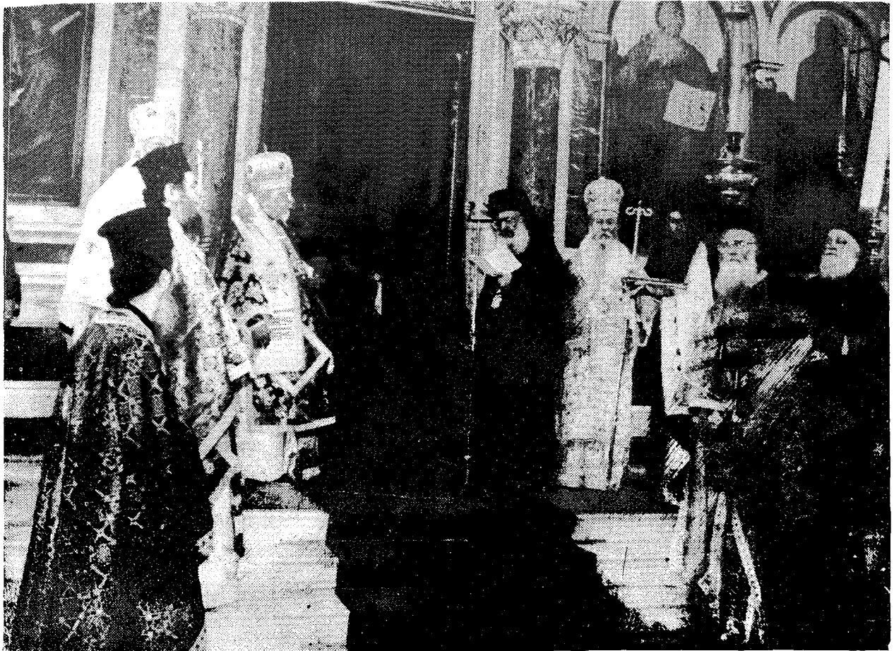
Ὁ Μακ. Ἀρχιεπίσκοπος Ἀθηνῶν καὶ πάσης Ἑλλάδος κ. Σεραφεῖμ, προσφωνεῖ τὸν Σεβ. Ἀρχιεπίσκοπο Καρελίας καὶ πάσης Φιλλανδίας κ. Ἰωάννη κατὰ τὸ Ἀρχιερατικὸ Σουλκεῖτοργεοῦ ποῦ τελέσθηκε στὸν Καθεδρικό Ναό Ἀθηνῶν.

ἡμῶν τῶν Ὀρθοδόξων, οἱ ὁποῖοι παρὰ τὰς ἐξωτερικὰς μας διαφορὰς ὡς πρὸς τὴν ἐθνότητα, τὴν γλῶσσαν καὶ τὰς τοπικὰς συνηθείας καὶ Παραδόσεις, ἀκολουθοῦντες τὸ πρόσταγμα τοῦ Ἀποστόλου τῶν Ἐθνῶν Παύλου, συναποτελοῦμεν τὸ ἀδιαίρετον Σῶμα τῆς Ἐκκλησίας: «Πάντες γὰρ υἱοὶ Θεοῦ ἐστε διὰ τῆς πίστεως ἐν Χριστῷ Ἰησοῦ· ὅσοι γὰρ εἰς Χριστὸν ἐβαπτίσθητε, Χριστὸν ἐνεδύσασθε. Οὐκ ἐν Ἰουδαίῳ οὐδὲ Ἕλληνι, οὐκ ἐν δούλῳ οὐδὲ ἐλεύθερῳ, οὐκ ἐν ἄρσενι ἢ θήλει· πάντες γὰρ ὑμεῖς εἰς ἐστε ἐν Χριστῷ Ἰησοῦ» (Γαλ. 3, 27-28).