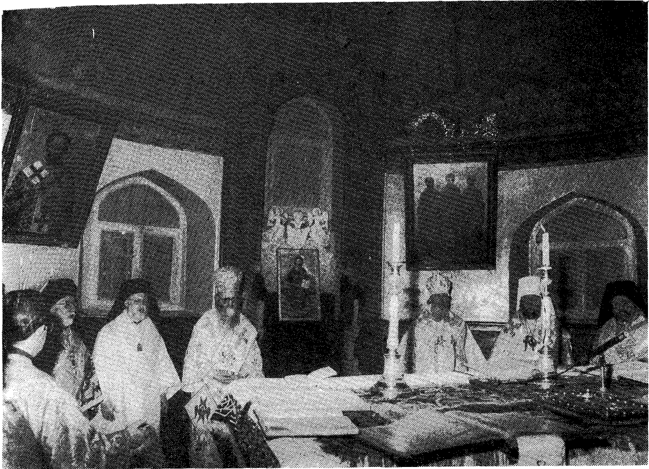
Οἱ δύο Πατριάρχαι μετ' ἄλλους Ἀρχιερεῖς συλλειτουργοῦντες εἰς τὸν πάνσοπον Πατριαρχικὸν Ναόν.

προσοχὴν γίνεται δεκτὴ καὶ ἀκούεται ὑπὸ τῆς κοινῆς γνώμης τῆς χώρας ἡμῶν. Οἱ νέοι κρατικοὶ νόμοι διὰ τὴν ἐλευθερίαν τῆς συνειδήσεως ἐξασφαλίζουν εἰς τὴν Ὁρθόδοξον Ἐκκλησίαν καὶ εἰς τὰς ἄλλας θρησκευτικὰς κοινότητες τὴν πραγματικὴν ἐλευθερίαν καὶ εἰς τοὺς πιστοὺς ὅλων τῶν ὁμολογιῶν πολιτικὴν ἰσότητα, ὅπως καὶ εἰς τοὺς ἀπίστους.