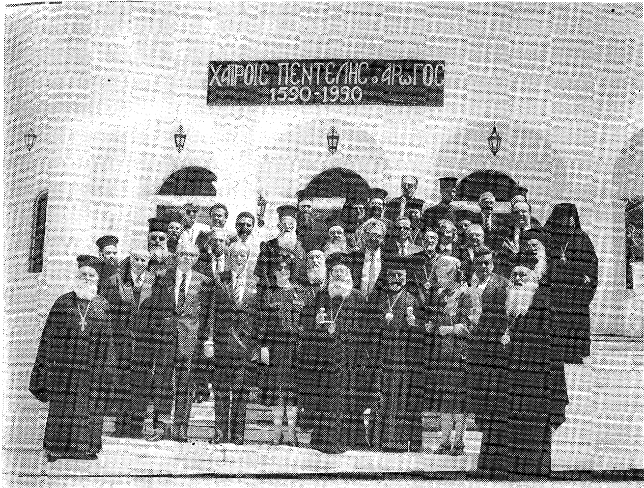
Ἀναμνηστική φωτογραφία τῶν ἐπισήμων πρὸ τοῦ Διορθοδόξου Κέντρου τῆς Ἐκκλησίας τῆς Ἑλλάδος (Πεντέλη).

Ἑμετέρως Μακαριώτατος καὶ εὐχαριστιῶ εὐλικρινῶς καὶ ἐγκαρδίως. Ἦδη ἔδωσε εἰς ἡμᾶς πνευματικὴν ἐνίσχυσιν ἢ διαμονὴν ἐδῶ εἰς μίαν ἀτμόσφαιραν ἀγάπης καὶ ἀδελφότητος. Εἶμαι βέβαιος, διὴ ἐπίσκεψις αὕτη προάγει τὰς ἀδελφικὰς καὶ θεϊκὰς ἐπαφὰς ἡμῶν καὶ ὑποστηρίζει τὴν κοινὴν Ὁρθόδοξον μαρτυρίαν ἡμῶν εἰς τὸν σημερινὸν κόσμον. Ἀκριβῶς τώρα ἔχω εἰς τὴν σκέψιν μου τὸ γεγονός, διὴ κατὰ τὴν παράδοσιν εἰς ὠρισμένους ἀρχαίους πολιτισμούς, ἐν κοινὸν γεῦμα ἦτο δυνατὸν μόνον ἐπὶ τῇ βάσει τῆς ἀμοιβαίας ἐμπιστοσύνης. Τὸ γεῦμα τοῦτο ἔχει τὴν ἐν λόγῳ βάσιν καὶ ἡ ἐπικοινωνία ἡμῶν δίδει νέαν δύναμιν εἰς τὴν ἐμπιστοσύνην, ἢ ὁποία ὄντως ὑπάρχει μετὰ ἡμῶν.