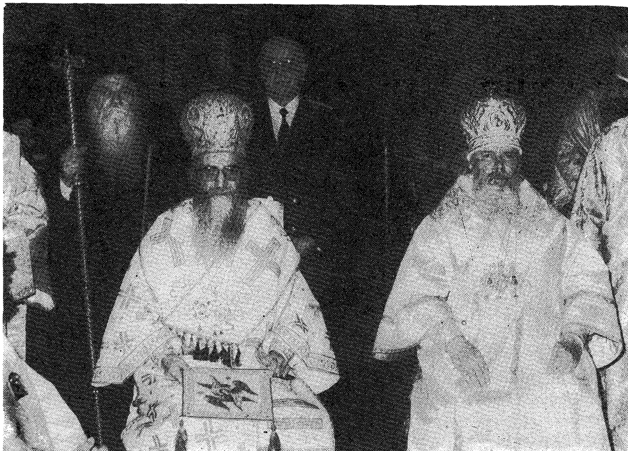
Ἡ Α. Θ. Παναγιότης κ. Δημήτριος Α' με τὴν Α. Μ. τὸν Πατριάρχη Μόσχας κ. Ἀλέξιον Β'.

σιρέφουν τὸν οἶκον αὐτῆς. Ἡ ἱστορία τῆς Ἐκκλησίας τῆς Ρωσσίας καὶ τῆς Μητροῦς Ἐκκλησίας αὐτῆς, ἥτοι τῆς Ἐκκλησίας τῆς Κωνσταντινουπόλεως, εἶναι ὑπερπλήρης ἐκ τῶν δοκιμασιῶν τοῦ Γολγοθᾶ, τὰς ὁποίας δοκιμασίας μνημονοῦμεθα κατὰ τὰς ἡμέρας ταύτας τῆς πανηγύρεως τοῦ Πάσχα, καὶ αἱ ὁποῖαι ἀναφέρονται εἰς τὴν αἰωνίαν ἔχθραν τοῦ σκότους κατὰ τοῦ φωτός. Ταντοχρόνως ὅμως ἡ ἱστορία αὕτη μαρτυρεῖ καὶ τὴν ἀήτητον δύναμιν τοῦ Σταυροῦ, διὰ τῆς ὁποίας ἡ Ἁγία Ὁρθόδοξος Ἐκκλησία, φέρουσα τοὺς ὀρατοὺς τύπους τῶν ἡλῶν, δηλαδή τὴν σφραγίδα τῆς οὐσιανρώσεως αὐτῆς μετὰ τοῦ Χριστοῦ, ὀπωσδήποτε ὑπερνικᾷ τὸ κακὸν διὰ τοῦ καλοῦ καὶ αἰχμαλωτίζει ἐν Χριστῷ τὰς καθαράς καρδίας, αἱ ὁποῖαι ἐπιζητοῦν τὴν δικαιοσύνην τῶν ἀνθρώπων καὶ αἱ ὁποῖαι, ἔχουσαι ἐνώπιον αὐτῶν τὸ σῶμα τῆς Ἐκκλησίας, συμπασχούσης τῷ Ἐπουρανίῳ Νυμφίῳ καὶ συναιστιαμένῃς Αὐτῷ, θὰ ὑπερπηθήσουν τὴν ἀμφιβολίαν καὶ τὴν ἀπιστίαν καὶ θὰ ἔλθουν εἰς ἐπίγνωσιν τῆς ἀληθείας, ἀναφωνοῦσαι ὀλοφύχως μετὰ τοῦ Ἀ-