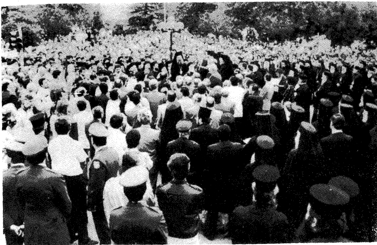
Πραγματική λαοθάλασσα υποδέχεται με τιμή και σεβασμό τὸν Πατριάρχη τοῦ Γένους στὴν κεντρικὴ πλατεία τῶν Τριτάλων. Ἡμέρα ἱστορικὴ γιὰ τὴν πόλη καὶ τὴν περιοχὴ τῆς.

ἀγαποῦν τὴν Ἐκκλησίαν, ἐκκλησιάζονται συχνά, καὶ πολλοὶ ἐκ τῶν νέων σπουδάζουν θεολογίαν, γίνονται κληρικοὶ καὶ μοναχοί. Δὲν ὑπάρχει μεγαλυτέρα εὐλογία διὰ μίαν οἰκογένειαν ἀπὸ τοῦ νὰ ἔχη μεταξὺ τῶν μελῶν τῆς ἓνα κληρικὸν ἢ ἓνα μοναχόν. Ὑπάρχει μεγαλυτέρα τιμὴ ἀπὸ τοῦ νὰ ὑπηρετῇ κανεὶς τὸν Κύριον τῶν κορυφῶν καὶ βασιλέα τῶν βασιλευόντων, τὸν ἄκακον, εὐδύν, ταπεινὸν Ἰησοῦν, ὁ ὁποῖος δὲν ἀποκρύπτει οὔτε διαφρεύει τὰς προσδοκίας τῶν ἀγαπώντων Αὐτόν, ἀλλὰ παρέχει ἀφθονίαν χάριτος καὶ χάριτος, διαρκῶς ἀξαναομένην καὶ οὐδέποτε ἐλαττωμένην;