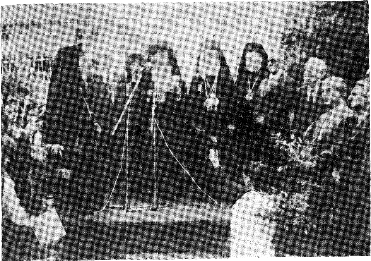
Ἡ Α. Θ. Παναγιώτης ὁ Οἰκουμενικός Πατριάρχης, ἐπὶ τῆς ἐξέδρας, ἀπαντᾷ στὴν προσφώνησιν τοῦ Δημάρχου.

Πόλεως τῶν Τρικάλων, τὴν ἱστορία τῆς ὁποίας λαμπύρει ἢ ἐδῶ παρουσία Σου.