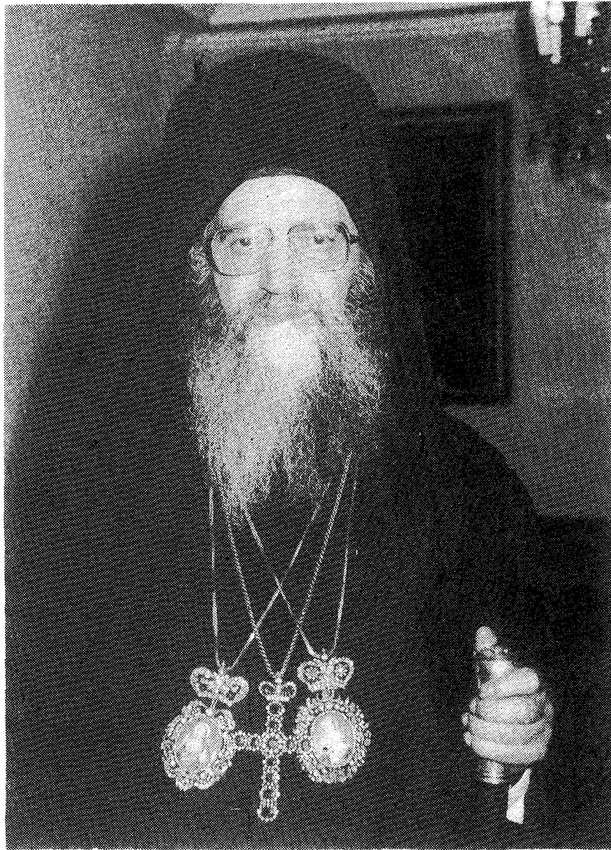
Ο ΟΙΚΟΥΜΕΝΙΚΟΣ ΠΑΤΡΙΑΡΧΗΣ ΔΗΜΗΤΡΙΟΣ Ο Α' († 2 ΟΚΤΩΒΡΙΟΥ 1991)