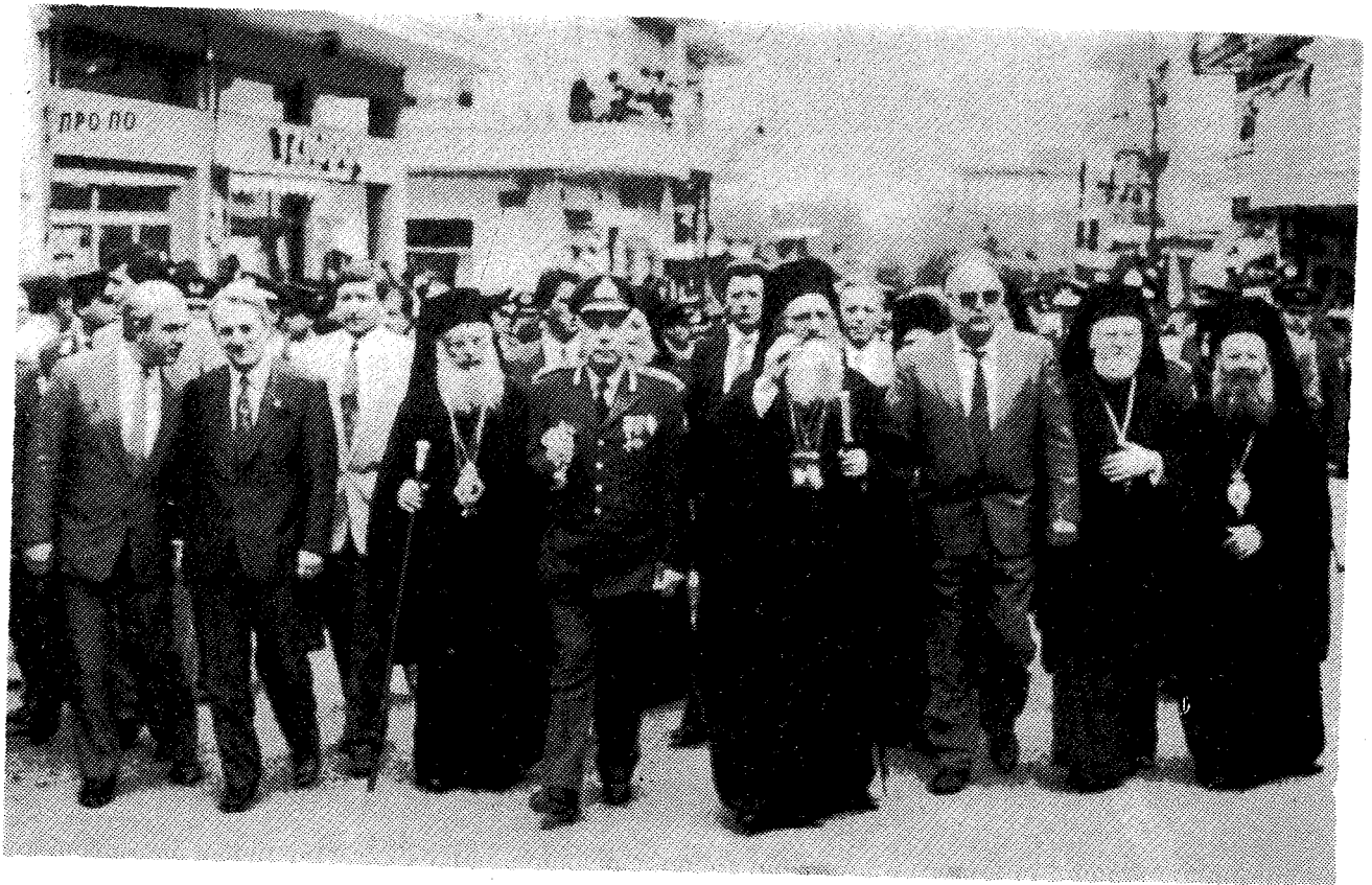
Ἡ Α. Θ. Παναγιώτης ὁ Πατριάρχης Δημήτριος ἐδδεύει πρὸς τὸν ἱερό Μητροπολιτικό Ναὸ Τρικάλων.

σία, ἡ Ὀρθόδοξη Ἐκκλησία, ἰθυνομένη ὑπὸ τοῦ καθ- ηγιασμένου διὰ μακρᾶς σειρᾶς αἰώνων καὶ ἁγίων Πατέρων παραδοσιακοῦ αὐτῆς Κέντρου, τοῦ ἱεροῦ Κέντρου τοῦ Φαναρίου.