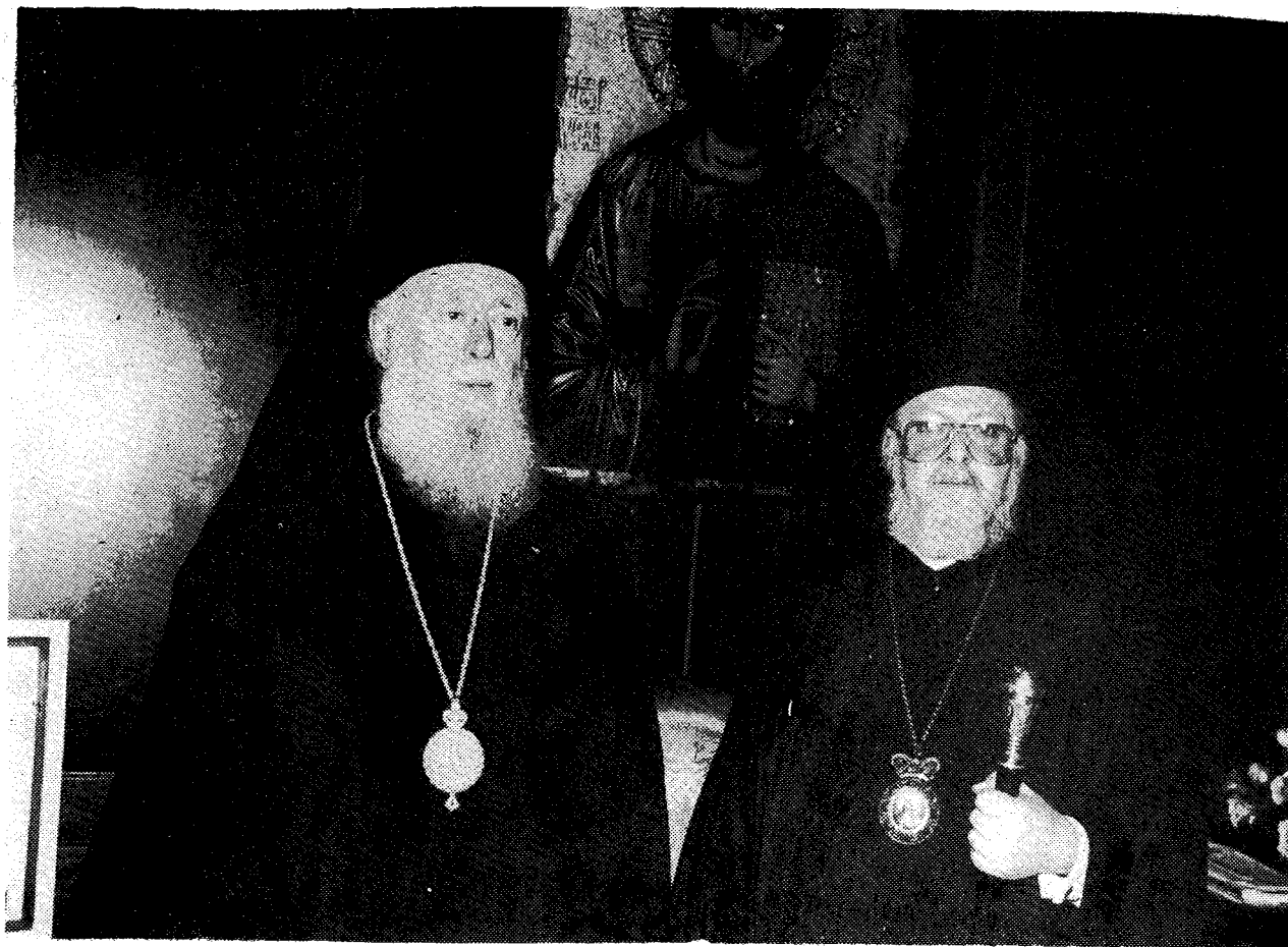
Ο Πατριάρχης κ. Βαρθολομαῖος με τὸν ἐπικεφαλῆς τῆς ἀντιπροσωπείας τῆς Ἐκκλησίας τῆς Ἑλλάδος, Σεβ. Πατρῶν κ. Νικόδημο, Ἄντιπρόεδρο τῆς Διαρκoῦς Ἱερᾶς Συνόδου.

χην Βελιγραδίου κύριον Παῦλον· τὸν μακαριώτατον Πατριάρχην Βουκουρεστίου κύριον Θεόκτιστον· τὸν μακαριώτατον Πατριάρχην Σόφιας κύριον Μάξιμον· τὸν μακαριώτατον Καθολικὸν Πατριάρχην πάσης Γεωργίας κύριον Ἡλίαν· τὸν μακαριώτατον Ἀρχιεπίσκοπον Νέας Ἰουστινιανῆς καὶ πάσης Κύπρου κύριον Χρυσόστομον· τὸν μακαριώτατον Ἀρχιεπίσκοπον Ἀθηνῶν καὶ πάσης Ἑλλάδος κύριον Σεραφεῖμ· τὸν μακαριώτατον Μητροπολίτην Βαρσοβίας κύριον Βασίλειον· τὸν ἐπέχοντα τὴν θέσιν τοῦ ἀγγέλου τῆς Ἐκκλησίας Ἀλβανίας Ἱερωτάτου Μητροπολίτην Ἀνδρούσης κύριον Ἀναστάσιον· τοὺς Ἱερωτάτους Μητροπολίτην Πράγας κύριον Δωρόθεον καὶ Ἀρχιεπίσκοπον Φιλανδίας κύριον Ἰωάννην, ἅπαντας ἀδελφοὺς λίαν ἡμῖν ἀγαπητοὺς καὶ συλλειτουργοὺς περὶ τὸ θυσιαστήριον τῆς Μῆσς καὶ Ἀδιαίρετου Ὁρθοδοξίας. Κατενώπιον αὐτῶν καὶ κατενώπιον ἀπάσης τῆς ὑπ' οὐρανὸν Ἐκκλησίας ἐν παρρησίᾳ καὶ ἀγαλλιάσει πνεύματος ὁμολογοῦμεν τὴν ἀγίαν καὶ ἀμώμητον Ὁρθόδοξον ἡμῶν πίστιν, τὴν ζῶσαν