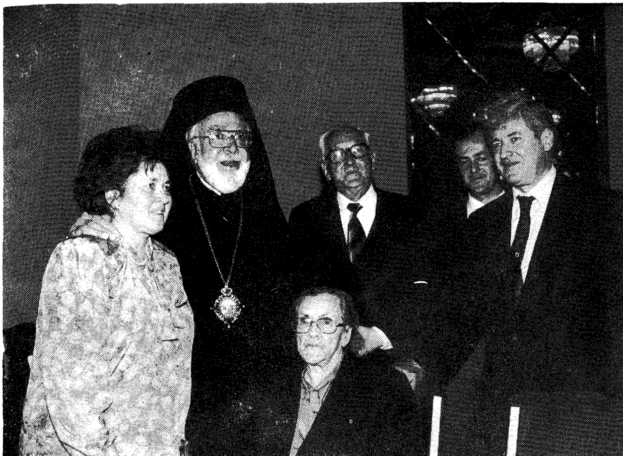
Ὁ Σεβ. Ἀρχιεπίσκοπος Γέρων Ἀμερικής κ. Ἰάκωβος μετὰ τῶν γονέων καὶ συγγενῶν τῆς Α. Θ. Παναγιότητος.

χθηκε Διδάκτωρ ἀπὸ τὸ Ἰνστιτούτο Ἀνατολικῶν Σπουδῶν, ὑπαγόμενο στὸ Ποντιφικὸ Γρηγοριανὸ Πανεπιστήμιο. Διδάκτωρ Ρωμαιοκαθολικοῦ Πανεπιστημίου, σηματοδοτώντας ἔτσι τὶς ἐπελθοῦσες μεταβολές στὴν ἐποχὴ τοῦ Οἰκουμενικοῦ Διαλόγου, ἀλλὰ μὲ θέμα ἀπτόμενο ἐνὸς σημαντικοτάτου προβλήματος γιὰ τὴ ζωὴ καὶ πράξη τῆς Ὀρθοδοξίας. Οἱ σπουδές του συνεχίσθηκαν γιὰ ἓνα ἐξάμηνο στὸ Οἰκουμενικὸ Ἰνστιτούτο τοῦ BOSSEY (Ἑλβετία) καὶ γιὰ τρία ἐξάμηνα στὸ Πανεπιστήμιο τοῦ Μονάχου.