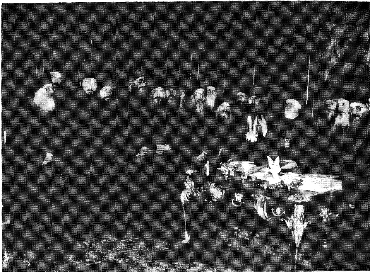
Ἄγιοι ἄρχιεπίσκοποι ἐκπρόσωποι τῶν Ἱερῶν Μονῶν τοῦ Ἁθῶ, γίνονται δεκτοὶ ἀπὸ τὸν Παναγιώτατο στὸ Πατριαρχικὸ Γραφεῖο.

μῶν ἐν τε τῇ Καμπέρρα καὶ ἐν Σαμπεζῷ τῆς Γενεύης.