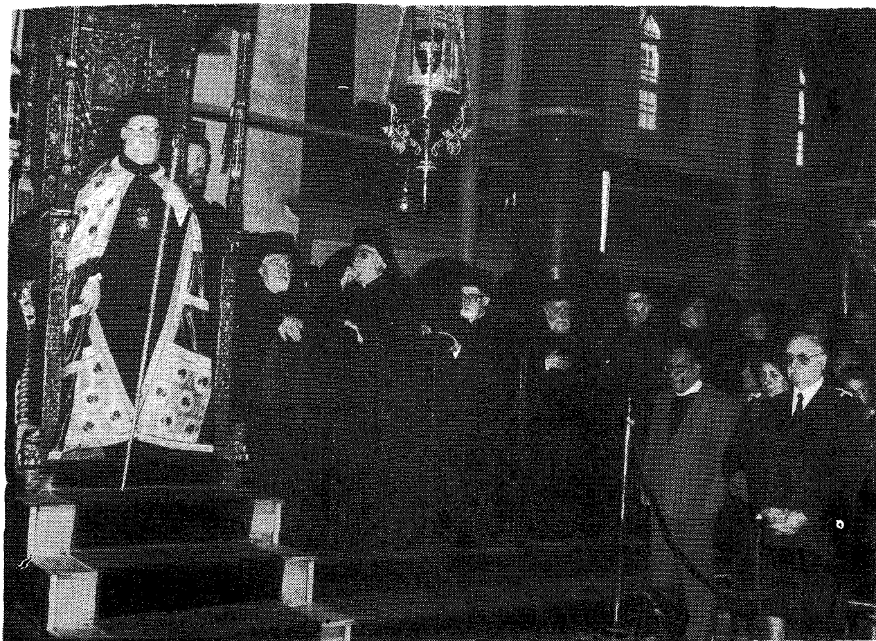
Ἡ Α.Θ.Π. ὁ Οἰκουμενικὸς Πατριάρχης κ. Βαρθολομαῖος, ἐπὶ τοῦ Θρόνου, μετ' Ἀρχιερεῖς καὶ ἄλλους ἐπισήμους.

γου καὶ τῆς σεπτῆς Προσωπικότητός Σου ὑπῆρξε καὶ ἡ εὐλογημένη ἀνάρρησίς Σου εἰς τὸν πάνσεπτον Οἰκουμενικὸν Θρόνον, διὰ τὴν κλείσις τοῦτον μετ' ἡμετέραν Σου διὰ τῆς μαρτυρίας καὶ τοῦ πολλαπλοῦ μαρτυρίου Σου, ὡς ἔπραξαν διὰ τῶν αἰώνων μεγάλοι ἄνδρες τῆς Ἐκκλησίας καὶ τοῦ Γένους, εὐεργετήσαντες ἡμᾶς τοὺς ἐπιγενόμενους, ἀλλὰ καὶ κληρονομίαν βαρυτάτην ἐγκαταλιπόντες.