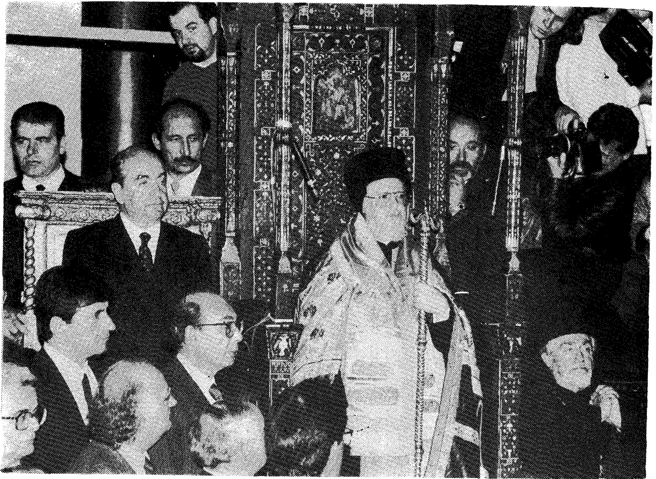
Ή Α. Θ. Παναγιώτης επί τοῦ Θρόνου. Δεξιά Του ὁ Πρωθυπουργός τῆς Ἑλλάδος κ. Κων. Μητσοτάκης.

τὴν ἐπάνοδο τῶν μεγάλων ἱστορικῶν μονῶν τοῦ Ὄρους στοῦ κοινοβιακοῦ σύστημα). Βέβαια κι ὁ Ἀμερικῆς Ἰάκωβος μὲ πολυπληθῆ κολουθία. Τὸν Πρόεδρο τῶν Η. Π.Α. ἐκπροσωπεῖ ὀκταμελῆς ἀντιπροσωπεία μὲ ἐπικεφαλῆς τὸν ἀδελφὸ τοῦ Οὐίλλιαμ Μπούς.