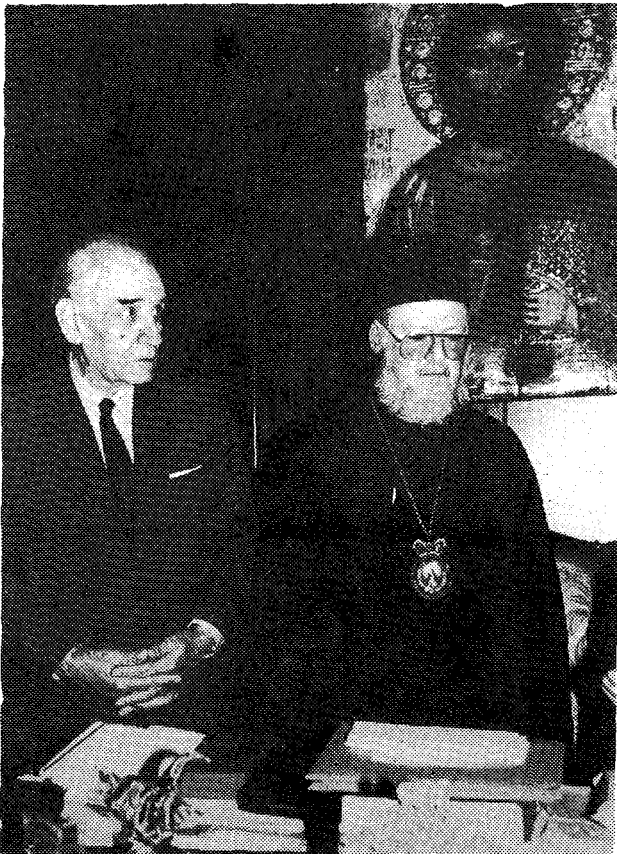
Ο νέος Πατριάρχης με τόν Μετ. Ευεργέτη κ. Παν. Άγγελόπουλο.

άλλα και τών δυνατοτήτων του. Η παρουσία του, έτσι, στο Πατριαρχείο πραγματώνεται τώρα από μιὰ θέση περισσότερο υπεύθυνη και έμφανή.