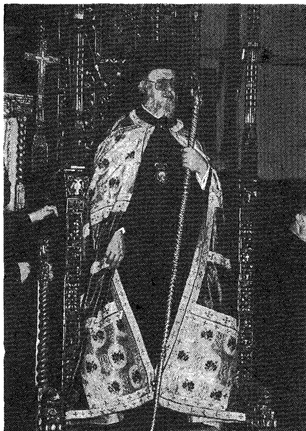
Ἡ Α.Θ.Π. ὁ Οἰκουμενικὸς Πατριάρχης κ. Βαρθολομαῖος Α' ἐπὶ τοῦ Θρόνου.

Ἀφήκαμεν τελευταῖα τὰ ἀφορῶντα εἰς τὸν Πατριαρχικὸν ἡμῶν οἶκον καὶ τὰς ἐν αὐτῷ ὑπηρεσίας.