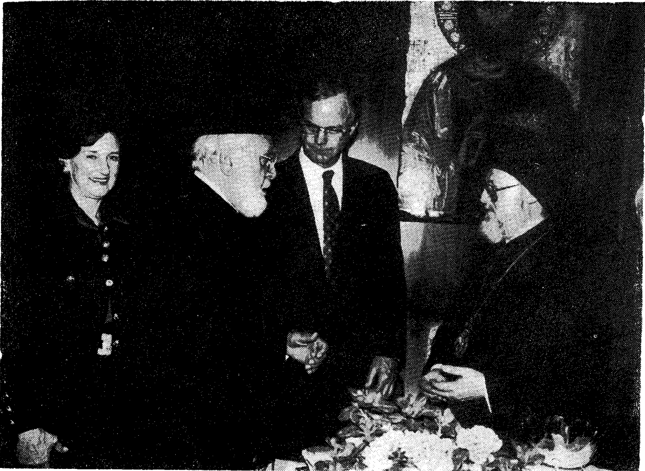
Ἡ Α.Θ. Παναγιότης μετὸν Σεβ. Ἀρχιεπίσκοπο Ἀμερικής κ. Ἰάκωβο καὶ τὸν ἐκπρόσωπο (καὶ ἀδελφὸ) τοῦ Προέδρου τῶν Ἠνωμένων Πολιτειῶν Ἀμερικής.

σουν εἰς τελέσφορον ἐριμνησίαν τῆς Ὁρθοδόξου παραδόσεως εἰς τὴν σύγχρονον ἐποχὴν. Τὸ Οἰκουμενικὸν Πατριαρχεῖον πρέπει νὰ ἀποκτήσῃ τὰ ἰδικά του μέσα καλλιέργειας καὶ προβολῆς τῆς Ὁρθοδόξου Θεολογίας. Ἐντὸς τῶν πλαισίων τούτων θὰ ἐπιδιώξωμεν τὴν ἀπύκνησιν τῆς ἀδείας τῶν ἐφ' ἡμᾶς τεταγμένων κρατικῶν Ἀρχῶν πρὸς ἐπαναλειτουργίαν τῆς περιπέστου Τροφῶν κατὰ Χάλκην Ἱερὰς Θεολογικῆς Σχολῆς, τῆς ἀναγκασθείσης ἵνα ἀναστείλῃ τὴν λειτουργίαν αὐτῆς πρὸ εἰκοσαετίας. Ἀκόμη, ἡ ἔκδοσις ἐπισήμου ἐκκλησιαστικοῦ - θεολογικοῦ περιοδικοῦ τοῦ Πατριαρχείου, ἐκφραστοῦ τῆς θεολογικῆς σκέψεως καὶ τῶν ἀμέσων παραδόσεων αὐτοῦ, θὰ ἀποτελέσῃ μέλημα καὶ φροντίδα τῆς ἡμῶν Μετριοτήτος.