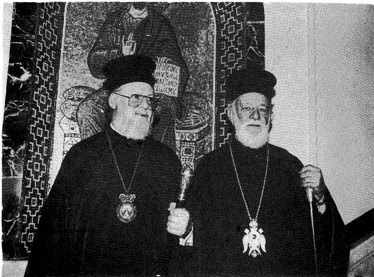
Ἡ Α.Θ.Π. ὁ Οἰκουμενικὸς Πατριάρχης μετὴν Α.Μ. τὸν Πάπα καὶ Πατριάρχῃ Ἀλεξανδρείας κ. Παρθένιο.

σίας των. Ἐφικτὸν μόνον διὰ τοὺς οἰκείους τοῦ αἰωρουμένου, ἀλλὰ καὶ ἀμετακινήτου θρόλου τῆς Μεγάλῃς Ἐκκλησίας. Τὸ κέντρον αὐτὸ τῆς Ὁρθοδοξίας ἀποτελεῖ λειτουργημάτων περίοπτον τῶν αἰώνων. Σταυροπήγιον ἀποστολικόν, ἀρχοντικόν, ἀπαστρέπτρον θεϊότητος. Καὶ ἀκόμα, ἀκροστιχίδα καὶ ὕμνον ἧς Ἐκκλησίας τοῦ Χριστοῦ. Ἱερὸν γέρας τῶν ἀπανταχοῦ ὀρθοδόξων.