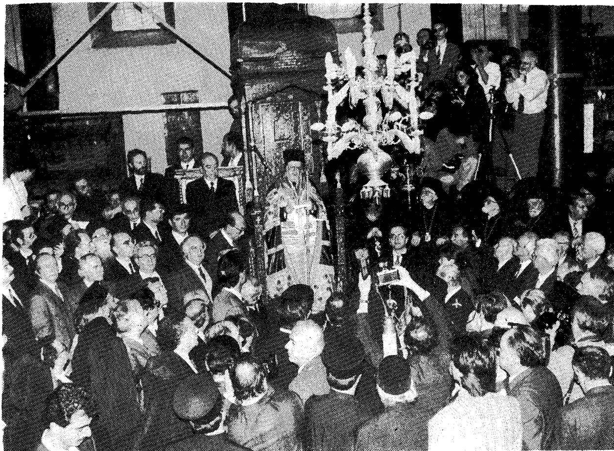
Στιγμιότυπο από τήν τελετή τῆς ἐνθρονίσεως στόν Πατριαρχικό Ναό τοῦ Ἁγίου Γεωργίου.

μερον ἢ παρουσία τῆς Ὁρθοδοξίας εἰς τὰς μυστηριώδεις κυοφορίας τῆς συγχρόνου πολιτισμικῆς ἀλλαγῆς καί ἀνωτερότητος. Εἶναι ἀπαραίτητος σήμερον ὁ Θρόνος αὐτός διὰ τὸν ἐπανευαγγελισμὸν ἐμπερισταίων ἀδελφῶν μας. Διότι αὐτός εἶναι κανονικῶς καὶ ὁ κύριος φορεὺς τῆς καθολικότητος τοῦ ὀρθοδόξου πολιτιστικοῦ ιδεώδους. Αὐτός θὰ ἐξαγγεῖλῃ εἰς τὸν ἐλεύθερον κόσμον τὴν ἀξίαν καὶ τὴν βαρύτητα τῆς ὀρθοδοξίας, ζωοποιῶν τὴν παράδοσίν της.