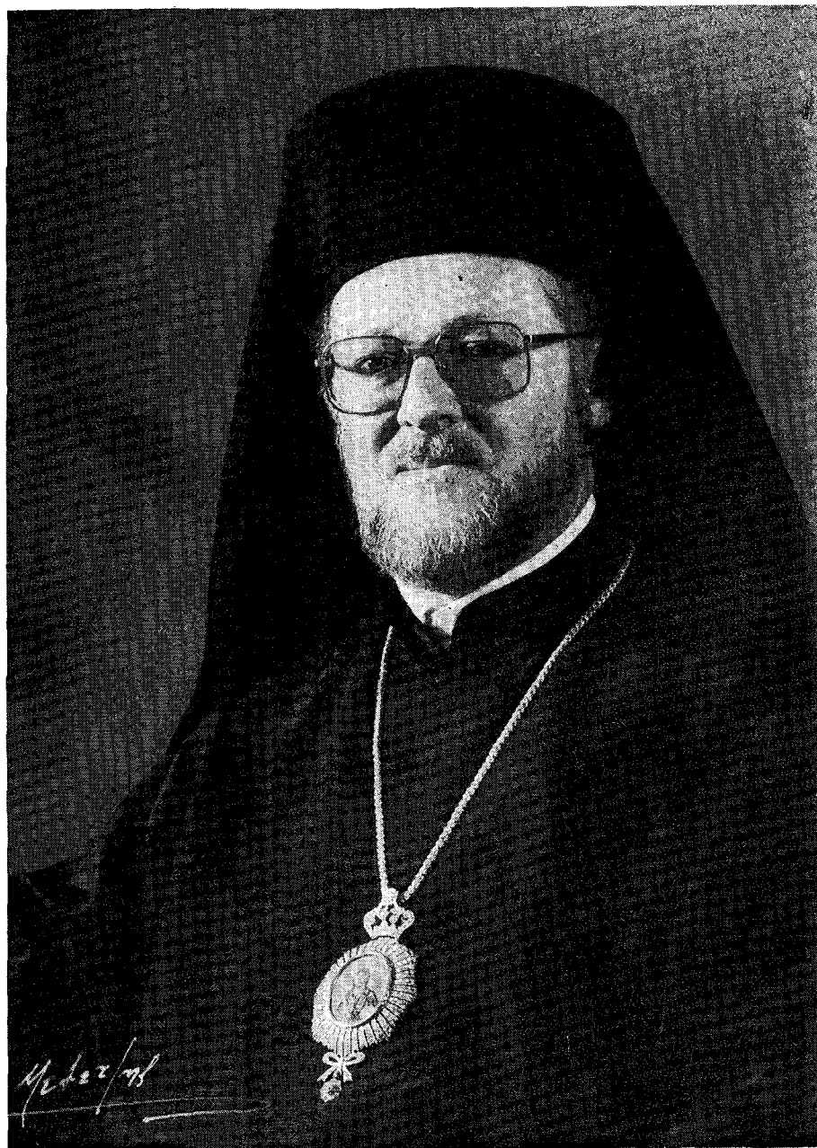
Η Α.Θ.Π. Ο ΝΕΟΣ ΟΙΚΟΥΜΕΝΙΚΟΣ ΠΑΤΡΙΑΡΧΗΣ κ.κ. ΒΑΡΘΟΛΟΜΑΙΟΣ Ο Α'