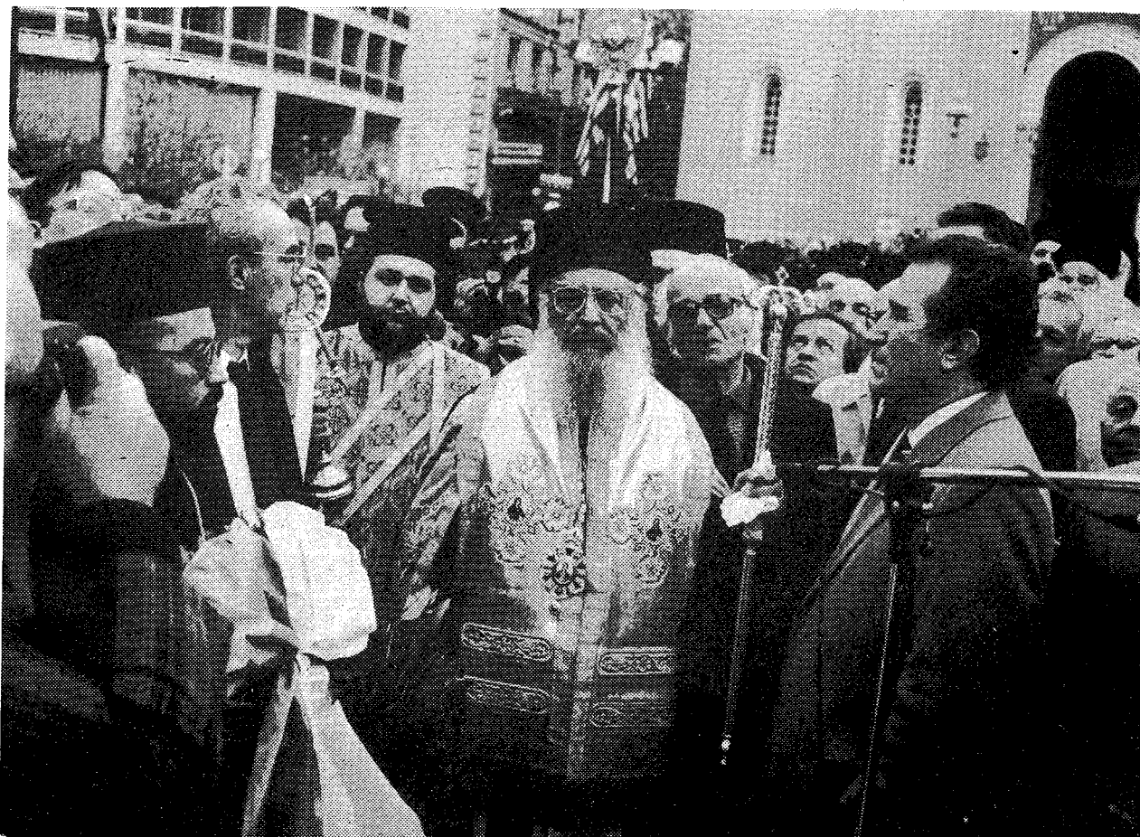
Ὁ Μακ. Ἀρχιεπίσκοπος Ἀθηνῶν καὶ πάσης Ἑλλάδος κ. Σεραφεῖμ, ἐν μέσῳ ἐπισήμων καὶ λαοῦ, κατὰ τὴν τελετὴ τῶν ἀποκαλυπτηρίων τοῦ ἀνδριάντος.

ἐτῶν: Λόγω ὅμως τῶν τότε περιστάσεων καὶ κατόπιν τῶν ἀτυχῶν παρεμβάσεων τῆς Πολιτείας καὶ δι' ἀποφάσεως τοῦ Συμβουλίου τῆς Ἐπικρατείας, τότε, κατὰ παραβίασιν τοῦ Εὐαγγελικοῦ Νόμου καὶ τῶν Ἱερῶν Κανόνων τῆς Ἐκκλησίας, — παρεμβάσεων αἱ ὁποῖαι κατ' ἐπανάληψιν καὶ δυστυχῶς ἕως τῆς σήμερον γίνονται αἰτία διασαλεύσεως τῶν ἀρμονικῶν σχέσεων Ἐκκλησίας καὶ Πολιτείας καὶ αἱ ὁποῖαι εἶναι πλέον καιρὸς νὰ παύσων, — ὁ νεοεκλεγείς Ἀρχιεπίσκοπος Δαμασκηνὸς ἐξεθρονίσθη καὶ παρέμεινε ἐγκλειστος εἰς τὴν Ἱερὰν Μοῆν Φανερωμένης Σαλαμίνας μέχρι τῆς 6ης Ἰουλίου 1941, ὅτε καὶ συνετελέσθη δι' ἄλλης ἀποφάσεως τῆς Ἱεραρχίας τῆς Ἐκκλησίας τῆς Ἑλλάδος ἢ εἰς τὸν Ἀρχιεπισκοπικὸν Θρόνον ἀποκατάστασις Αὐτοῦ.