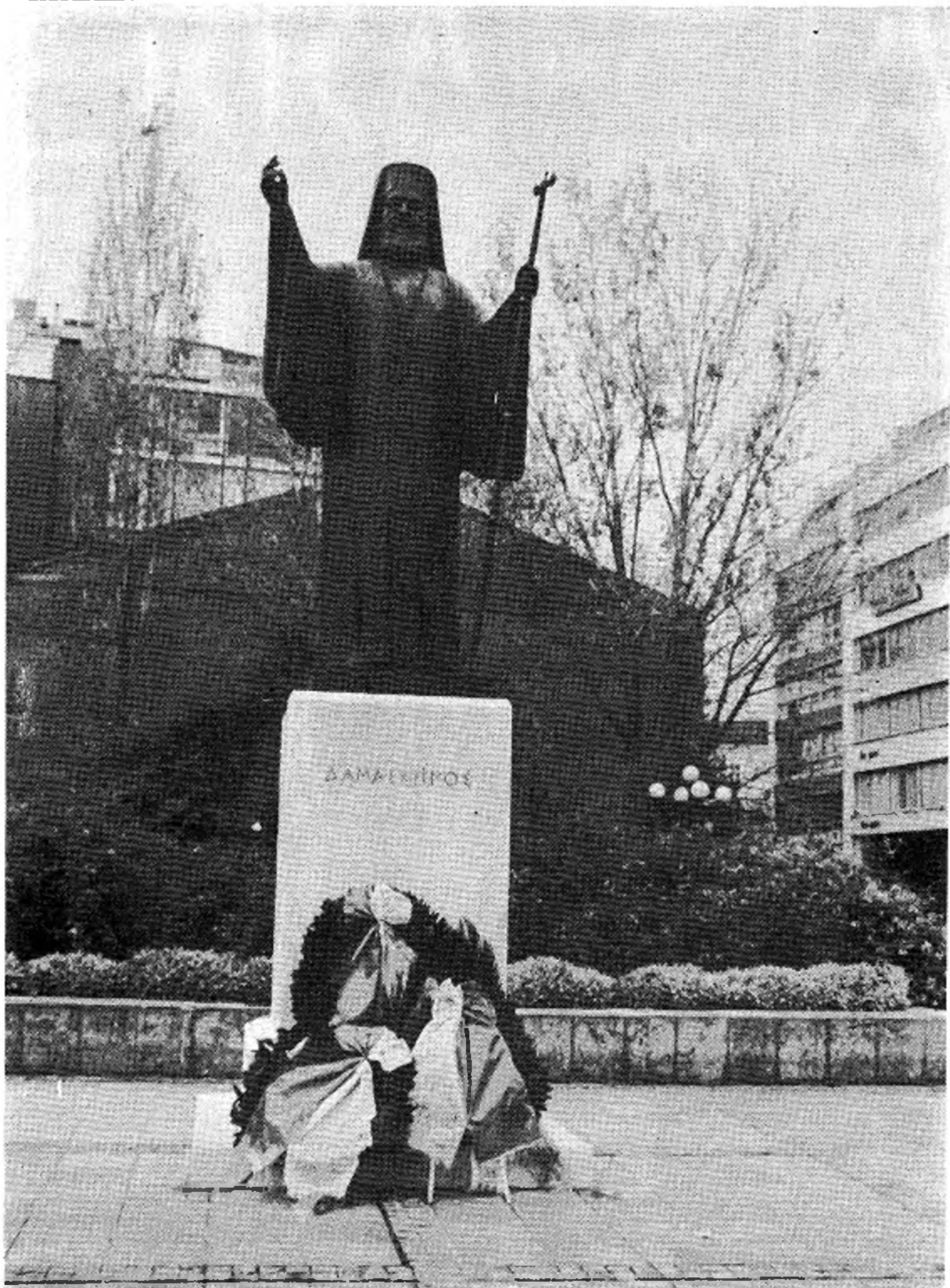
Ο μαγαλοπρεπής ανδριάντας τῶν Ἀρχιεπισκόπων, Ἀντιβασιλέων καὶ Πρωθυπουργῶν Δαμασκίνου.