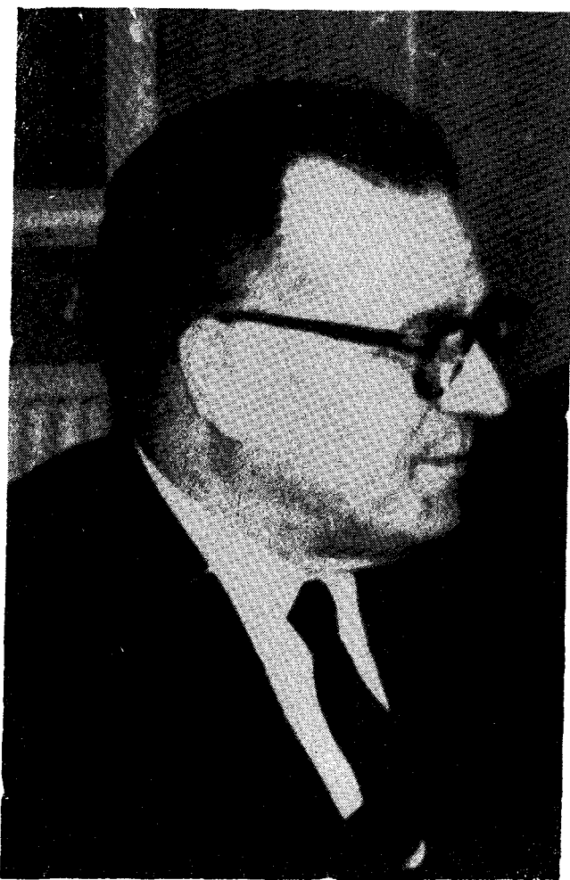
Ὁ ἀείμνηστος Καθηγητὴς Ἰωάννης Καρμίρης.

εἰς ἐπιστήμονα διεθνοῦς κύρους μετ' ἐντόνου προβολῆς. Ἀπὸ πολλῶν δὲ θέσεων τὰς ὁποίας ἐπαξίως κατεῖχες, συνέβαλες, ἐν τῷ ἐνδεικνυμένῳ μέτρῳ, εἰς τὴν συνεργασίαν τῆς ὀρθοδόξου Ἐκκλησίας μετὰ τῶν λοιπῶν Ἐκκλησιῶν, κατὰ τὰς ἐκδηλώσεις τῆς καλουμένης οἰκουμενικῆς κινήσεως.