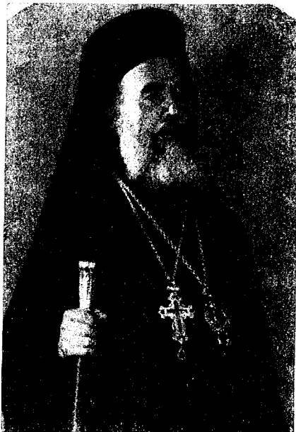
Ὁ Σύρου Φιλάρετος (†).

Ἀνθρωπίνη δύναμις δέν μοι φαίνεται ὅτι ἦτο ποτὲ ἱκανὴ νὰ μὲ ἀποσπᾶσῃ ἐκ τῶν κόλπων τόσο πολυπληθοῦς ποιμνίου, ἐν ξένη μάλιστα διαβιῶντος, ἀπόλυτον ἔχοντος ἀνάγκη διηγεκοῦς καὶ ἀγρύπνου ποιμαντορίας, ποιμνίου ἀνησυχούντος διὰ τὸ παρὸν αὐτοῦ καὶ εὐλόγως τρέμοντος πρὸ τοῦ ἀδήλου μέλλοντος τῆς τύχης τῶν τέκνων του, ποιμνίου μετὰ τοῦ ὁποίου τόσο στενῶς εἶχον συνδεθῆ, ὑπὲρ τῆς πνευματικῆς ζωῆς καὶ φυλετικῆς ὑποστάσεως τοῦ ὁποίου εἰς τόσους ὑπεβλήθη ἀγῶνας, τόσας κατέβαλον προσπάθειας καὶ τόσα ἔχουσα δάκρυα νυχθημερὸν ὑπὲρ αὐτοῦ ἐργαζόμενος, καὶ πρὸς Κύριον προσευχόμενος, πρὸς μυριάς ἐπὶ ἔτη παλαιάς δυσκολίας, δυσυπερβλήτους πολλάκις λόγῳ τῆς φύσεως αὐτῶν.