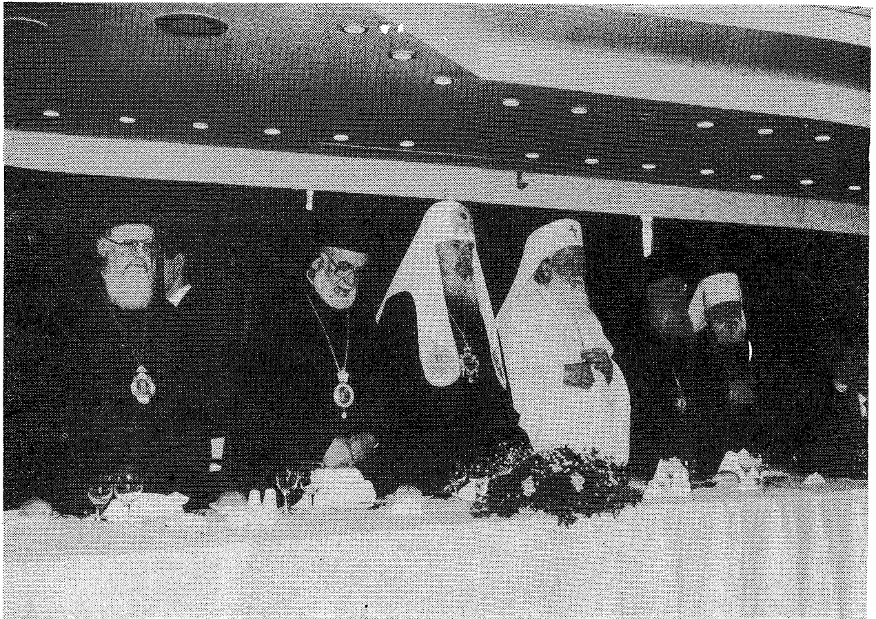
Ἡ Α.Θ.Π. ὁ Οἰκουμενικὸς Πατριάρχης κ. Βαρθολομαῖος (ἀριστερά), με' ὠρισμένους ἀπὸ τοὺς Μακαριωτάτους Ἀρχηγούς Ὁρθόδοξων Ἐκκλησιῶν, κατὰ τὸ ἐπίσημο γεῦμα.

Ὁρθόδοξοι εἰς αὐτὴν εἰς τὸ μέλλον. Δὲν πρέπει νὰ λησμονῆται ὅτι αἱ χώραι τῆς Νοτίου καὶ Ἀνατολικῆς Ἑυρώπης κατοικοῦνται ἐν πλειονότητι ὑπὸ Ὁρθόδοξων λαῶν, συμβαλόντων ἀποφασιστικῶς εἰς τὴν πολιτιστικὴν διαμόρφωσιν τοῦ Ἑυρωπαϊκοῦ πολιτισμοῦ καὶ πνεύματος. Τὸ γεγονός τοῦτο καθιστᾷ τὴν Ἐκκλησίαν ἡμῶν σημαντικὸν παράγοντα εἰς τὴν διαμόρφωσιν τῆς Ἠνωμένης Ἑυρώπης καὶ αὐξάνει τὰς εὐθύναις αὐτῆς.