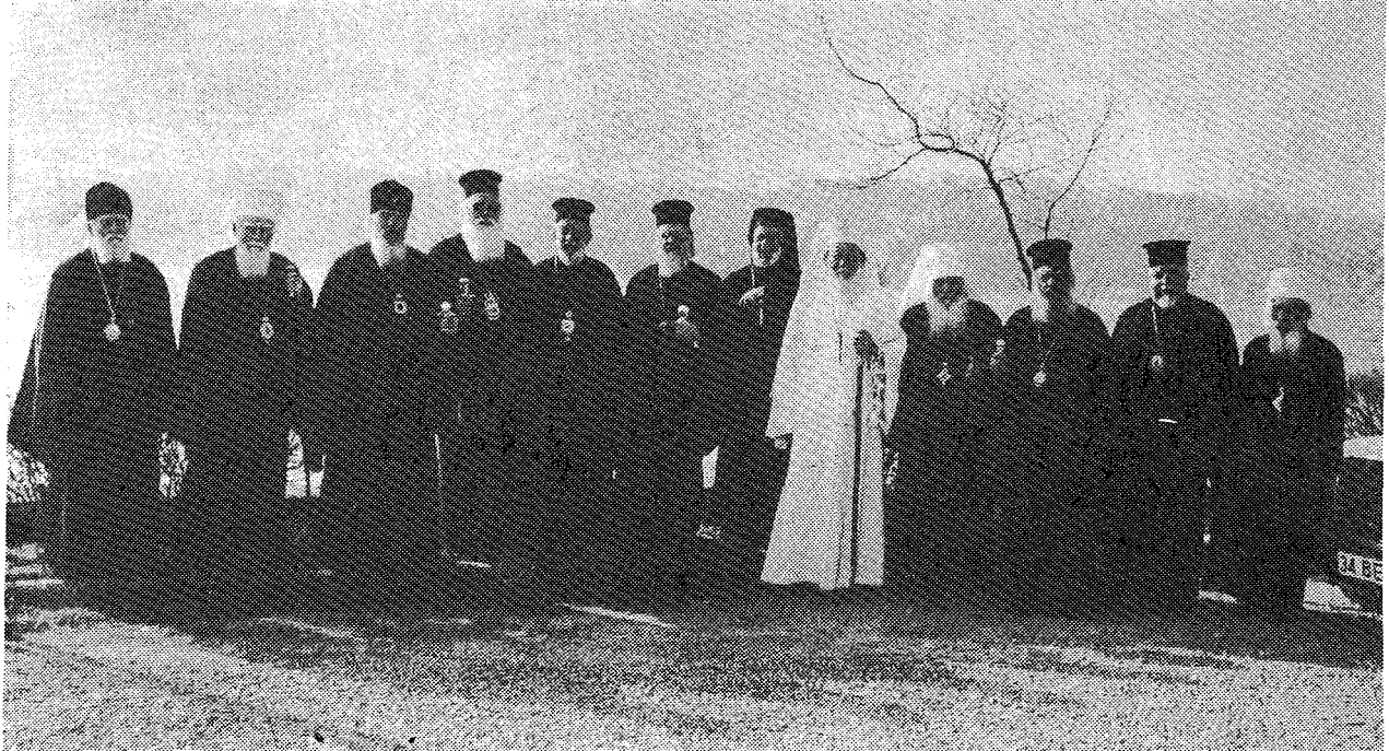
*Αναμνηστική φωτογραφία τῶν Προκαθημένων τῶν Ἀγιωτάτων Ὁρθόδοξων Ἐκκλησιῶν.

3. Πάντα ταῦτα καλοῦν τοὺς Ὁρθόδοξους εἰς βαθύτεραν πνευματικὴν, ἀλλὰ καὶ κανονικὴν ἐνότητα. Ἐπιτυχῶς ἢ ἐνότις αὕτη ἀπειλεῖται πολλάκις ὑπὸ ὁμᾶδων σχισματικῶν, αἵτινες ὑφίστανται ἐκ παραλλήλου πρὸς τὴν κανονικὴν δομὴν τῆς Ὁρθόδοξης Ἐκκλησίας. Συσκεφθέντες καὶ περὶ τοῦτου διεπιστώσαμεν τὴν ἀνάγκην, ὅπως ἅπασαι αἱ κατὰ τόπους Ἀγιώταται Ὁρθόδοξοι Ἐκκλησίαι, τιθέμεναι πλήρως ἀλληλέγγυοι, καταδικάσωσι τὰς τοιαύτας σχισματικὰς ομάδας καὶ ἀπέχῃσι πάσης κοινωνίας μετὰ τούτων, ὅπουδήποτε καὶ ἂν εὐρίσκωνται αὗται, «ἕως οὗ ἐπιστραφῶσιν», ἵνα μὴ τὸ σῶμα τῆς Ὁρθόδοξης Ἐκκλησίας ἐμφανίζηται ἐν τῷ θέματι τούτῳ διηρημένον, καθότι «οὐδὲ μαρτυρίου αἷμα δύναται ἐξαιλεῖν τὴν ἁμαρτίαν τοῦ σχίσματος» καὶ «τοῦ εἰς αἵρεσιν ἐμπεσεῖν τὸ τὴν Ἐκκλησίαν σχίσαι οὐκ ἔλαιτόν ἐστι κακόν» («Ἅγιος Ἰωάννης ὁ Χρυσόστομος).