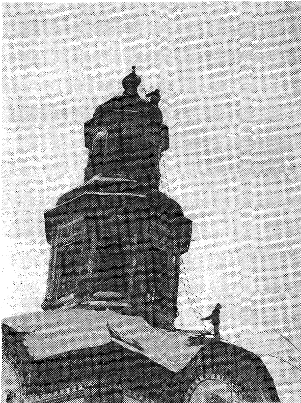
Ένας δόλοκληρος ναός ανεβαίνει σκαλι - σκαλί, με την απόφαση να υψώσει ξανά το Σταυρό στους απέραντους ορίζοντες της ρωσικής γής...

νονταν οι εργασίες της Συνέλευσης 3 , και οι δύο κοπέλες ανήκαν στο βοηθητικό και μεταφραστικό προσωπικό του πλοίου. Η παρουσία τόσο νέων, ή αδελφική και νεανική ατμόσφαιρα, οι συζητήσεις και οι κοινές προσευχές πάνω στο πλοίο έκαναν βαθύτατη έντυπωση στις τρεις αυτές νεανικές υπάρξεις. Και το αποτέλεσμα της πνευματικής αυτής διεργασίας ήταν άμεσο: με ένα απλό και αυθόρμητο τρόπο ζή-