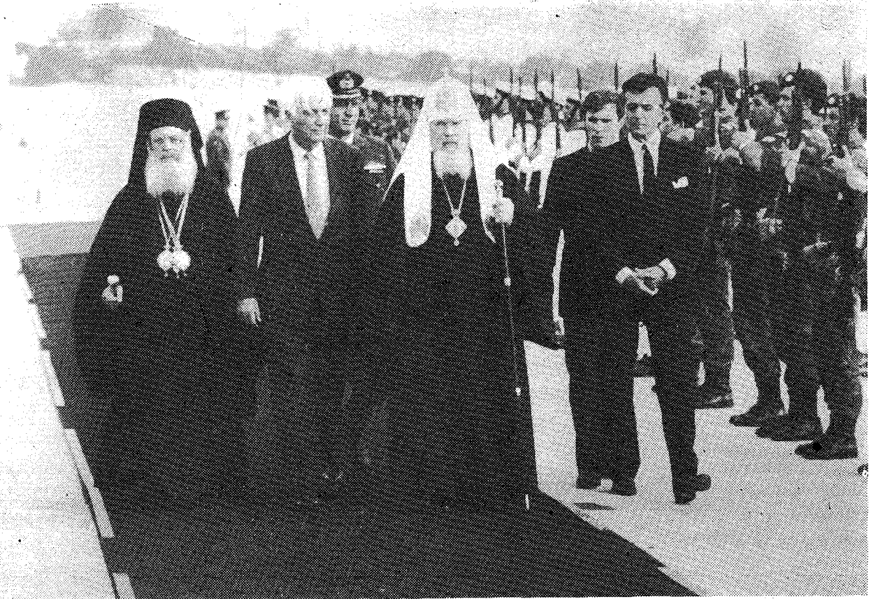
Ο Μακ. Πατριάρχης Μόσχας κ. Ἀλέξιος ἐπιθεωρεῖ τὸ παρατεταγμένο στρατιωτικὸ ἄγημα ἐκ 3 ὄπλων ἀμέσως μετὰ τὴν ἀφιξή του στὸ ἀεροδρόμιο τοῦ Ἑλληνικοῦ συνοδευόμενος ἀπὸ τὸν Μακ. Ἀρχιεπίσκοπο Ἀθηνῶν καὶ πάσης Ἑλλάδος κ. Σεραφεῖμ καὶ τὸν Ἀντιπρόεδρο τῆς Ἑλληνικῆς Κυβερνήσεως κ. Τζωννὴ Τζωννατάκη.

ὥς συνέβη εἰς τὸ Ὑπερῶν τῆς Ἁγίας Σιών, τῆς ἐπιγείου Ἱερουσαλήμ.