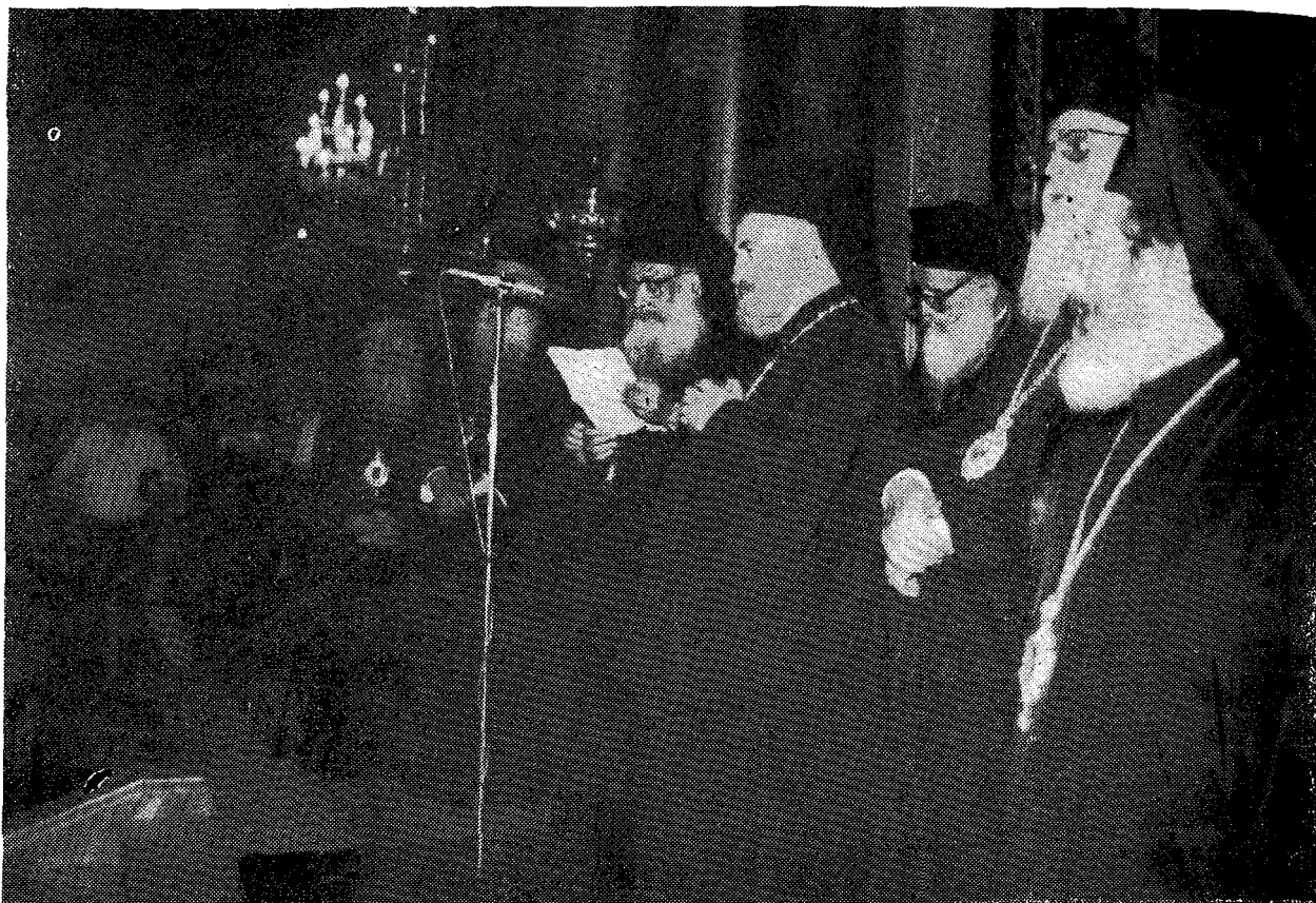
Ο Μακ. Ἀρχιεπίσκοπος κ. Σεραφείμ περιβαλλόμενος ἀπὸ τὰ μέλη τῆς Διεκκοῦς Ἱερᾶς Συνόδου προσφωνεῖ τὸν Μακ. Πατριάρχη κ. Ἀλέξιο κατὰ τὴ Δοξολογία, πού ἐψάλη γιὰ τὴν ἀφιξή του στὸν Καθεδρικό Ναὸ Ἀθηνῶν.

τασιεῖ ὄργανον ἀνιορθόδοξων καὶ ἀντιχριστιανικῶν δυνάμεων κατὰ τοῦ Ὁρθοδόξου Χριστιανικοῦ χώρου τῶν Βαλκανίων. Πρόκειται δὲ περὶ τῶν ἰδίων δυνάμεων, αἱ ὁποῖαι τὸν ὀδήγησαν εἰς τὸ Σχίσμα μετὰ τῆς Ὁρθοδόξου Ἐκκλησίας τῆς Σερβίας καὶ σήμερον προετοιμάζουν τὴν ἄλωσίν του.