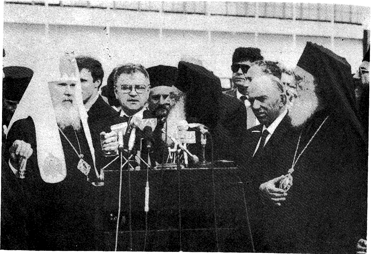
Ο Μακ. Ἀρχιεπίσκοπος κ. Σεραφείμ καλωσορίζει τὸν Μακ. Πατριάρχη κ. Ἀλέξιο στὸ ἀεροδρόμιο τοῦ Ἑλληνικοῦ.

πρὸς τὰς δυνάμεις τοῦ σκότους τοῦ κόσμου τούτου.