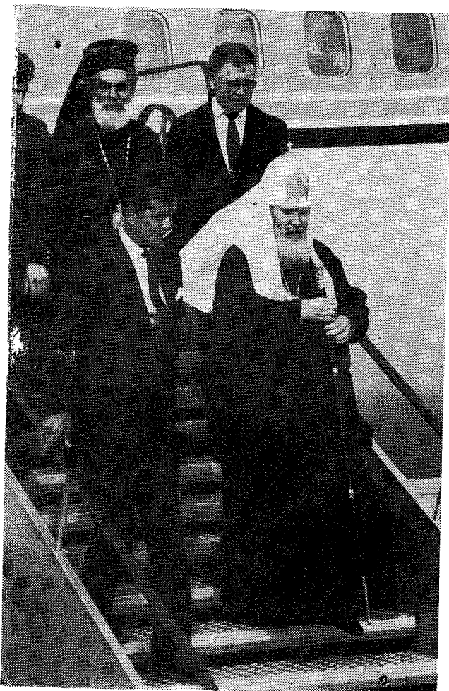
Ὁ Μακ. Πατριάρχης Μόσχας Ἀλέξιος κατέρχεται τῆς κλίμακος τοῦ ἀεροσκάφους πού τὸν ἔφερε στήν Ἀθήνα, συνοδευόμενος ἀπὸ τὸν Σεβ. Μητροπολίτη Νέας Σμύρνης κ. Ἀγαθάγγελο καί τὸν ἐπὶ τῆς Ἐθνοτυπίας Πρέσβη τοῦ Ὑπουργείου Ἐξωτερικῶν.

Καί' ἐξαίρεσιν σήμερον, ἐν πλήρει ἀγαλλιάσει ὄχι μόνον ἡ ἡμῶν Μειριότης, ἀλλά καί οἱ λοιποὶ Σεβασμιώτατοι Ἀδελφοί, Ἱεράρχαι τῆς ἐν Ἑλλάδι Ὁρθόδοξου τοῦ Χριστοῦ Ἐκκλησίας, αἰσθανόμεθα θαδεΐαν τήν πρὸς τὸν Δομήτορα τῆς Ἐκκλησίας Χριστὸν εὐγνωμοσύνην, διότι καταξιώνει ἡμᾶς νὰ Σᾶς ὑποδεχόμεθα σήμερον, κατὰ τήν πρώτην ταύτην ἐπίσημον ἐπίσκεψιν τῆς Ὑμετέρας Μακαριότητος εἰς Ἑλλάδα, ἀπὸ τῆς ἀναδείξεως Αὐτῆς εἰς τὸν Πατριάρχ-