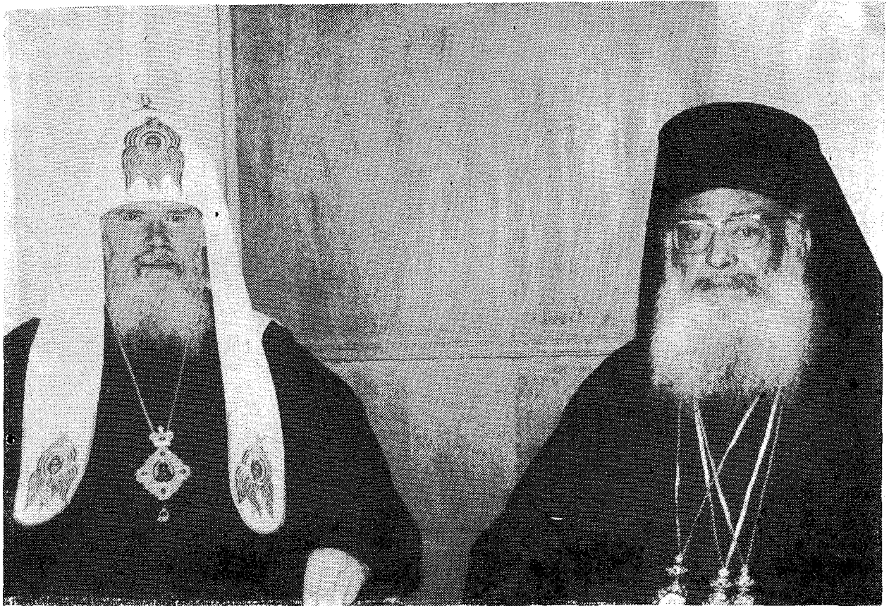
Ο Μακ. Πατριάρχης Μόσχας κ. Ἀλέξιος με τὸν Μακ. Ἀρχιεπίσκοπο κ. Σεραφεῖμ στὴν Ἀρχιεπισκοπὴ Ἀθηνῶν, ὅπου παρατέθηκε δεξίωση πρὸς τιμὴν τοῦ Προκαθημένου τῆς Ῥωσικῆς Ἐκκλησίας.

Μητροπολίτης Λαδώνης κ. Χρυσόστομος, ἡ Ὑφυπουργὸς Ἐξωτερικῶν κ. Βιργινία Τσουδεροῦ, ὁ Γεν. Γραμματεὺς Θρησκευμάτων κ. Γ. Παπακωνσταντίνου, ὁ Πρόεδρος τῆς Δημοκρατικῆς Ἀνανέωσης κ. Κωστῆς Στεφανόπουλος κ.π.ἄ.