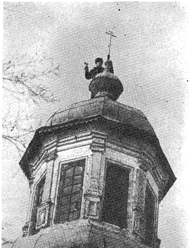
«Η νίκη και ο θρίαμβος του Σταυρού, ύστερα από 75 χρόνια μαρτυρικών διωγμών!» (Από την αναστήλωση και επισκευή του ναού της Αγίας Τριάδος, στην περιοχή Κύρωφ - Βιάτκα).

ται κυρίως από χώμα και το έδαφος της δεύτερης είναι όλο πέτρα. Είναι όμως όμοιες, διότι και στις δύο αυτές Χώρες ριζώσε και αναπτύχθηκε το δένδρο της Ορθοδοξίας. Το δένδρο αυτό διατηρήθηκε επί αιώνες, διότι οι πατέρες μας το προστάτευσαν με πολλή αγάπη και το πότισαν με το τίμιο αίμα τους. Οί σύγχρονες γενεές, τόσο στη Ρωσία όσο και στην Ελλάδα