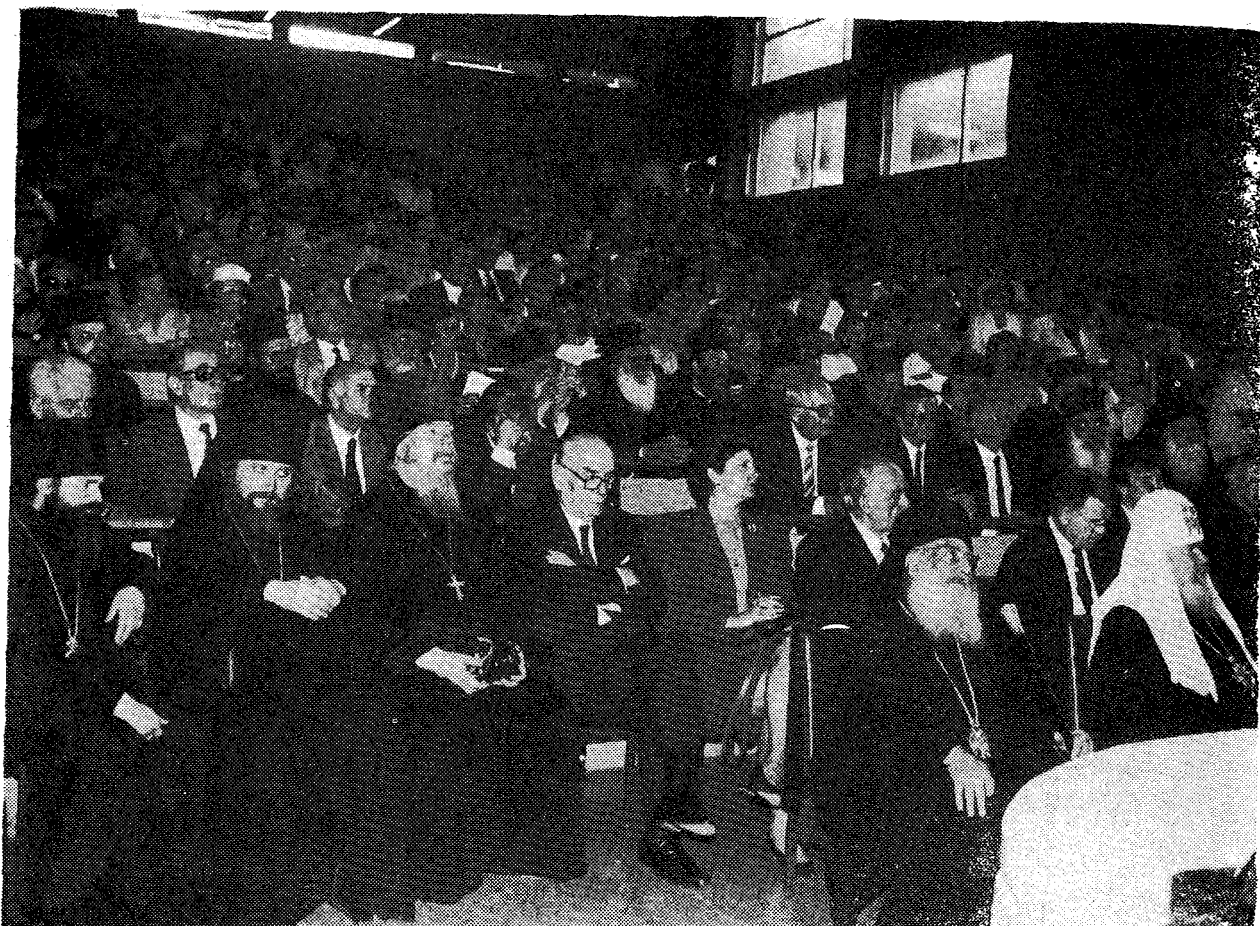
Τὸ κατάμεστο ἀμφιθέατρο τῆς Θεολογικῆς Σχολῆς τοῦ Πανεπιστημίου Ἀθηνῶν κατὰ τὴν τελετὴ ἀναγορεύσεως τοῦ Μακ. Πατριάρχου Μόσχας κ. Ἀλεξίου σὲ Ἐπίτιμο Διδάκτορα τοῦ Ποιμαντικῆς Τμηματὸς τῆς Θεολογικῆς Σχολῆς τοῦ Πανεπιστημίου Ἀθηνῶν. Στὴν πρώτη σειρὰ ὁ Πατριάρχης Ἀλέξιος μὲ τὸν Μακ. Ἀρχιεπίσκοπο κ. Σεραφεῖμ.

τήθενο τοῦ Ἐπιτίμου Διδάκτορα, ἐξεφώνησε τὸν κάτωθι μεστὸ θεολογικοῦ περιεχομένου λόγον: