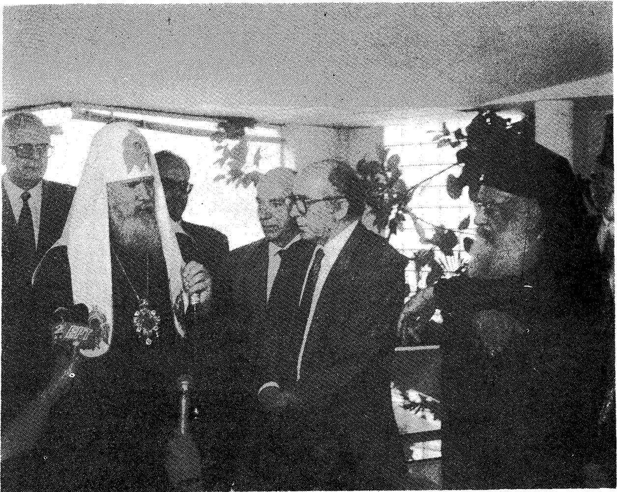
Ἀπὸ τὴν ἐπίσκεψιν τοῦ Μακ. Πατριάρχου Μόσχας κ. Ἀλεξίου στὸν Ὑπουργὸ Ἐθν. Παιδείας καὶ Θρησκευμάτων κ. Γ. Σουφλιᾶ. Διακρίνονται πλὴν τοῦ Ὑπουργοῦ ὁ Μακ. Ἀρχιεπίσκοπος κ. Σεραφεὶμ καὶ ὁ Γεν. Γραμματεὺς Θρησκευμάτων κ. Γ. Παπακωνσταντίνου.

επιστηματικῆς θέσεως καθιστοῦν τὴν Ὁρθόδοξον Θεολογίαν «Τεχνολογίαν (μὲ τὴν πρωτογενῆ σημασίαν τοῦ ὄρου) αἰχμῆς». Καὶ αὐτό, νομίζομεν, διηγεῖται καὶ παρὰ τῶν ἡμετέρων πολιτικῶν ἀρχόντων