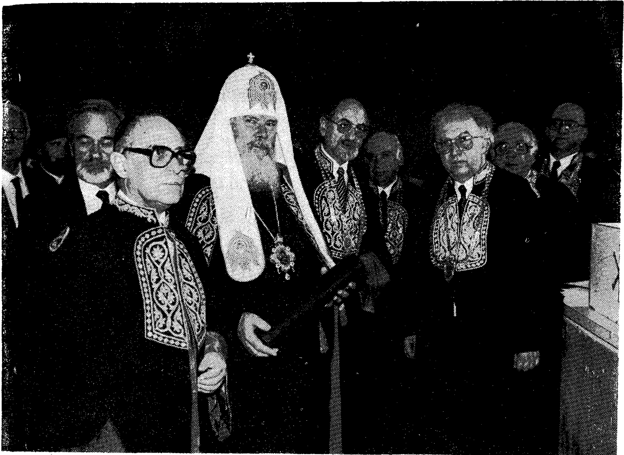
Ὁ Μακ. Πατριάρχης Μόσχας κ. Ἀλέξιος μετὰ τὴν ἀναγόρευσίν του ὡς Ἐπίτιμου Διδάκτορα τῆς Θεολογικῆς Σχολῆς τοῦ Πανεπιστημίου Ἀθηνῶν (Ποιμαντικὸ Τμήμα). Τὸν περιβάλλουν ὁ Πρύτανης κ. Γέμτος, ὁ Κοσμητὼρ κ. Οἰκονόμου, ὁ πρόεδρος τοῦ Τμήματος κ. Βουλγαράκης.

ἡμέρᾳ ἢ ἀναγόρευσις γένηται, καθ' ἃ γενόμεσται.