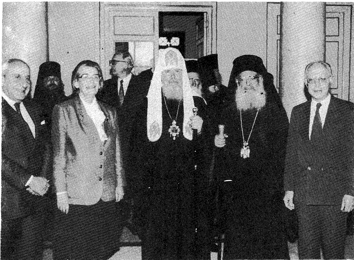
Ἀπὸ τὴν ἐπίσκεψη τοῦ Μακ. Πατριάρχου Μόσχας κ. Ἀλεξίου στὸ Ὑπουργεῖο Ἐξωτερικῶν. Στὴ φωτογραφία μας διακρίνονται ὁ Μακ. Ἀρχιεπίσκοπος κ. Σεραφεῖμ καὶ οἱ Ὑφυπουργοὶ κ. Τσουδεροῦ καὶ κ. Τζούνης.

τερικῶν κ. Βιοργινία Τσουδεροῦ καὶ στις 12 μὲ τὸν Πρωθυπουργὸ κ. Κωνσταντῖνο Μητσοτάκη στὸ Μέγα- ρο Μαξίμου. Ὅπως καὶ στις προηγούμενες συναντή- σεις ἦταν παρὼν ὁ Μακ. Ἀρχιεπίσκοπος κ. Σεραφεῖμ. Ἡ συνάντηση μὲ τὸν Πρωθυπουργὸ κράτησε τρία τέταρτα τῆς ὥρας καὶ ἐγινε μέσα σὲ πολὺ ἐγκάρδια