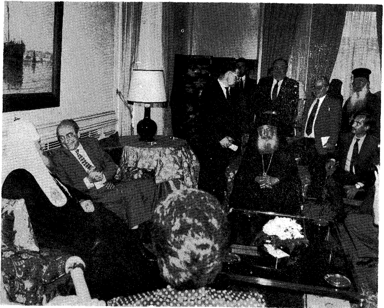
Ἀπὸ τὴν συνάντηση τοῦ Μακ. Πατριάρχου Μόσχας κ. Ἀλεξίου μετὸν Πρωθυπουργὸ κ. Κων. Μητσοτάκη. Διακρίνεται ὁ Μακ. Ἀρχιεπίσκοπος κ. Σεραφεὶμ καὶ ὁ Πρέσβυς τῆς Ἑλλάδος στὴ Μόσχα κ. Γούναρης.

ὑποτροφιῶν, πέραν τῆς βοήθειας τῆς Ἐκκλησίας τῆς Ἑλλάδος, γιὰ τὴν ὁποία συνεχάρη τὸν Μακ. Ἀρχιεπίσκοπο κ. Σεραφείμ.