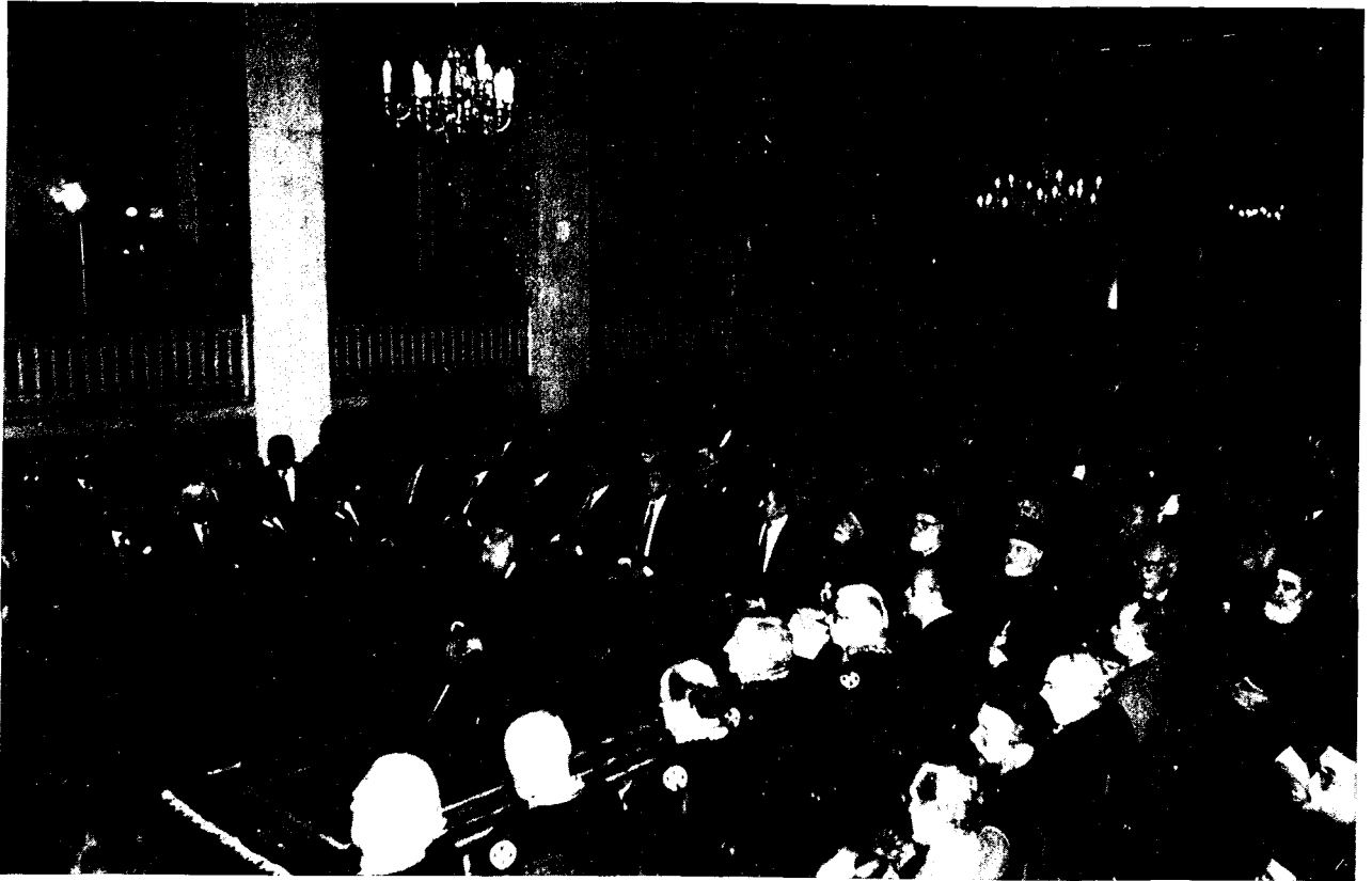
Ἀπό τὴν τελετὴ πού ὀργάνωσε ἡ Θεολογικὴ Σχολὴ στὸ κεντρικὸ κτίριο τοῦ Πανεπιστημίου Ἀθηνῶν, παρουσία τῶν πρωτανικῶν ἀρχῶν κ.ἄ. ἐπισήμων, πρὸς τιμὴν τοῦ Μακαριωτάτου.

ὁποίων – Ἐκκλησίας καὶ Ἔθνους – προυμάχησαν ἐπὶ 55 ὀλόκληρα ἔτη ἀπὸ τῆς εἰς Διάκονον χειροτονίας του τῷ 1938.