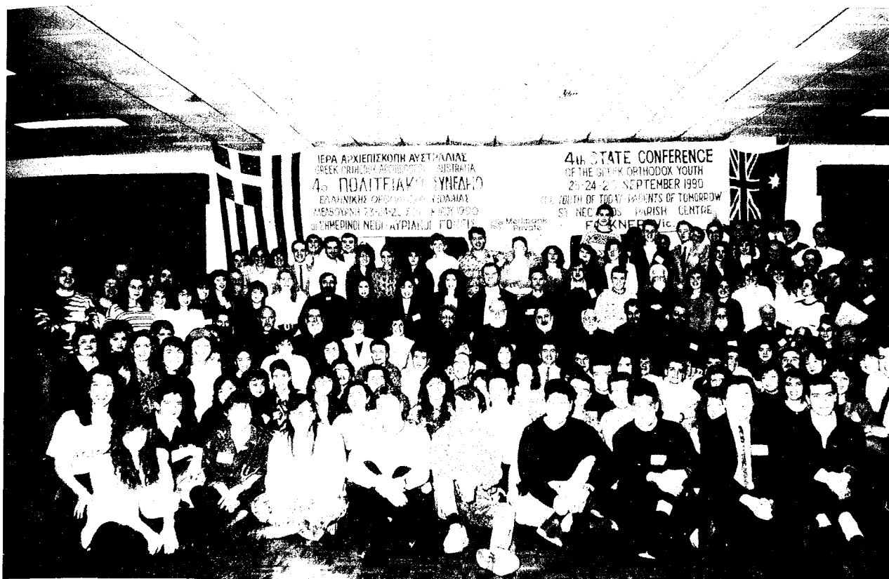
Άπό τὸ Δ' Πολιτειακὸ Συνέδριό Ἑλληνορθόδοξου Νεολαίας στὴ Μελβούρνη τὸ 1990.

Πρὸς ὑπόδειξι ἔπειτα τῶν διαφορῶν, οἱ ὁποῖες ὑπάρχουν μεταξύ τῆς κοσμικῆς καὶ τῆς χριστιανικῆς Ἀξιολογίας, ὁ Σεβ. Εἰσηγητῆς —μὲ τὴν διακρίνουσα πάντοτε τὸν λόγο του κρυσταλλίνη σαφήνεια, βαθύτητα στοχασμοῦ, ρωμαλεότητα ἐκφράσεως, πρωτοτυπία συγχρονισμένης καὶ ζωντανῆς ποιητικῆς γλώσσας— παρουσίασε δειγματοληπτικῶς τὴ στάσι ἀμφοτέρων τῶν Ἀξιολογιῶν ἀπέναντι στις κεντρικὲς ἀξίες τῆς ἐλευθερίας, τῆς ιδιοκτησίας, τῆς ὑγείας, τῆς παιδείας, τῶν διαπροσωπικῶν καὶ κοινωνικῶν σχέσεων. Ἡ Εἰσήγησις κατέληξε στὴ συμπερασματικὴ διαπίστωση, ὅτι «θὰ ἔχει γιὰ πάντα ἀκατάλυτο κῦρος τὸ ἀξιωματικὸ ἐρώτημα τοῦ Χριστοῦ: “Τί ὠφελήσει ἄνθρωπον, ἐὰν κερδίῃ τὸν κόσμον ὅλον καὶ ζημιωθῇ τὴν ψυχὴν αὐτοῦ; Ἡ τί δώσει ἄνθρωπος ἀντάλλαγμα τῆς ψυχῆς αὐτοῦ;”» (Ματθ. η', 36-37).