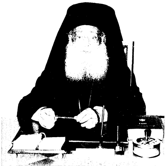
20 χρόνια θεοφιλοῦς αρχιεπισκοπείας συνεπλήρωσε ο Μακ. Αρχιεπίσκοπος Αθηνών και πάσης Ελλάδος κ. Σεραφείμ τὸ 1994. (Φωτ. Χρ. Μπόνη).

Μαΐστορες της Βυζαντινής Τέχνης» υπό τήν διεύθυνση του Καθηγητή της Μουσικολογίας κ. Γρ. Στάθη έψαλε πολυχρονισμό και άλλους ύμνους προς τιμήν του Μακαριωτάτου. Μετά από