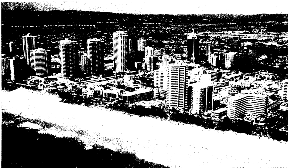
Η «Χρυσή Άκτι» (Gold Coast)

Τὸ πρωϊνὸ πρόγραμμα τῆς τελευταίας ἡμέρας τοῦ Συνεδρίου ἔληξε μὲ τὸ ὅτι ὅλοι οἱ συνέδριοι ἔψαλαν τὴ φήμη τοῦ Παναγιωτάτου Οἰκουμενικοῦ Πατριάρχου κ. Βαρθολομαίου καὶ τοῦ Σεβ. Ἀρχιεπισκόπου κ. Στυλιανοῦ.