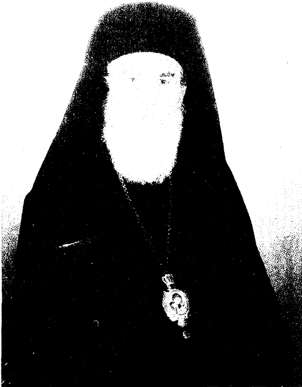
Ὁ ἀείμνητος Μητροπολίτης Δρυϊνουπόλεως Σεβαστιανός.

Ὁ τετιμημένος κυρὸς Σεβαστιανὸς ὑψοῦται φάρος ἀειφεγγῆς Ἐθνικὸς καὶ Ἐκκλησιαστικὸς, ἐκπέμπων