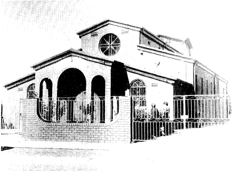
Ὁ ἱερός Ναός τῶν Τριῶν Ἱεραρχῶν (Clayton Μελβούρνης).

«Ἡ Φωνὴ τῆς Ὁρθοδοξίας», τοῦ τοπικοῦ Ἐκκλησιαστικοῦ Βιβλιοπωλείου, τῶν ἐνοριακῶν πνευματικῶν καὶ πολιτιστικῶν κέντρων καὶ τοῦ πλήθους τῶν Ἑλληνορθοδόξων Κατηχητικῶν καὶ λοιπῶν Ἐκπαιδευτηρίων καὶ Σχολείων ὄλων τῶν κατηγοριῶν.