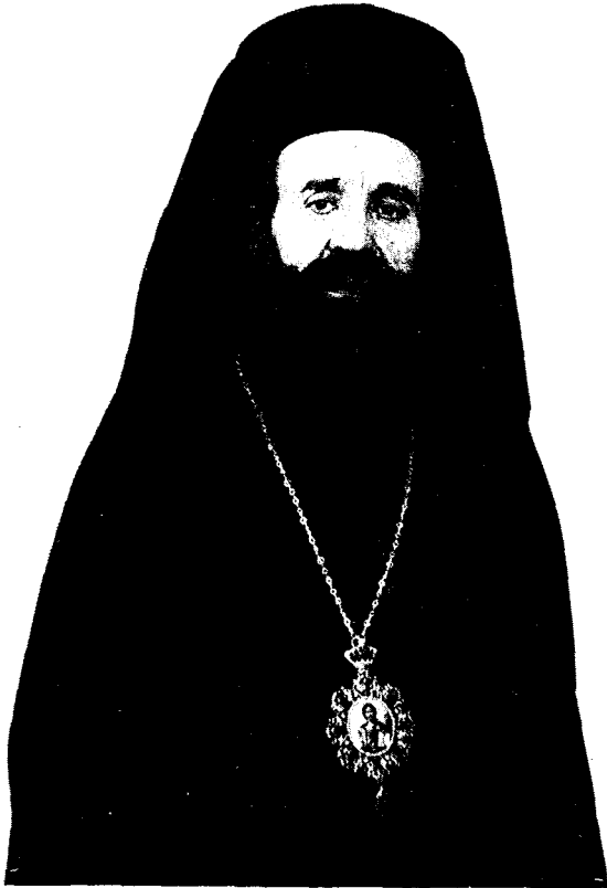
Ὁ ἀείμνητος Μητροπολίτης Νικαίας Ἰάκωβος.

Θανάτου ἐπίσκεψις, λοιπόν, ἰδοὺ τὸ συμβάν, θανάτου θῦμα ἰδοὺ τὸ ὀρώμενον, ἰδοὺ ἡ μοιραία ἐπαδὸς τῆς ζωῆς ἀπὸ τὴν ὁποίαν ἠρπάγη ὁ πεφιλημένος Ἱεράρχης, «ὁ ἡδὺς τὸν λόγον καὶ