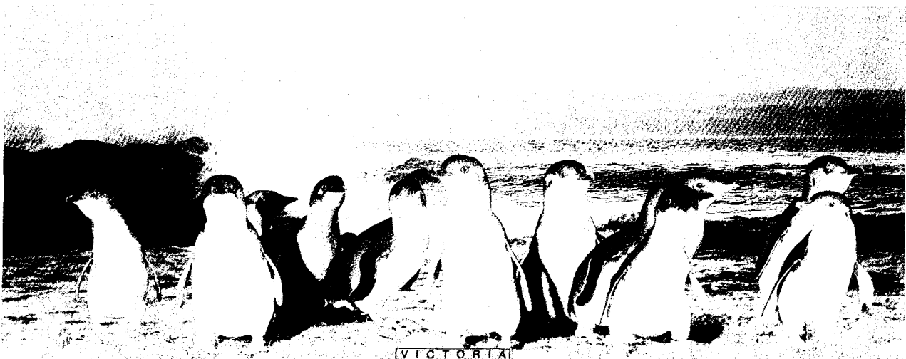
Επιστροφή ομάδος πιγκουΐνων στην άκτῃ, ανάπαυσις, ἀναμονῃ τῶν συντρόφων τους καὶ ἐτοιμασία γιὰ τὴν παρέλασι.

ροῦ ξεχώριζαν οἱ σιλουέτες τους. Στέκονταν, τίναζαν ὀρθώνοντας τὸ κορμί τους καὶ περιμένασαν ἄλλες μικρὲς συντροφίες πιγκουΐνων, ποὺ κατέφθαναν ἀλλεπαλλήλως. Ὅταν διαπίστωσαν, ὅτι δὲν ὑπῆρχε κοντὰ τους ἐχθρὸς ἢ κίνδυνος, συντάχθηκαν σὲ ξεχωριστὲς ομάδες 15-30 ἀτόμων, ποὺ ἀπεΐχαν λίγα μέτρα ἢ μίᾱ ἀπὸ τὴν ἄλλη, καὶ ἄρχισαν τὴν πορεία τους στὴν ὠραία ἀμμουδιά. Οἱ διδόμενες ἀπὸ τὰ μεγάλφωνα πληροφορίες ἐπεσήμαιναν, ὅτι μερικὲς φορὲς οἱ ομάδες γίνονται πολυπληθέστερες καὶ μπορεῖ νὰ περιλαμβάνουν ἕως καὶ 300 ἄτομα.