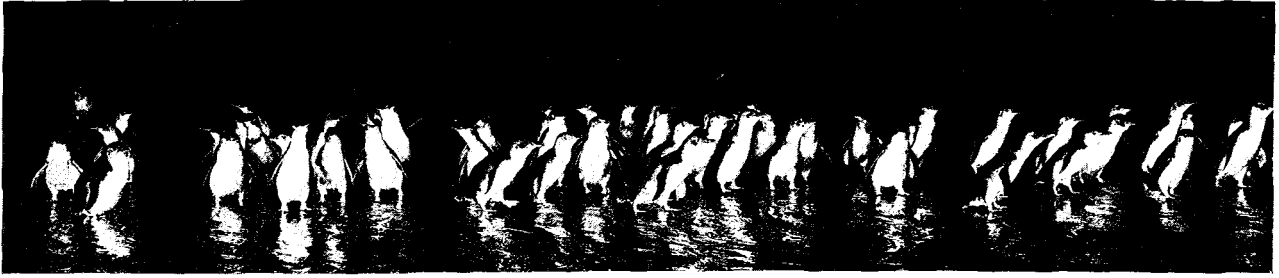
Παρέλασις τῶν πιγκουΐνων καὶ πορεία πρὸς τὶς φωλιές τους.