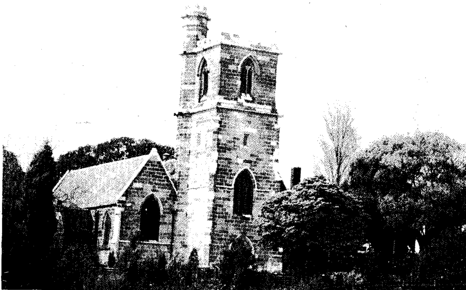
Ὁ Ἱερὸς Καθηδρικὸς Ναὸς τοῦ Εὐαγγελισμοῦ τῆς Θεοτόκου στὸ Σίδνεϋ.