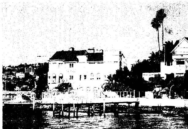
Σπίτια στην παραλία του λιμανιού του Σύδνεϋ.

Sydney. 'Εκεί, σ' ένα περίπατο, χαρήκαμε την ζωηρή κίνησι των πλοίων, των πλοιαρίων, των επίσκεπτών, των πολυχρώμων ταξιδιωτικών γραφείων και τουριστικών καταστημάτων και περιπτέρων.