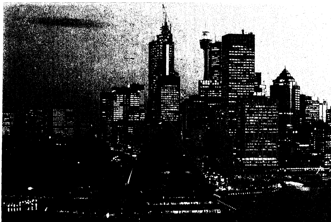
Τὸ κέντρο τοῦ Σύδνεϋ.