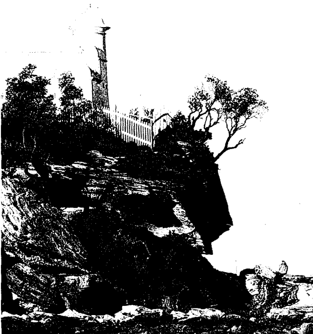
Φάρος στην παραλία του Σύδνεϋ.

ριο που εκτελεί τακτική συγκοινωνία προς σύνδεσι διαφόρων τμημάτων του λιμένος, ήλθαμε στην κεντρική αποβάθρα των τοπικών πλοίων. Από εκεί, υπό αρκετά καυστικών ήλιο, περιπατήσαμε έως τὸ οἰκοδόμημα τῆς Ὀπερας, τοῦ ὁποίου γνωρίσαμε ἀπὸ κοντὰ τὴν ψαρόμορφη ἐξωτερικὴ ἐπιφάνεια καὶ τὴν ἐπιβλητικὴ θέσι του στὴν παραλία τοῦ μικροῦ ἀκρωτηρίου. Ἀτυχῶς, ἔνεκα συνεδρίου, ποὺ γινόταν κεκλεισμένων τῶν θυρῶν μέσα στὸ κτίριο τῆς Ὀπερας, ἡ εἴσοδος ἐκείνην τὴν ἡμέρα ἦταν κλειστὴ γιὰ τοὺς ἐπισκέπτες καὶ ἔτσι δὲν κατορθώσαμε νὰ γνωρίσουμε τοῦ ἀξιοθεάτου ἐσωτερικοὺς χώρους. Τὸ πρωτότυπο αὐτὸ καὶ πολὺπλοκο ἐπιβλητικὸ οἰκοδόμημα ἄρχισε νὰ κτίζεται τὸ 1959 μὲ σχέδια τοῦ δανοῦ ἀρχιτέκτονος Jorh Utzon καὶ ὠλοκληρώθηκε τὸ 1973, ὅποτε καὶ ἐγκαινιάσθηκαν οἱ διάφορες καλλιτεχνικὲς παραστάσεις (ὄπερας, μπαλέτου, θεάτρου, συμφωνικῆς ὀρχήστρας κ.λπ.), ποὺ εἶναι διεθνῶς γνωστὲς γιὰ τὴν