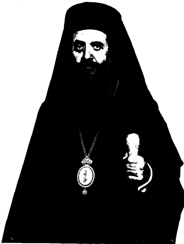
Ὁ Σεβ. Σάμου καὶ Ἰκαρίας κ. Εὐσέβιος.

χαρίζοντάς μου πρωτόγνωρες ἐμπειρίες ἀλλήλων στεναγμῶν καὶ ἱεράς κατανύξεως. Σὲ τοῦτο συνήργησαν οἱ πρῶτες μου δειλῆς προσεγγίσεις στὸ χωρὸ τῆς τοπικῆς μας Ἐκκλησίας, τὴν ὁποῖαν κοσμοῦσε, στὰ πρῶτα παιδικά μου χρόνια, ἡ ἡγεμονικὴ καὶ ἀρχοντικὴ μορφή τοῦ ἀειμνήστου Μητροπολίτου Σάμου κυροῦ Εἰρηναίου, τοῦ φιλοσόφου, καθὼς καὶ ἡ σεμνὴ καὶ ἀθόρυβος ἀλλὰ καρποφόρος καὶ πληθωρικὴ πνευματικὴ παρουσία στὸ πλευρό του, τοῦ τότε ἱεροκήρυκός του π. Ἰωάννου, σημερινοῦ γεραροῦ καὶ σεβαστοῦ Μητροπολίτου Σιδηροκάστρου. Ὁ ὁποῖος μὲ ἐχειραγῶγησε στὰ πρῶτα ἄδηλα καὶ δύσκολα χρόνια τῆς νιότης, προσανατολίσας με πρὸς τὸ ἱερὸ Θυσιαστήριον καὶ χορηγῆσας εἰς ἐμὲ κατὰ δόσεις τὴν ἀτυφον εὐλάβειαν καὶ τὶς λοιπὰς ἀρετὰς τοῦ χριστιανικοῦ ἀγῶνος. Εὐλαβῶς ἀναμνησκόμεθα τώρα καὶ τῆς εὐγενικῆς καὶ ἀριστοκρατικῆς μορφῆς τοῦ μετέπειτα Ποιμενάρχου μας Σεβ. Παντελεήμονος ὁ ὁποῖος μὲ τὴν χαρακτηρίζουσαν αὐτὸν μεγαλοπρέπειαν εἰς τὴν λατρείαν, ὠμίλει στὴν παιδική μου ψυχὴ καὶ συνήραπε τὸν νοῦν μου καθ' ὅλην τὴν διάρ-