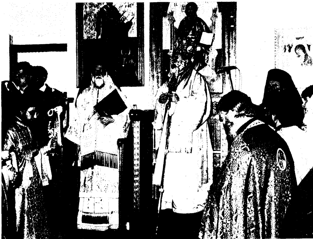
Στιγμιότυπον ἀπὸ Θ. Λειτουργία κατὰ τὴ διάρκεια τοῦ 5ου Παναυστραλιανοῦ Συνεδρίου Ἑλληνορθόδοξου Νεολαίας στὴν Ἀδελαΐδα. Διακρίνονται ὁ Σεβ. Ἀρχιεπίσκοπος Αὐστραλίας κ. Στυλιανός, ὁ Θεοφ. Ἐπίσκοπος Δέρβης κ. Ἰεζεκιήλ (στὸ κέντρο) καὶ ὁ Θεοφ. Ἐπίσκοπος Ἀριανζοῦ κ. Ἰωσήφ (δεξιά).