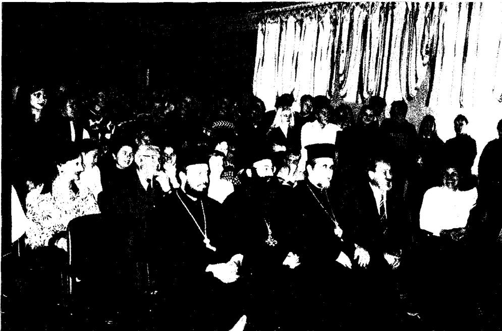
Ο Σεβ. Μητροπολίτης Κερκύρας κ. Τιμόθεος με τους καθηγητές και μαθητές του Λυκείου Ντονιέτοκ, παρακολουθεί επίδειξη των Ελλήνων μαθητών.

της Ελλάδος, ή οποία έξ έπόψεως Έκκλησιαστικής θά μελετήσει τὸ ὄλον θέμα καὶ θά λάβει τις ἀνάλογες ἀποφάσεις.