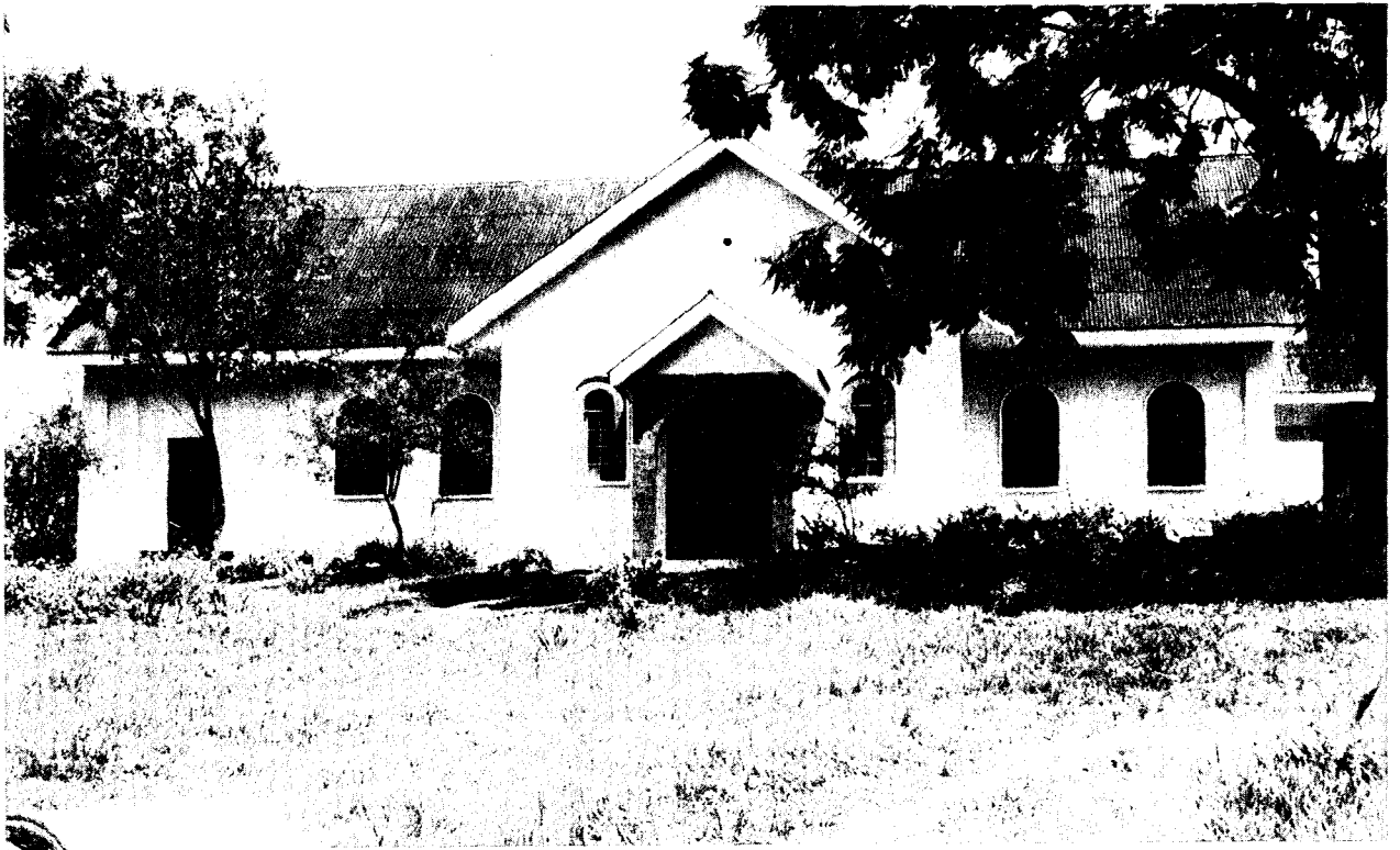
Ο Ι. Ναός του αγίου Νικολάου στην Καμπάλα (βόρεια άποψη).

τόν Θεοφ. Έπίσκοπο Ναυκρατίδος κ. Θεόδωρο Nankyama. Ο Σεβ. κ. Θεόδωρος είναι, ως γνωστόν, ο πρώτος Άφρικανός που σπούδασε Όρθόδοξη Θεολογία στο Πανεπιστήμιο Άθηνών και το πρόσωπο εκείνο που διεδραμάτισε πρωταγωνιστικό ρόλο στο δύσκολο και πολύπλευρο έργο της ίδρύσεως και εδραιώσεως της Όρθόδοξης Έκκλησίας στη Χώρα του, στην καρδιά της Άφρικής! Σεμνός, εύγενής, εύφυής, αλλά μετριοπαθής, ένθερμος και ένθουσιώδης ζηλωτής, από τα φοιτητικά του χρόνια, μέχρι σήμερα, δεν σταμάτησε ούτε στιγμή να εργάζεται, να ταξιδεύει και να κηρύττει, ως γνήσιος μαθητής και απόστολος του Χριστού! Η συμβολή του κ. Θεοδώρου ήταν ιδιαίτερα σημαντική, κατά την είκοσαετία 1960-1980, κατά την οποία η Όρθόδοξη Έκκλησία στην Ουγκάντα αντιμετώπισε πολλές και μακροχρόνιες πολιτικές (πολεμικές) και έθνικοφυλετικές περιπέτειες. Το γεγονός, ότι η Όρθόδοξη Έκκλησία στην Ουγκάντα ξεπέρασε όλες αυτές τις δυσκολίες και έφθασε στο σημείο να ανακηρυχθεί «Μητρόπολις» οφείλεται, κατά ένα μεγάλο ποσοστό, στην προσωπικότητα και τις προσπάθειες του κ. Θεοδώρου. Στην άντοχή, την καρτερία, την έπιμονή και ύ-