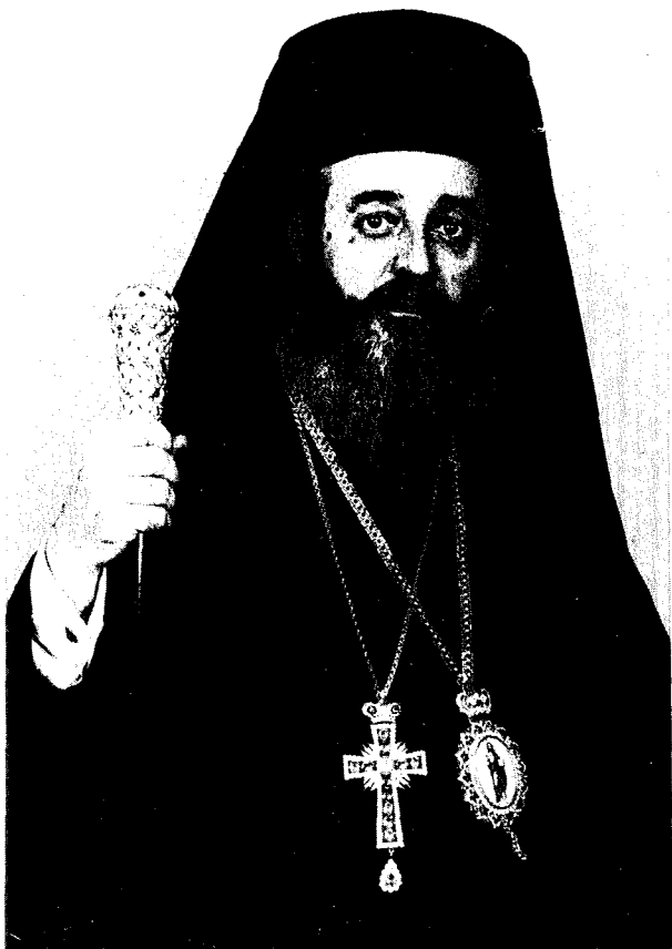
Ο Σεβ. Μητροπολίτης Φθιώτιδος κ. Νικόλαος.

στον όποϊον δεσπάζει τὸ μυστήριό τοῦ Γολγοθᾶ καὶ ἀκτινοβολεῖ τὸ φῶς τῆς Ἀναστάσεως.