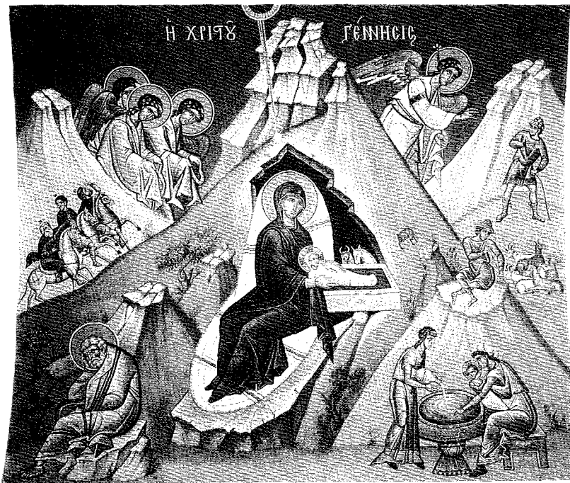
«Ἡ Χριστοῦ Γέννησις», τοῦ Φώτη Κόντογλου 1962, (τοιχογραφία Ἰ. Ναοῦ Ἀγ. Νικολάου Κάτω Πατησίων.

ξης εἰς δόξαν, καθάπερ ἀπὸ Κυρίου Πνεύματος» (Β' Κορ. 3,18), φωτισθέντες.