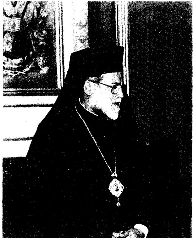
Ἡ Α.Θ.Μ. ὁ νέος Πάπας και Πατριάρχης Ἀλεξανδρείας και πάσης Ἀφρικῆς κ.κ. Πέτρος ὁ Ζ', ἀμέσως μετὰ τὴν ἐκλογή του στὸν ἱστορικὸ θρόνο τοῦ Ἀποστόλου Μάρκου.

ἀφρικανικοῦ ποιμνίου· ἀρχικὰ ὁ ἀριθμὸς τῶν ἐκλεκτῶν ἀνερχόταν στοὺς 200, ἐξεδήμησε ὁμως τὸν παρελθόντα Ἰανουάριο ὁ πρῶτος Ἀφρικανὸς Μητροπολίτης τοῦ Πατριαρχείου Καμπάλας Θεόδωρος): 1. Μητροπολίτης Καμερούν Πέτρος 154. 2. Μητροπολίτης Κεντρῶας Ἀφρικῆς Τιμόθεος 113. 3. Μητροπολίτης Ζιμπάμπουε Χρυσόστομος 101. Λευκὴ 1. Ἀπέσχον 2. Στὴ συνέχεια τὰ μέλη τῆς Ἱερᾶς Συνόδου (Ἰωαννουπόλεως Παῦλος, Τοποτηρητῆς, Χαροῦμι-Νουβίας Διονύσιος, Κεντρῶας Ἀφρικῆς Τιμό-