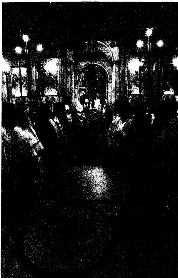
Άπό τὸ Συλλείτουργο στὸν Ἱ. Ναὸ Εὐαγγελισμοῦ Ἀλεξανδρείας, στὸ ὁποῖο προεξήρχαν ἡ Α.Θ.Μ. ὁ Πάπας καὶ Πατριάρχης Ἀλεξανδρείας καὶ πάσης Ἀφρικῆς κ.κ. Πέτρος καὶ ὁ Μακ. Ἀρχιεπίσκοπος Ἀθηνῶν καὶ πάσης Ἑλλάδος κ.κ. Χριστόδουλος.

Τὸ βράδυ τὸν Μακ. Ἀρχιεπίσκοπο Ἀθηνῶν καὶ πάσης Ἑλλάδος κ. Χριστόδουλο δεξιώθηκε στὴ θαυμάσια προξενικὴ κατοικία στὴν ἑπαυλὴ Βολονάκη, ποὺ μαρτυρεῖ τὴν αἴγλη τῆς ἑλληνικῆς παροικίας τῆς Ἀλεξανδρείας, ὁ Γεν. Πρόξενος τῆς Ἑλλάδος στὴν πόλη κ. Γρηγόριος Παπαδόπουλος. Προσῆλθαν ὁ Μακ. Πάπας καὶ Πατριάρχης Ἀλεξανδρείας καὶ πάσης Ἀφρικῆς κ. Πέτρος, οἱ Ἀρχιερεῖς τῆς Ἐκκλησίας τῆς Ἑλλάδος καὶ τοῦ Π. Θρόνου, οἱ κληρικοί, οἱ διπλωματικοί, οἱ κοινοτικοί, ἐκπρόσωποι τῶν λοιπῶν φορέων, τῆς παροικίας, ὁμογενεῖς, ἀλλὰ καὶ ξένοι ἐπίσημοι.