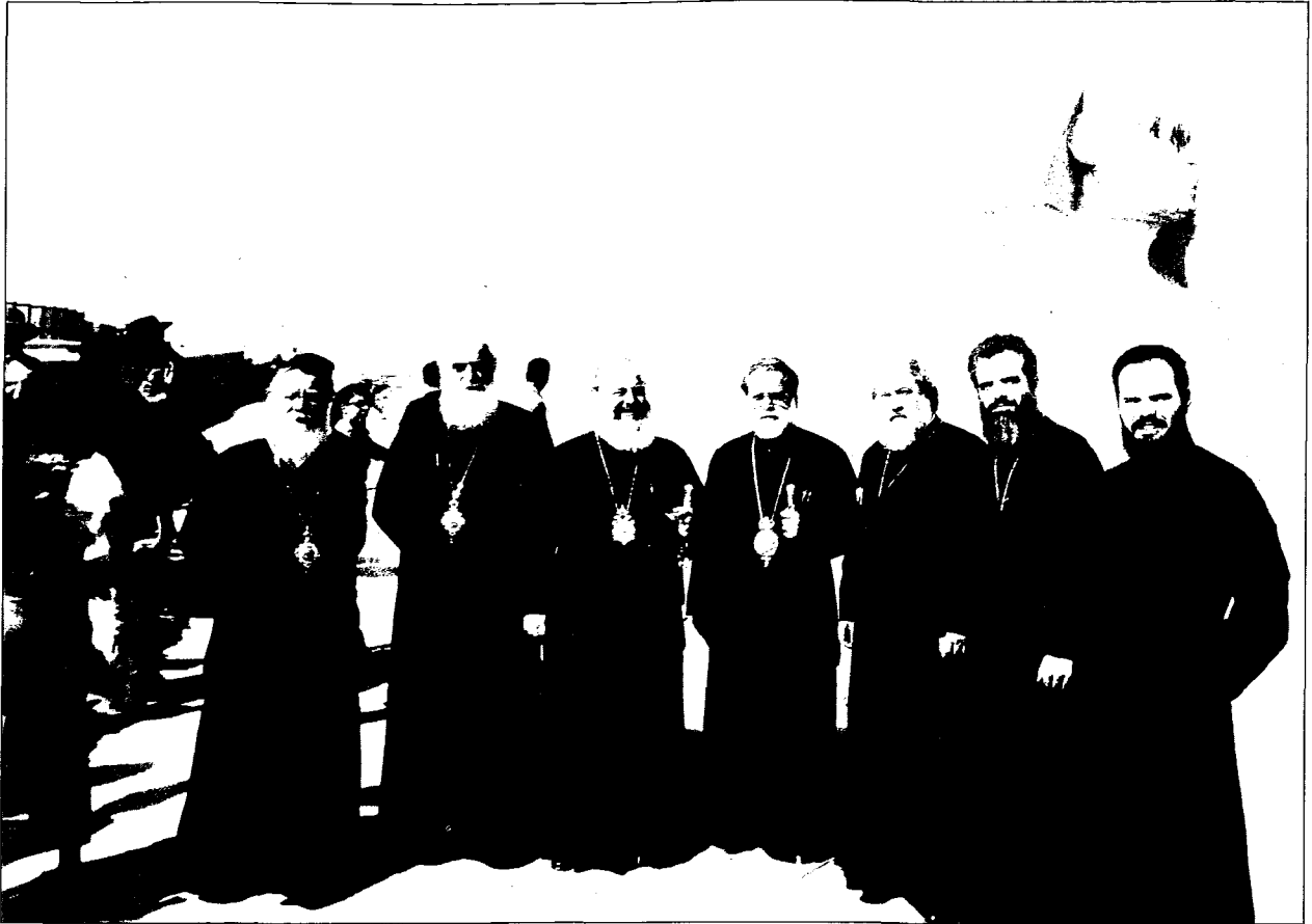
Ὁ Μακ. Ἀρχιεπίσκοπος Ἀθηνῶν καὶ πάσης Ἑλλάδος κ. Χριστόδουλος μετὰ τὴν Α.Θ.Μ. τὸν Πάπα καὶ Πατριάρχη Ἀλεξανδρείας καὶ πάσης Ἀφρικής κ. Πέτρο στις Πυραμίδες. Διακρίνονται ἐπίσης οἱ Σεβ. Μητροπολίτες Σταγῶν καὶ Μετεώρων κ. Σεραφεῖμ καὶ Λήμινον κ. Ἰερόθεος, ὁ Παν. Ἀρχιμ. Θεόκλητος Κουμαριανός, ὁ Πρωτ. π. Θωμᾶς Συνοδινός καὶ ὁ Ἀρχιδιάκονος π. Διονύσιος Κατερίνας.

πάντοτε «οἱ διωγμοὶ λαμπροτέραν τὴν Ἐκκλησίαν ἐποιοῦν τοῖς πάθεσιν», κατὰ τὸν ἅγιον Γρηγόριον τὸν Θεολόγον (Ε.Π. τ. 35,1209).