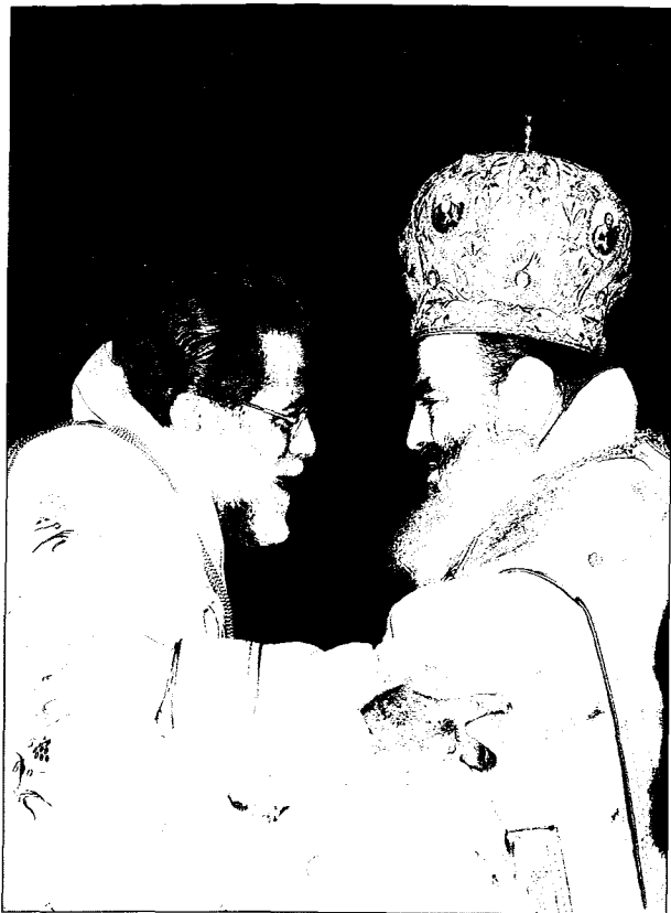
Άδελφικός έν Χριστώ άσπασμός τών δύο Προκαθημένων κατά τό Σύλλείτουργο στόν Ί. Ναό Εδωγγελισμού Άλεξανδρείας.

Μέ τίς σκέψεις αυτές σάς καλωσορίζω καθώς και τήν άκολουθία σας ενόχμενος κάθε έπιτυχία».