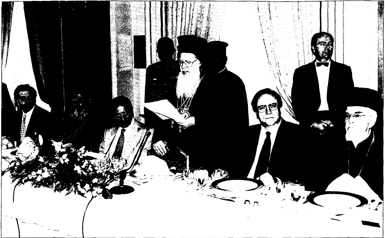
Εύχαριστία στο πέρας του επίσημου προγράμματος που παρέθεσε προς τιμήν της Α.Θ.Π. του Οικουμενικού Πατριάρχη κ. Βαρθολομαίου ο Μακ. Αρχιεπίσκοπος Αθηνών και πάσης Ελλάδος κ. Χριστόδουλος.

λόγου και οι τὰ πρῶτα φέροντες τῆς Ἑλληνικῆς Πολιτείας,