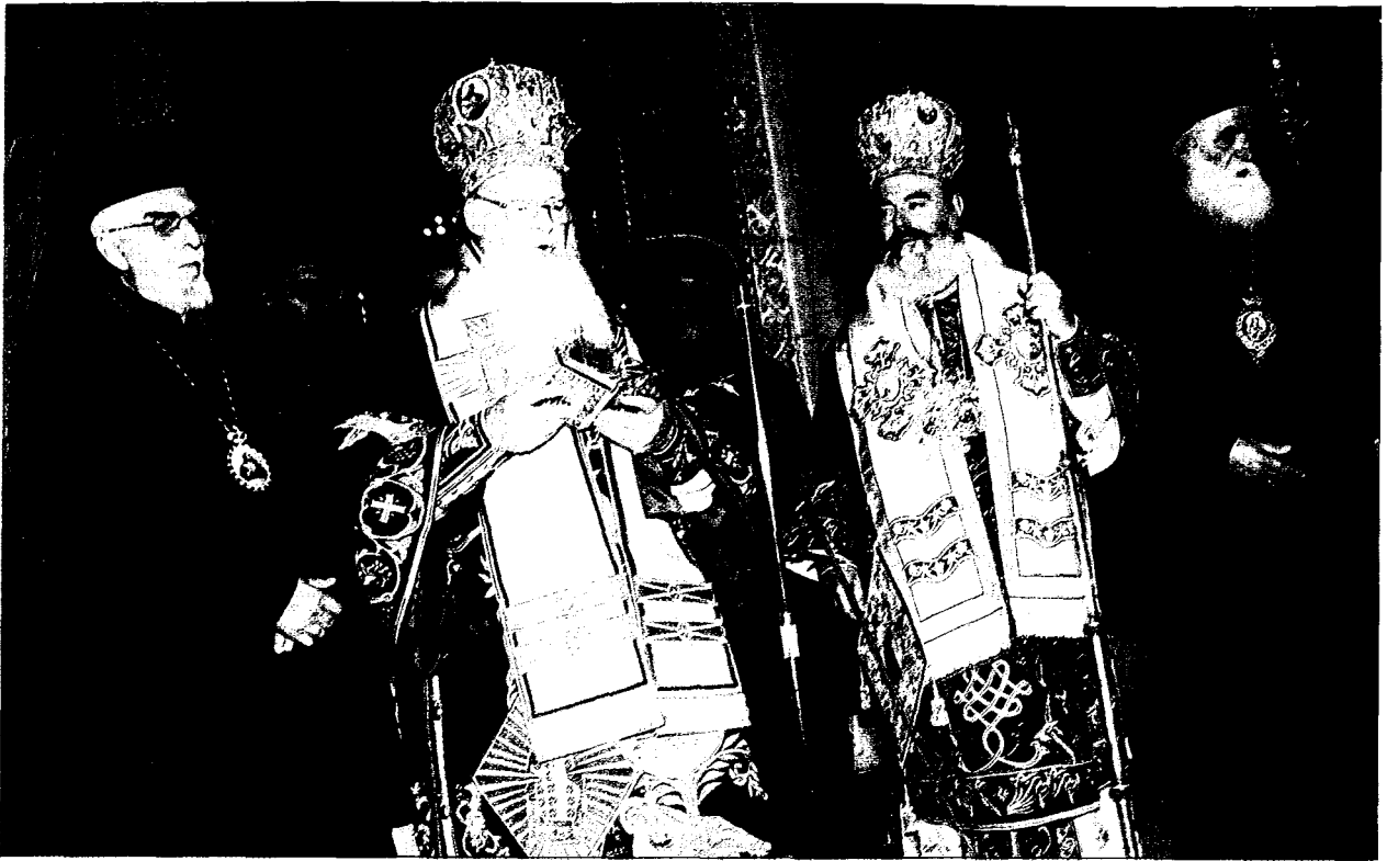
Προσφορά ἀναμνηστικοῦ δώρου ἀπὸ τὴν Α.Θ.Π. τὸν Οἰκουμενικὸ Πατριάρχη κ. Βαρθολομαῖο στὸν Μακ. Ἀρχιεπίσκοπο Ἀθηνῶν καὶ πάσης Ἑλλάδος κ. Χριστόδουλο στὸ πέρας τῆς Πατριαρχικῆς καὶ Συνοδικῆς Θ. Λειτουργίας στὸν Καθεδρικό Ναὸ Ἀθηνῶν.

τες κατ' οἰκονομίαν Θεοῦ, ἐκείνους ἔχομεν διδασκάλους τῆς ἀληθείας. Ἐκείνους κατὰ τῶν αἰρέσεων προμάχους, τῶν τε παλαιῶν, καὶ νεωτέρων καὶ τῶν καινοφανῶν. Ἐκείνους τῆς ποιμαντικῆς ἐπιστήμης καθηγητάς. Ἐκείνους, σὺν τῷ Παρακλήτῳ, παραμυθίαν καὶ στήριγμα ἐν ὥρᾳ πειρασμοῦ καὶ ἀμηχάνου ἐνατενίσεως τοῦ καθ' ἡμέραν ἐνώπιον ἡμῶν ὠκεανοῦ τῶν προβλημάτων, τῶν εὐθυνῶν, τῶν προκλήσεων. Καὶ τούτους ἐπευφημοῦντες ἀναφωνοῦμεν τῶν τῆς Ὁρθοδοξίας προμάχων καὶ διδασκάλων Ἁγίων Πατέρων αἰωνία ἡ μνήμη!