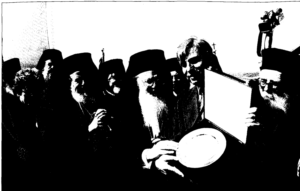
Ο Δήμαρχος Αιγίνης προσφέρει στον Παναγιώτατο άργυρό δίσκο με τὸ σχῆμα τοῦ νησιοῦ. Δίπλα του διακρίνονται ὁ Μακ. Ἀρχιεπίσκοπος Ἀθηνῶν καὶ πάσης Ἑλλάδος κ. Χριστόδουλος, ὁ Σεβ. Μητροπολίτης Γέρον Ἐφέσου κ. Χρυσόστομος κι ὁ Σεβ. Μητροπολίτης Ὑδρας, Σπετσῶν καὶ Αἰγίνης κ. Γερόθεος.

λαδὴ τὴν ἐν τῇ νήσῳ ὑμῶν ἐγκαταβίωσιν τοῦ ἁγίου ἐνεθάρρουνεν ὁ ἐκ τῶν προκατόχων σας Δήμαρχος Αἰγίνης ἰατρὸς Νικόλαος Πέππας, ὅστις ὑπεδέχθη προφορῶνως τὸν Πενταπόλεως Ἅγιον Νεκτάριον κατὰ τὴν πρώτην ἐπίσκεψιν αὐτοῦ εἰς τὴν νήσον, διηκόλυνε δὲ καὶ τὴν ἀνέγερσιν τῆς Μονῆς τῆς Ἁγίας Τριάδος. Μακάριος ὁ τόπος, οἱ ἄρχοντες τοῦ ὁποίου σέβονται τὸν Θεὸν καὶ παρέχουν καταφυγὴν εἰς τοὺς ἐκλεκτοὺς Αὐτοῦ! Καταφυγὴν, ἢ ὁποία ἐπιστρέφει εἰς τὸν τόπον ὡς εὐλογία καὶ χάρις.