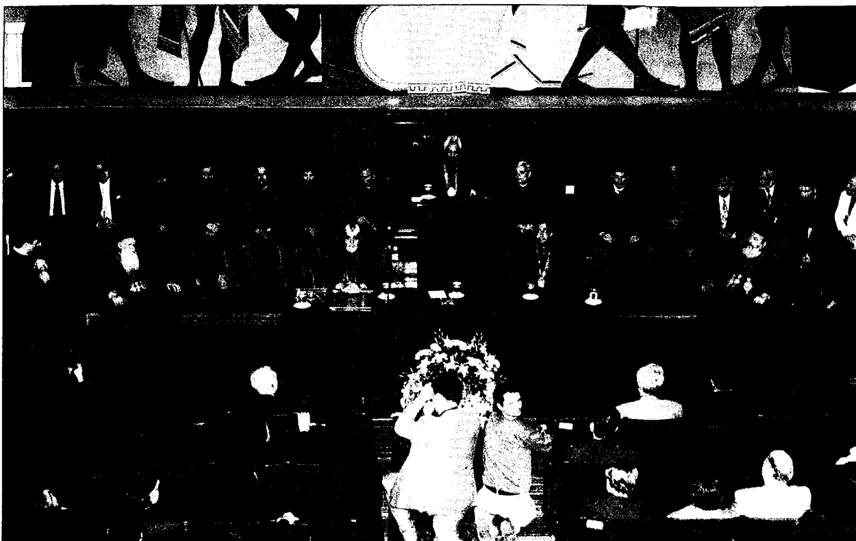
Άπό τήν ἐκδήλωση στό Πάντειο Πανεπιστήμιο πρὸς τιμὴν τοῦ Οἰκουμενικοῦ Πατριάρχου κ. Βαρθολομαίου.

Χωρὶς ἀμφιβολία αὐτὴ εἶναι ἡ στιγμή τῆς Οἰκουμενικότητας καὶ τοῦ Κοινωνικοῦ ρόλου τοῦ Πατριαρχείου τῆς Κωνσταντινουπόλεως. Αὐτὴ εἶναι ἡ στιγμή τοῦ Προκαθημένου του, τῆς Α.Θ.Π. τοῦ Πατριάρχου κ. κ. Βαρθολομαίου τοῦ Α', πον τιμᾶ καὶ εὐλογεῖ σήμερα τὸ Πανεπιστήμιο τοῦτο. Γεννημένος στὴ νῆσο Ἴμβρο ἐνῶ εἶχε ξεσπάσει ὁ Β' Παγκόσμιος Πόλεμος, κάτι πὸν ἐξηγεῖ τὸ πάθος του γιὰ τὴν παγκόσμιο εἰρήνη. Μὲ θεολογικὲς σπουδές, προπτυχιακὲς καὶ μεταπτυχιακὲς, στὴν περιώνυμο Σχολὴ τῆς Χάλκης καὶ στὴν Εὐρώπη, ἔχει ἐξαντλήσει ὅλη τὴν ἱεραρχία καὶ τίς διοικητικὲς θέσεις τῆς Ἁγίας Ὁρθοδόξου Ἐκκλησίας. Ἐπίτιμος Διδάκτωρ Πανεπιστημίων τῆς Ἑλλάδος, τῆς Ρωσίας, τῆς Ἀγγλίας, τοῦ Βελγίου, τῆς Γαλλίας, τῆς Σκωτίας, τῶν ΗΠΑ, τῆς Ρουμανίας, τῆς Αὐστρίας καὶ ἄλλων χωρῶν. Πολύγλωσσος καὶ πολυμαθής. Ἡ συνεισφορὰ του στὸν τομέα προωθήσεως τῶν Διορθοδόξων, τῶν Διαχριστιανικῶν καὶ τῶν Διαθρησκειακῶν σχέσεων εἶναι κολοσσιαία. Ἰδιαίτερα, μάλιστα, σὲ μιὰ περίοδο πὸν ξεθάβονται θρησκευτικὲς ἀντιπαραθέσεις καὶ στήνον-