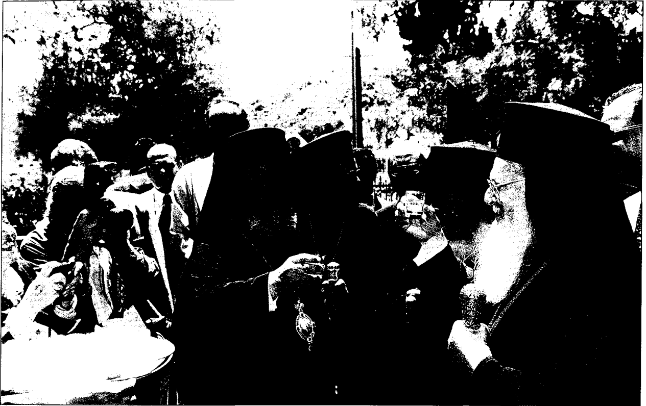
Πριν τὸ ἐπίσημο πρόγευμα στὴν Ἱ. Μονὴ Ἁγίου Νεκταρίου. Προπόσεις μεταξὺ τοῦ Οἰκουμενικοῦ Πατριάρχη κ. Βαρθολομαίου καὶ τοῦ Ἀρχιεπισκόπου Ἀθηνῶν καὶ πάσης Ἑλλάδος κ. Χριστοδούλου. Διακρίνεται ὁ Σεβ. Μητροπολίτης Ὑδρας, Σπετσῶν καὶ Αἰγίνης κ. Ἱερόθεος.

ιερόν του λείψανον πηγὴν θαυμάτων καὶ ἰάσεων καὶ αὐτὸν ἀπροσμάχητον βοηθὸν διὰ κάθε πιστόν, ὁ ὁποῖος τὸν ἐπικαλεῖται, καὶ φρουρὸν καὶ προστάτην ἀνύστακτον τῆς Ἱερᾶς Μονῆς του καὶ ὁλοκλήρου τῆς νήσου ταύτης. Ἐδῶ δὲν ἠμποροῦμεν νὰ μὴ συγχαρῶμεν καὶ τὸν Ἱερώτατον Μητροπολίτην Ὑδρας, Σπετσῶν καὶ Αἰγίνης κύριον Ἱερόθεον, προσφιλέστατον ἐν Χριστῷ ἀδελφὸν καὶ συλλειτουργὸν ἡμῶν, διὰ τὴν ἀπόφασίν του, λόγῳ τῆς συρροῆς τῶν πιστῶν, νὰ ἀνεγείρῃ τὸν περικαλλῆ καὶ μεγαλοπρεπῆ Ἱερόν Ναὸν πρὸς τιμὴν τοῦ Ἁγίου πλησίον τῆς Ἱερᾶς Μονῆς του.