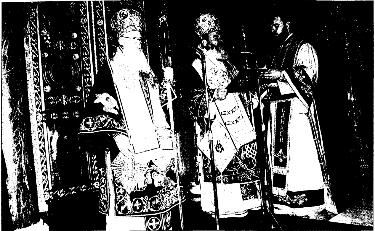
Ο Μακ. Αρχιεπίσκοπος Αθηνών και πάσης Ελλάδος κ. Χριστόδουλος προσφωνεί την Α.Θ.Π. τόν Οικουμενικό Πατριάρχη κ. Βαρθολομαίο.

ἄμων τὸν Τίμιον Σταυρὸν «τῶν τοῦ Χριστοῦ πενήτων», ἐν καρτερία καὶ ὑπομονῇ πολλῇ ἄχρι τοῦ νῦν, ὅτε σημαίνεται τὸ πέρας τῆς δευτέρας σωτηρίου χιλιετίας, ἐν τῇ βεβαιότητι ὅτι «ὑπομονὴ τῶν πενήτων οὐκ ἀπολείται εἰς τὸν αἰῶνα» (Ψαλμ. θ' 9).