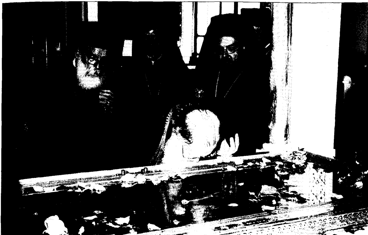
Ο Οικουμενικός Πατριάρχης κ. Βαρθολομαῖος ἀσπάζεται τὸ ἱερό λείψανο τοῦ Ἁγίου Νεκταρίου στὸν μεγαλώνυμο ἱερό ναό του στὴν Αἴγινα.

ὑγείας, μακροημερεύσεως καὶ ὑπὲρ τοῦ ὀρθοτομεῖν τὸν Λόγον τῆς Ὁρθοδόξου Ἀληθείας».