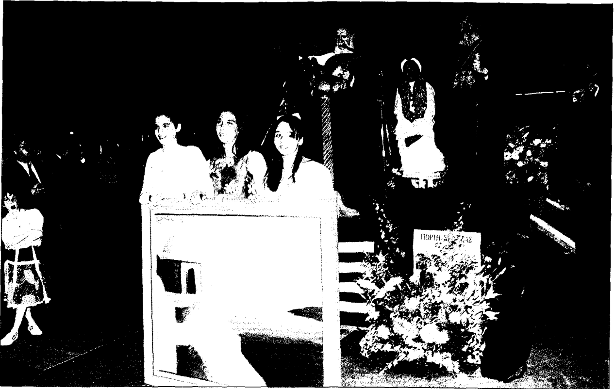
Εορτή Νεότητος τῆς Ἀρχιεπισκοπῆς Ἀθηνῶν καὶ ὁμόρων Ἱ. Μητροπόλεων πρὸς τιμὴν τοῦ Οἰκουμενικοῦ Πατριάρχου κ. Βαρθολομαίου (στὸ βῆμα). Δίπλα του ὁ Ἀρχιεπίσκοπος κ. Χριστόδουλος.

ἀπηύθυνε τὸ ἀκόλουθο μήνυμα, στὴ δημοτικὴ μάλιστα γλῶσσα: