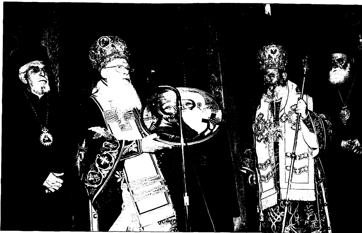
Ο Παναγιώτατος προσφέρει στον Καθεδρικό Ναό Αθηνών εικόνα με τον Απόστολο Άνδρέα και τον Άγιο Διονύσιο Άρεοπαγίτη, ιδρυτές των δύο Έκκλησιών. Διακρίνεται ο Μακ. Αρχιεπίσκοπος Αθηνών και πάσης Ελλάδος κ. Χριστόδουλος και οι Σεβ. Μητροπολίτες Γέρον Έφέσου κ. Χρυσόστομος και Σταγών και Μετεώρων κ. Σεραφείμ.

λόγω τῆς χάριτος τοῦ Θεοῦ τῷ δυναμένῳ οικοδομησαὶ καὶ δοῦναι τὴν κληρονομίαν ἐν τοῖς ἁγιασμένοις πᾶσιν».