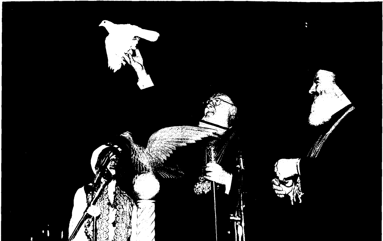
Ὁ Οἰκουμενικὸς Πατριάρχης κ. Βαρθολομαῖος ἀφήνει ἐλεύθερο ἓνα περιστέρι, ἐνῶ παρακολουθεῖ ὁ Μακαριώτατος.

θε μέθοδο. Εἶναι δυνατότερη ἀπὸ κάθε δύναμι. Εἶναι πιὸ χαρμόσυνη ἀπὸ κάθε χαρά. Εἶναι ἐλεύθερη ἀπὸ κάθε ψυχαναγκασμό. Εἶναι ὠφέλιμη σὲ ὅλους. Εἶναι ἡ μόνη πὸν ὅταν τὴν μοιραζόμαστε αὐξάνεται. Εἶναι ἡ μόνη ἀληθινή καὶ ἀναφαίρετη χαρά. Εἶναι ἡ μόνη στὴν ὁποία ταιριάζει ἀπόλυτα ἡ λέξις καὶ ἡ ἔννοια τῆς χαρᾶς. Ὅλες οἱ ἄλλες δῆθεν χαρὲς εἶναι παροδικὲς μικροευχαριστήσεις, πὸν δὲν τοὺς ἀνήκει ὁ χαρακτηρισμὸς τῆς χαρᾶς.