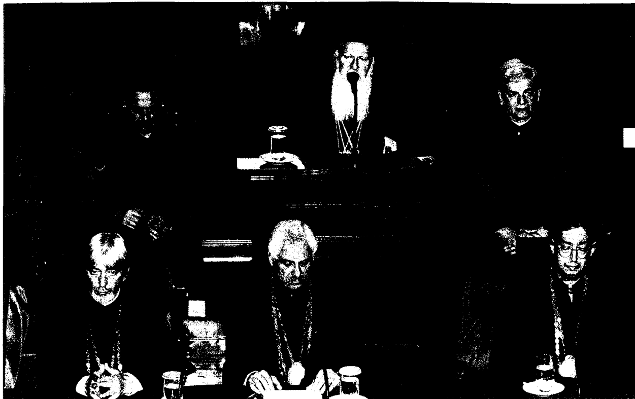
Ὁ Οἰκουμενικὸς Πατριάρχης κ. Βαρθολομαῖος ὁμιλεῖ στό Πάντειο Πανεπιστήμιο.

ὁποῖας ἀναγνωρίζομεν τοὺς μελλοντικοὺς ἐργά- τας τοῦ πνεύματος καὶ τῆς κοινωνικῆς προκοπῆς.