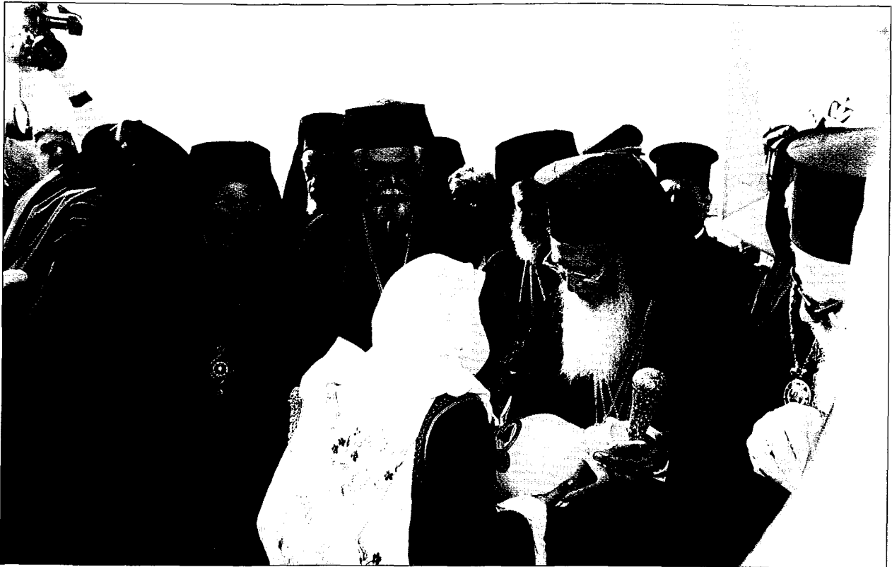
Ύποδοχή του Πατριάρχη Βαρθολομαίου στην Αίγινα. Νεαρή με τοπική ένδυμασία του προσφέρει αιγινήτικο λαϊνό καλλιτεχνικά διακοσμημένο.

Αίγινα, ή οποία έχει τὸ προνόμιον νὰ ἐπιλεγῆ ὑπὸ τοῦ Ἁγίου Νεκταρίου ὡς τόπος ἐγκαταστάσεως τοῦ Ἱεροῦ Ἡσυχαστηρίου, τὸ ὁποῖον ἴδρυσεν.