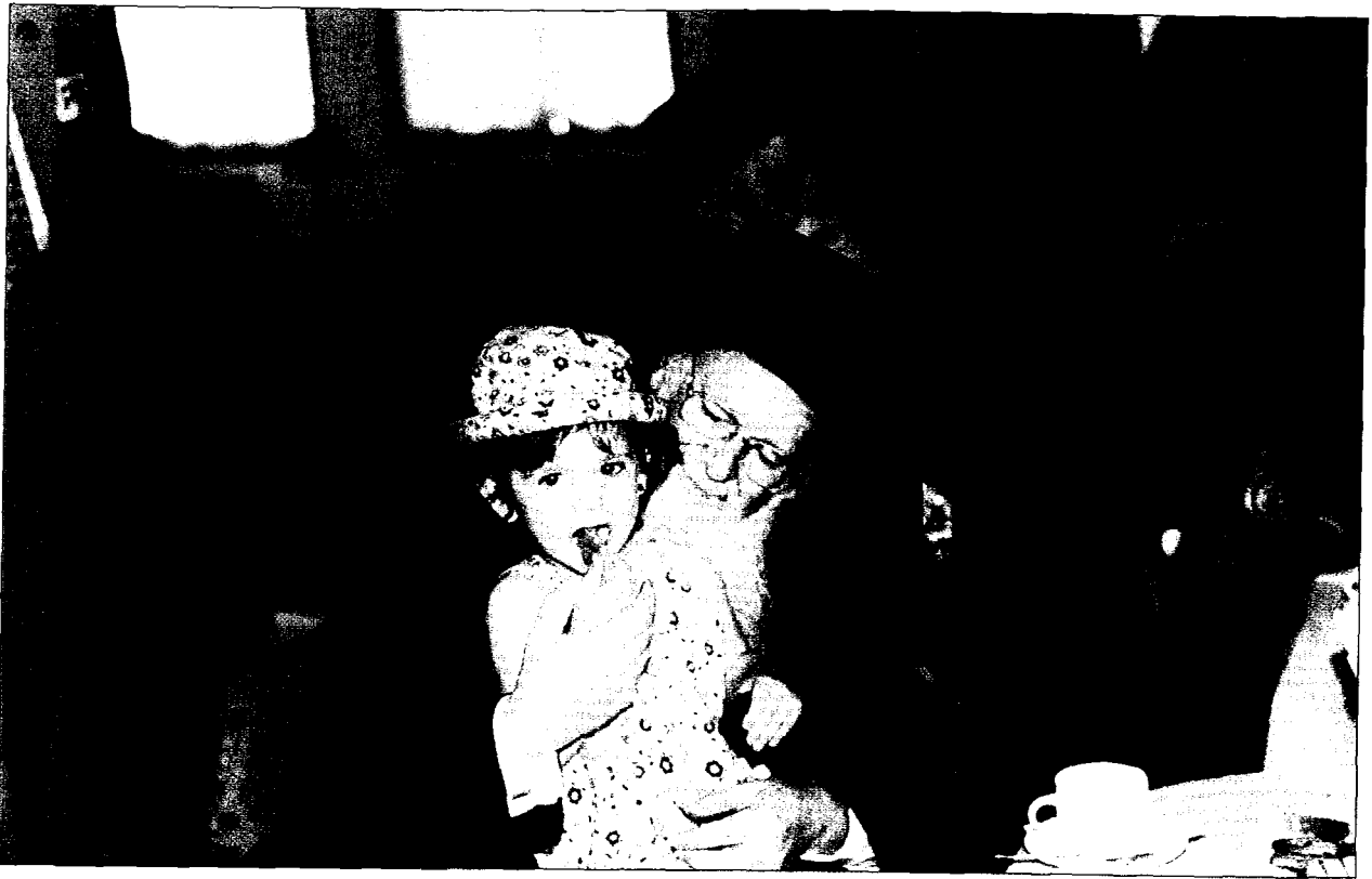
Ο Πατριάρχης Βαρθολομαῖος ἐν πλῆθὶ πρὸς Αἴγινα ἔχει πάρει ἓνα μικρὸ κοριτσάκι στὴν ἀγκαλιά του καὶ τοῦ προσφέρει ἓνα γλύκισμα. Διακρίνονται οἱ Σεβ. Μητροπολίτες Σταγῶν καὶ Μετεώρων κ. Σεραφεῖμ καὶ Λήμνου κ. Τερόθεος.

ποδίστριας, ἔθεσε τὰ θεμέλια τοῦ Ἑλληνικοῦ Κράτους.