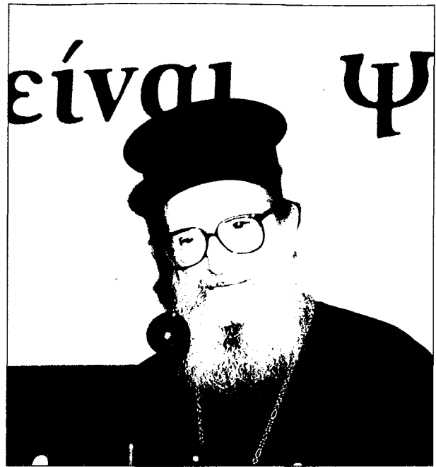
Ὁ Σεβ. Ἀμερικῆς κ. Δημήτριος κατὰ τὴ συνέντευξιν Τύπου.

Ὁ Παναγιώτατος Οἰκουμενικὸς Πατριάρχης εἰς τὴν προσφώνησίν του κατὰ τὸ ἐπὶ Συνόδου Μικρὸν Μήνυμα μοῦ εἶπε: “Σὰς ἐμπιστευόμεθα τὴν μεγαλυτέραν καὶ πλέον δυναμικὴν ἐπαρχίαν τοῦ πανσέπτου Οἰκουμενικοῦ Θρόνου καὶ προτρεπόμεθα ὑμᾶς νὰ ἀποκαταστήσετε καὶ νὰ περιφρουρήσετε τὰ ὑψίστα ἀγαθὰ τῆς εἰρήνης καὶ τῆς ἐνότητος τοῦ ἐν αὐτῇ προσφιλοῦς τῇ Μητρὶ Ἐκκλησίᾳ λαοῦ τοῦ Θεοῦ. Εἰς τὴν προσπάθειάν σας αὐτὴν καὶ ἐν γένει εἰς τὴν διαποίμιασιν τῆς Ἱερᾶς Ἀρχιεπισκοπῆς Ἀμερικῆς θὰ εἴμεθα παρὰ τὸ πλευρὸν ὑμῶν, διότι αὕτη ἀποτελεῖ προσφιλέστατον μέλος τοῦ ἐνὸς σώματος τῆς ὑπὸ τὴν ἄμεσον δικαιοδοσίαν τοῦ Οἰκουμενικοῦ Θρόνου Ἀγιωτάτης Ὁρθοδόξου Ἐκκλησίας καὶ διότι εἶναι ἀδιαίρετος ἡ ἱερά πνευματικὴ συμπόρευσις αὐτοῦ τε καὶ ἐκείνης. Καὶ ἀκόμη διότι “ἡ ἐν τῇ Ἐκκλησίᾳ εὐθύνη τυχάνει ἐνιαία καὶ ἀδιαίρετος”. Ἀπὸ τοῦ Ἱεροῦ τούτου Κέντρου θὰ προσευχόμεθα διὰ τὴν ἰκάνωσιν ὑμῶν ἀπὸ Θεοῦ ἐν τῇ ἄρσει τοῦ ἀνατιθεμένου ὑμῖν βαρέος σταυροῦ καὶ θὰ ἔχωμεν ἐτοιμῶς νὰ συναντηθῶμεν ὑμῖν ἐκάστοτε πρὸς ἀντιμετώπισιν τῶν ἀνα-