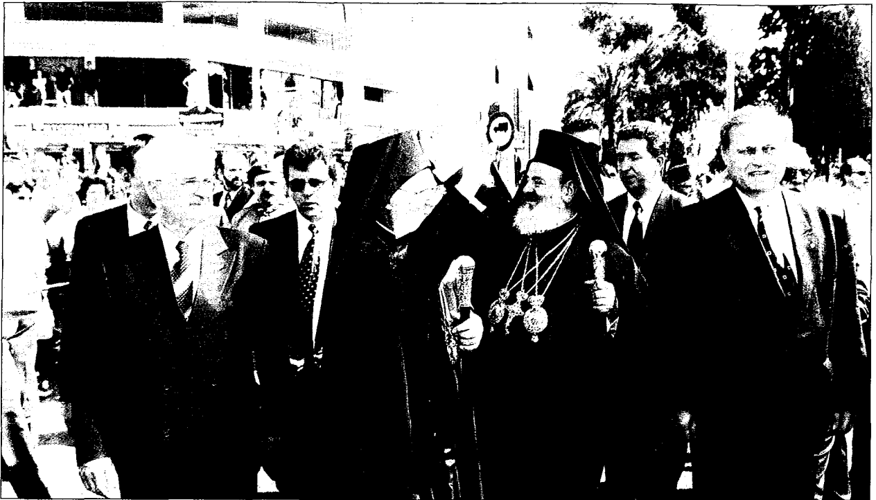
Οι Προκαθήμενοι τών δύο Ἐκκλησιῶν Παναγ. κ. Βαρθολομαῖος καί Μακ. κ. Χριστόδουλος χαιρετοῦν τὸν λαὸ τῆς Νέας Φιλαδελφείας, πὸν τοὺς ἐπευφημεῖ με θερμότητα.