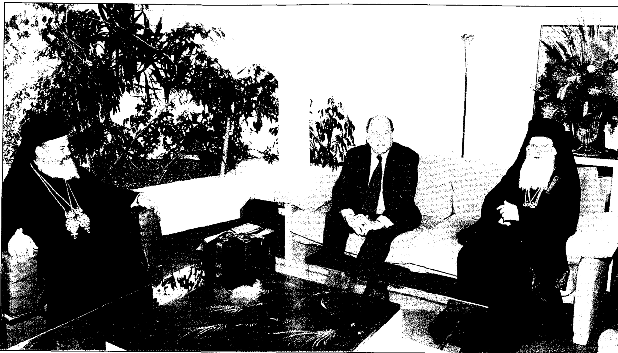
Άπό την επίσκεψη τής Α.Θ.Π. τοῦ Οἰκουμενικοῦ Πατριάρχου κ. Βαρθολομαίου συνοδευομένου ἀπὸ τὸν Μακ. Ἀρχιεπίσκοπο Ἀθηνῶν καὶ πάσης Ἑλλάδος κ. Χριστόδουλο στὸ Ὑπουργεῖο Ἐθν. Παιδείας καὶ Θρησκευμάτων, ὅπου συνομιλοῦν μὲ τὸν Ὑπουργὸ κ. Γεράσιμο Ἀρσένη.