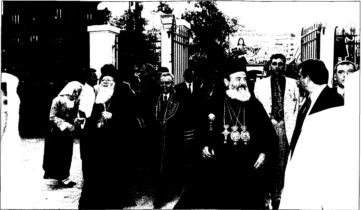
Οί Προκαθήμενοι τών δύο Ἐκκλησιῶν Παναγ. κ. Βαρθολομαῖος καί Μακ. κ. Χριστόδουλος προσέρχονται στό Οἰκονομικό Πανεπιστήμιο συνοδευόμενοι ἀπό τόν Πρύτανη.

ρεασμένοι ἀπό τίς ιδέες του Adam Smith, οἱ οἰκονομολόγοι ἄρχισαν ἀπό τήν προκλασική ἐποχή νά ὀραματίζονται ἕναν κόσμο μέ δικαιοσύνη, μιᾶ κοινωνία μέ ἀνθρώπινο πρόσωπο. Ὡς ἀποτέλεσμα τῆς προσπάθειας αὐτῆς ἀναπτύχθηκε ἕνας ὀλόκληρος κλάδος τῆς οἰκονομικῆς ἐπιστήμης πού σήμερα εἶναι γνωστός ὡς Δεοντολογική Οἰκονομική (Normative Economics) σέ ἀντιδιαστολή πρὸς τήν Θετική Οἰκονομική (Positive Economics). Πρόκειται γιά τόν κλάδο τῶν οἰκονομικῶν πού ἀσχολεῖται μέ τή δικαιοτέρα κατανομή τοῦ εἰσοδήματος, μέ τή δικαιοσύνη στίς οἰκονομικές συναλλαγές, μέ τήν ἀπόρριψη τῆς ὑπερκατανάλωσης καί μέ τήν προστασία τοῦ περιβάλλοντος.