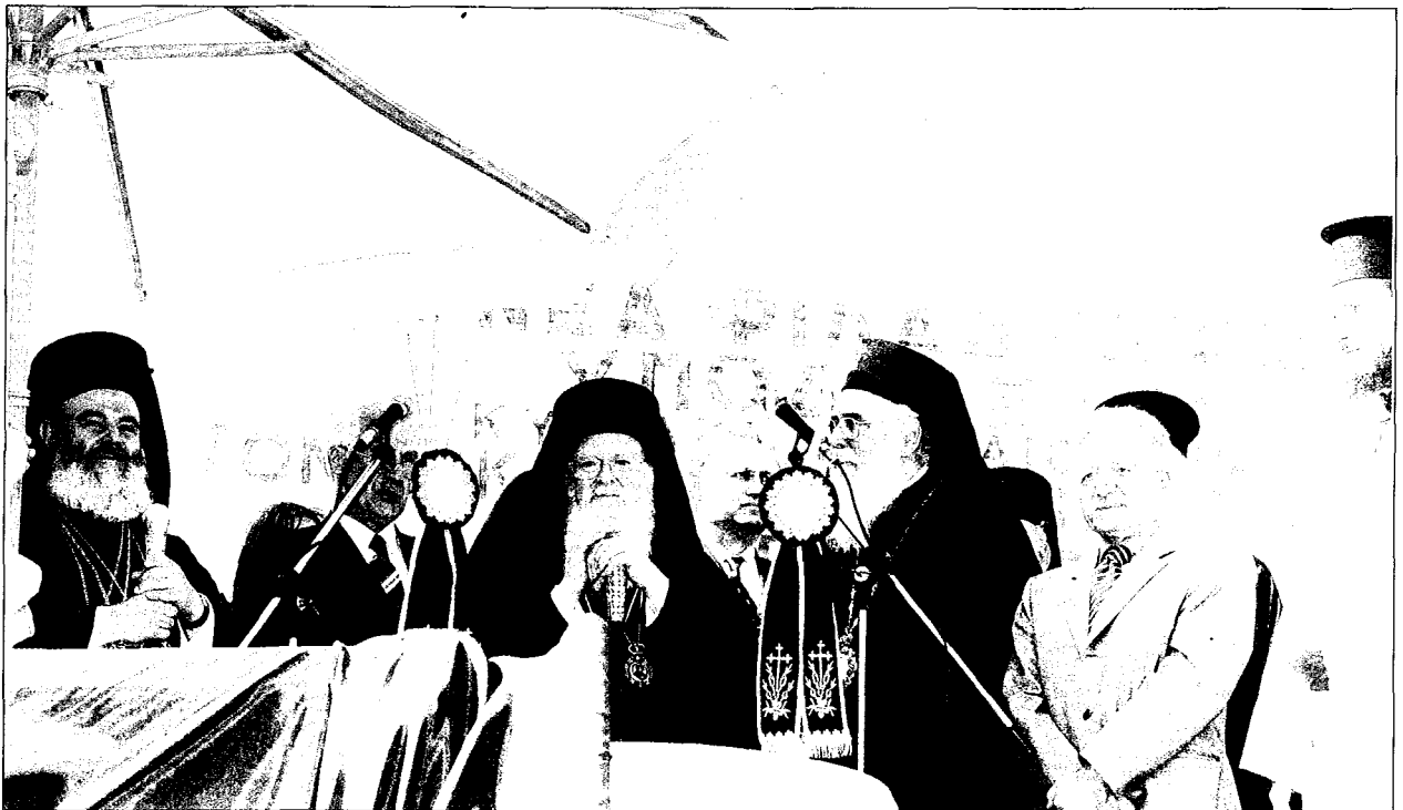
Ἡ Α.Θ.Π. ὁ Οἰκουμενικὸς Πατριάρχης κ. Βαρθολομαῖος εὐλογεῖ τὴν ἔναρξη τῶν ἐργασιῶν ἀναπτύξεως τοῦ Πολιτιστικοῦ Ἰδρύματος Ἑλληνισμοῦ τῆς Διασπορᾶς τοῦ Δήμου Νέας Φιλαδελφείας. Λιακρύνονται ὁ Μακ. Ἀρχιεπίσκοπος Ἀθηνῶν καὶ πάσης Ἑλλάδος κ. Χριστόδουλος, ὁ Σεβ. Μητροπολίτης Νέας Ἰωνίας καὶ Φιλαδελφείας κ. Κωνσταντῖνος, οἱ Ὑπουργοὶ κ. Κ. Γεῖτονας καὶ Γρ. Νιώτης καὶ ὁ Δήμαρχος Νέας Φιλαδελφείας.