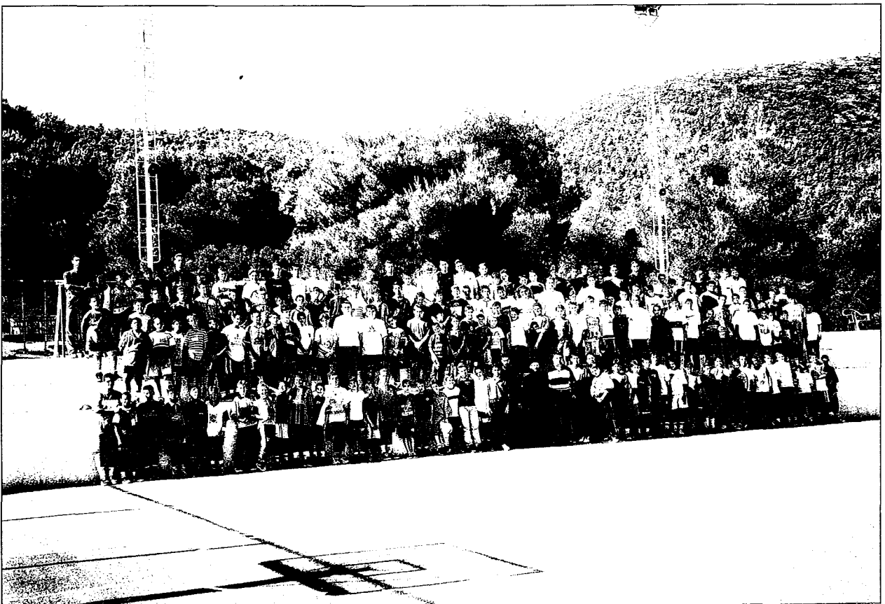
Άναμνηστική φωτογραφία μας από τις τέσσερις περιόδους των κατασκηνώσεων της Ίεράς Μητροπόλεως Νικαίας.

Κεντρικό θέμα του συνεδρίου που πραγματοποιήθηκε κατά τη διάρκεια της κατασκηνώσεως ήταν: «Άνθρώπινες σχέσεις σήμερα» και γύρω από αυτό έγιναν 3 εισηγήσεις, ομάδες εργασίας και συζητήσεις. Παράλληλα λειτουργή-