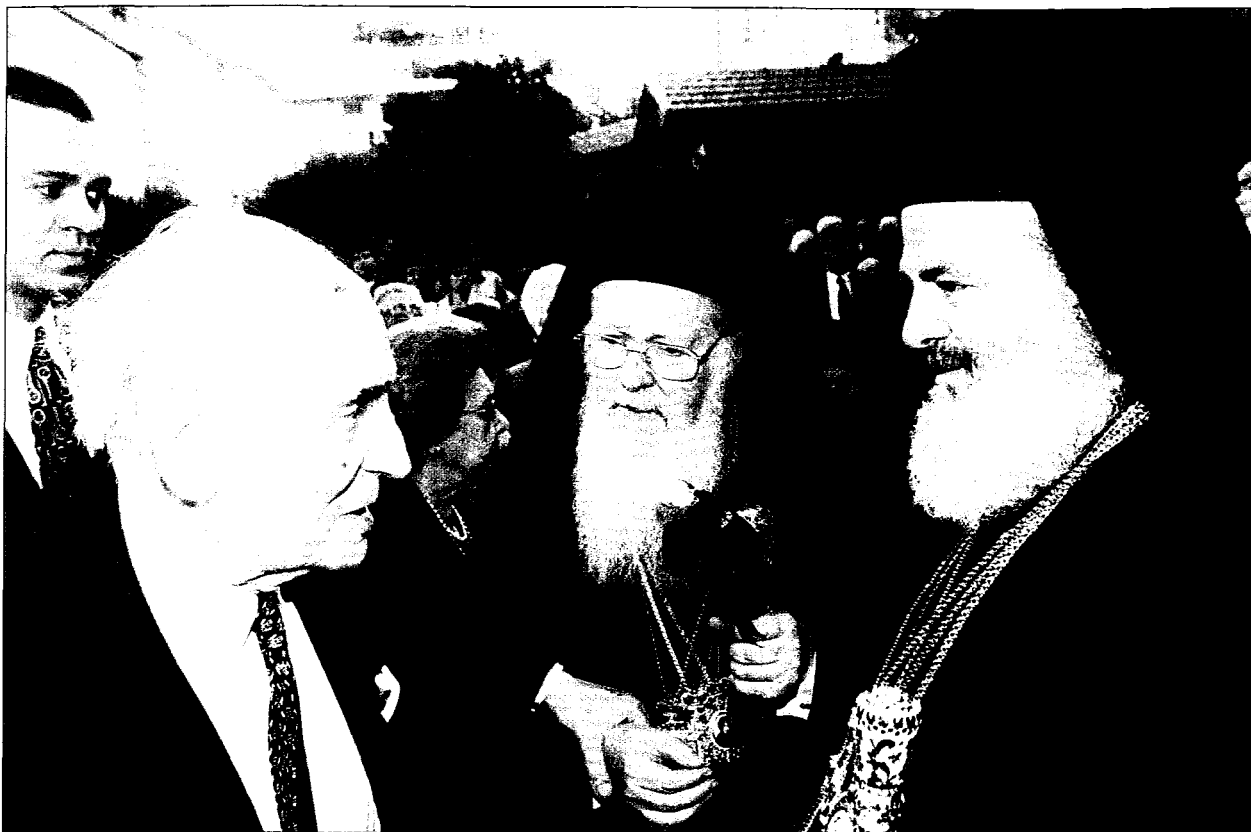
Ο Παναγ. κ. Βαρθολομαΐος και ο Μακ. κ. Χριστόδουλος με τον Μεγάλο Λογοθέτη - Μεγάλο Εδεργέτη του Οικουμενικού Πατριαρχείου κ. Παναγιώτη Άγγελόπουλο, κατά τη διάρκεια της επίσημης επίσκεψης της Α.Θ.Π. στην Αθήνα.

τάβαση από τη βιομηχανική κοινωνία που για 300 περίπου χρόνια έζησε ο κόσμος, στην κοινωνία της γνώσης και της πληροφόρησης, όπου κυρίαρχος συντελεστής δημιουργίας πλούτου θα είναι το ανθρώπινο διανοητικό κεφάλαιο. Η εξέλιξη αυτή θα οδηγήσει σε έναν έντελως διαφορετικό πολιτισμό που θα αποτελεί και τη μεγάλη κληρονομιά του 20ού προς τον 21ον αιώνα.