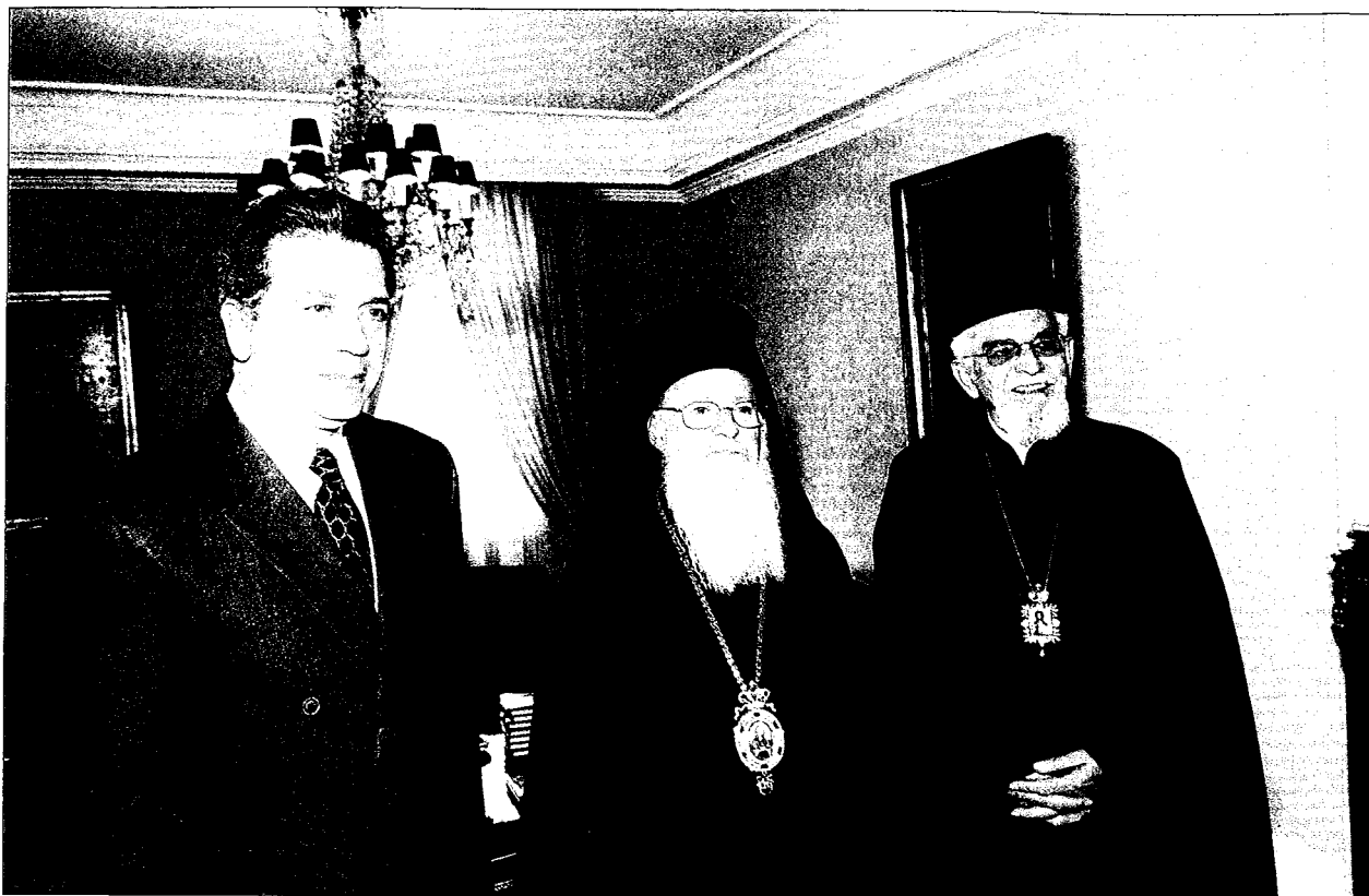
Ο Παναγιώτατος με τόν Δήμαρχο Ἀθηναίων κ. Δημήτρη Α. Ἀβραμόπουλο. Δίπλα τους ὁ Σεβ. Μητροπολίτης Γέρον Ἐφέσου κ. Χρυσόστομος.