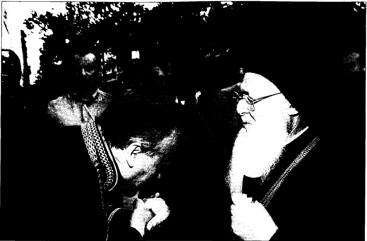
Ο Πρύτανης του Οικονομικού Πανεπιστημίου υποδέχεται τον Οικουμενικό Πατριάρχη στο ανώτατο εκπαιδευτικό ίδρυμα.

τεχνολογική πρόοδος θα οδηγούσε από μόνη της στην κοινωνική δικαιοσύνη και στην ανθρώπινη ευτυχία, δεν επιβεβαιώνεται από τα πραγματικά δεδομένα της ζωής. Παρόμοιες αντιλήψεις οδήγησαν τον άνθρωπο να φανταστεί τον éαντό του ως τó κέντρο του σύμπαντος, γεγονός που τον έκανε να πιστεύσει ότι θα φέρει τον κόσμο στα δικά του μέτρα. Τήν προοπτική όμως αυτή έρχεται να ανατρέψει ή σκέψη του θανάτου που κάνει τή ζωή που στηρίζεται στην ύλη ιδιαίτερα βασανιστική. Τó αδιέξοδο που δημιουργείται μεγαλώνει καθώς βελτιώνεται τó επίπεδο ύλικής ευημερίας του ανθρώπου γιατί συνειδητοποιεί πώς σε éλάχιστες στιγμές τó ώραίο οικόδομημα που με τόση έπιμέλεια και τόση αυταρέσκεια είχε κατασκευάσει θα καταρρεύσει ως γνάβινος πύργος και μαζί του όλόκληρο τó σύμπαν. Η λύση στο αδιέξοδο που εμφανίζεται δεν μπορεί να δοθεί με ύλικά μέσα. Αυτή πρέπει να αναζητηθεί στις ρίζες της ζωής, δηλαδή, στις πηγές της χριστιανικής θρησκείας