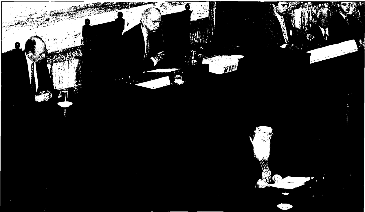
Η Α.Θ.Π. ο Οικουμενικός Πατριάρχης κ. Βαρθολομαῖος ἀπευθύνεται στην Όλομέλεια τῆς Βουλῆς.

ὁ Ἕλληνικός Λαὸς εἰς τὸ σύνολόν του γνωρίζει ὅτι ἡ ὀρθή κατανόησις καὶ βίωσις τοῦ Εὐαγγελίου προάγει πολλαπλῶς τὴν εὐημερίαν αὐτοῦ καὶ ὅλον τοῦ κόσμου. Γνωρίζει τὴν ἀναγεννητικὴν δύναμιν τοῦ καινοφανοῦς καὶ ἐπὶ δύο χιλιάδας ἔτη διατηροῦντος ἀκμαίαν τὴν νεότητα αὐτοῦ κηρύγματος τῆς Ὁρθοδόξου Ἐκκλησίας, ὅτι ἡ ἔξοδος ἀπὸ τοῦ Ἐγὼ καὶ ἡ μετὰ φιλότητος στροφὴ πρὸς τὸ Σύ, “μὴ τὰ ἑαυτῶν ἕκαστος σκοπεῖτε, ἀλλὰ καὶ τὰ ἑτέρων ἕκαστος” (Φιλ. 2, 4), ἀποτελεῖ βασικὴν προϋπόθεσιν τῆς εἰρηνικῆς συννυπόρξεως καὶ τῆς ἐπωφελοῦς συνεργασίας τῶν ἀνθρώπων. Τοῦτο ἄλλωστε γνωρίζουν ὅλοι οἱ συναλλασσόμενοι, διότι ἂν δὲν εἶναι μία σύμβασις ἐπωφελῆς διὰ ἀμφοτέρα τὰ μέρη δὲν καταρτίζεται. Τὸ πρόβλημα ἔγκειται εἰς τὴν μεταφορὰν αὐτῆς τῆς ἀυτονομήτου διὰ τὸν ἰδιωτικὸν βίον ἀρχῆς εἰς τὰς διεθνεῖς σχέσεις, ὅπου ἀτυχῶς ἡ πρωτόγονος ὁρμὴ τῆς ἐπιβολῆς τῆς θελήσεως τοῦ ἑνὸς ἐπὶ τοῦ ἄλλου δὲν ἔχει εἰσέτι ἐπαρκῶς ὑποχωρήσει πρὸ τῆς χριστιανικῆς καὶ ἀνωτέρας πολιτισμικῶς ἀρχῆς τῆς διὰ συνεννοήσεως ἐξευρέσεως κοινῶς ἀποδεκτῶν καὶ συμφεροῦσῶν λύσεων.