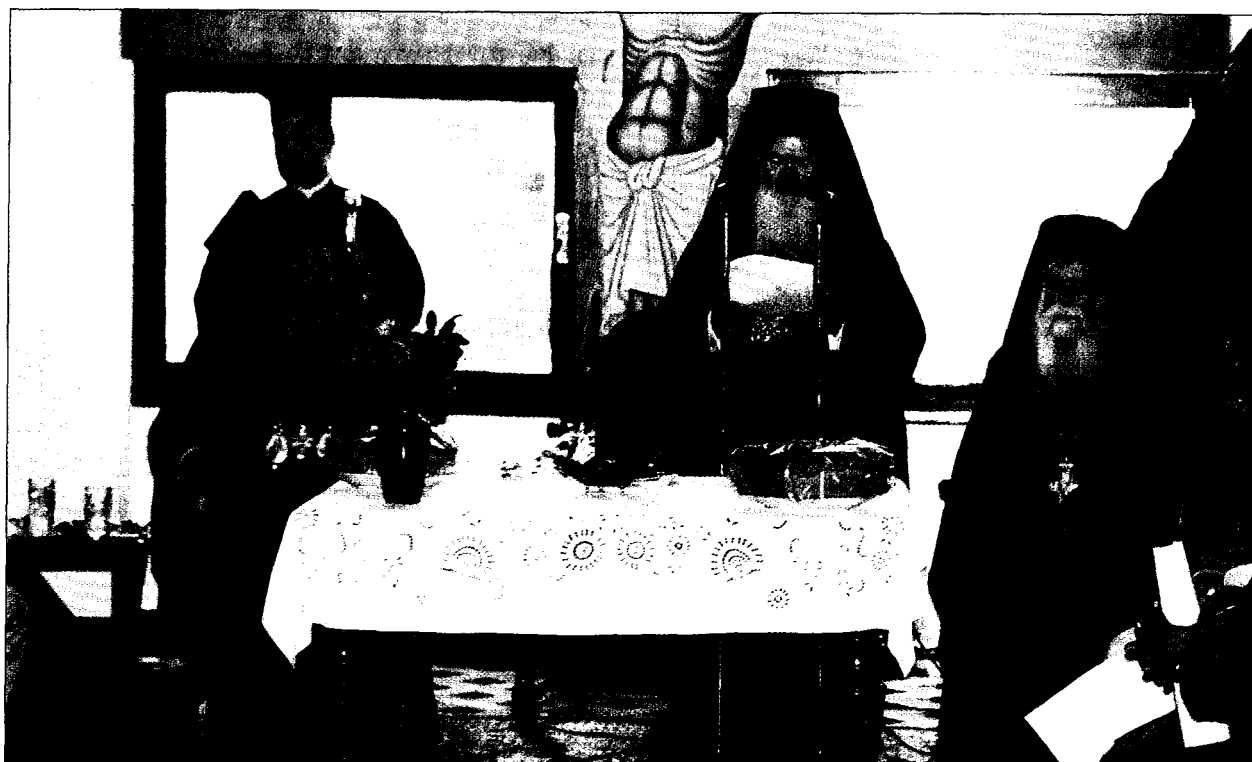
Ὁ Παναγιώτατος κ. Βαρθολομαῖος μέ τόν Μακ. κ. Χριστόδουλο καί τόν Παν. Ἀρχιμ. Δαμασκηνό Κατρακούλη, Καθηγούμενο, στήν Ἱ. Μονή Ἁγ. Παρασκευῆς Μαζίου.