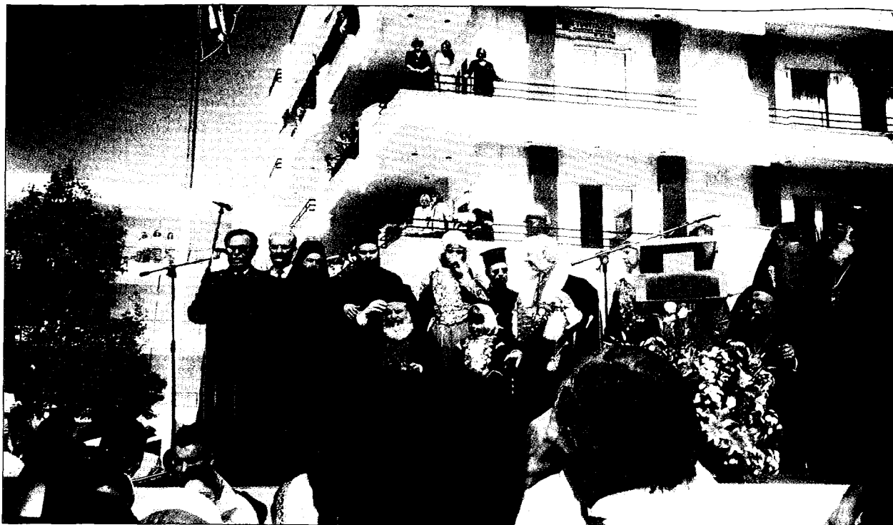
Άπό τήν ύποδοχή τοῦ Πατριάρχη Βαρθολομαίου στά Μέγαρα.