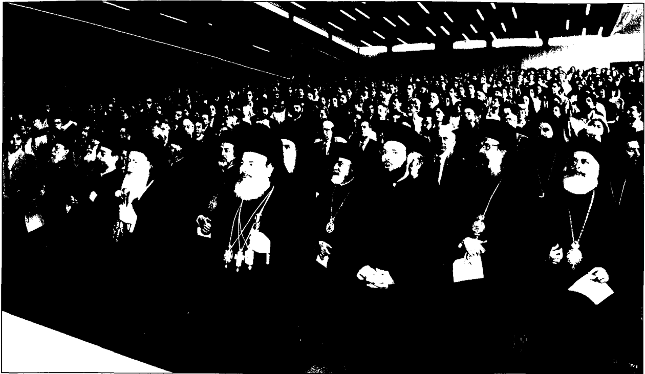
Οἱ δύο Προκαθήμενοι στό κατάμεστο ἀμφιθέατρο τῆς Θεολογικῆς Σχολῆς τοῦ Πανεπιστημίου Ἀθηνῶν (Φωτ. Ἀδελφῶν Ἀναγνωστόπουλων).

ἐπὶ τοῦ Θρόνου τῆς Βασιλευούσης τῆς Ὁρθοδοξίας καὶ τοῦ Ἔθνους αἶρει τὴν βαρεῖαν παρακαταθήκην τῆς Πρωτοθρόνου Ἐκκλησίας, «τὴν μέριμναν πασῶν τῶν ἐκκλησιῶν» (Β' Κορ. 11, 28), ἐπ' αὐτοῦ δὲ πρωτίστως καὶ ἰδιαζόντως οἱ χριστιανικοὶ αἰῶνες ἐναπέθεσαν τὴν διασφάλισιν ἀπαρασαλεύτου τῆς Ὁρθοδόξου πίστεως καὶ αὐτοσυνειδησίας, καὶ τὴν διατήρησιν ὡς ἀκομήτου κανδήλας τοῦ φωτός τῆς ἱεραῆς ἡμῶν Παραδόσεως. Ἡ καθ' ἡμᾶς Θεολογικὴ Σχολὴ ἔχει πλήρη συνειδησιν τῆς διὰ τῶν λόγων τούτων ἀμυδρῶς ἐκφραζομένης πραγματικότητος, πάντες δὲ οἱ ἐν αὐτῇ διακονοῦντες ἔταξαν ἑαυτοὺς εἰς τὴν μεταλαμπάδυσιν τῶν ἀξιῶν καὶ βιωμάτων τούτων εἰς τὸ τμήμα ἐκεῖνο τῆς χρυσοῦς νεολαίας τῆς Πατρίδος, τὸ ὁποῖον κατὰ ἑκατοντάδας καὶ χιλιάδας πνικνώνει τὰς τάξεις τῆς.