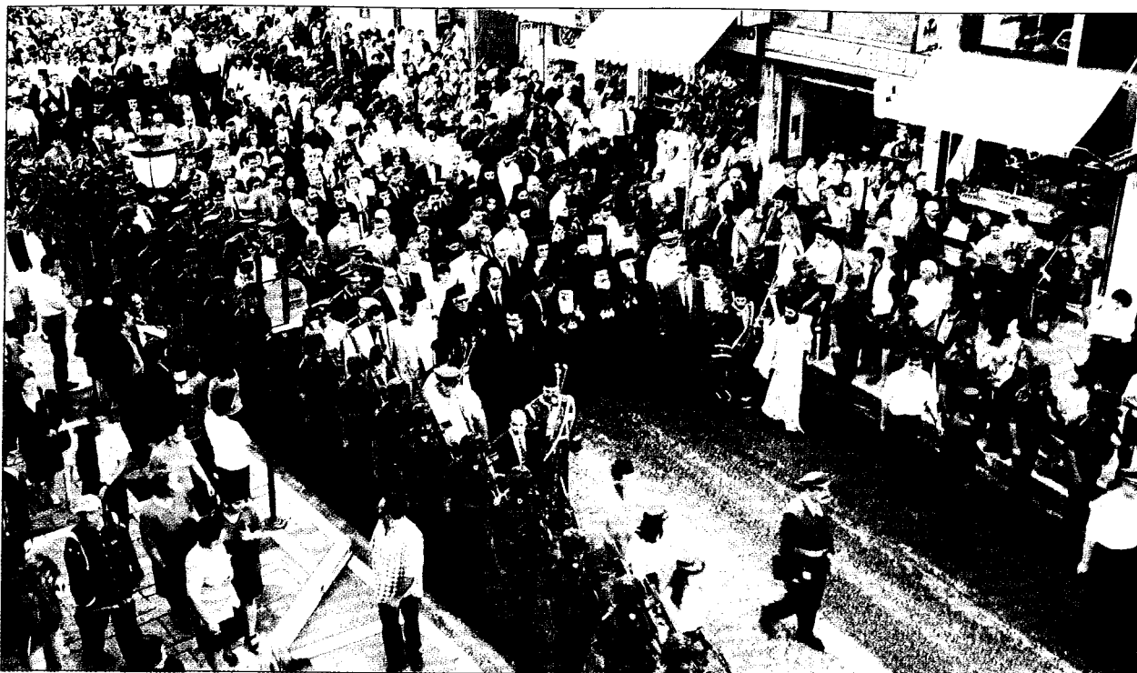
Κλήρος και λαός, οι τοπικές Αρχές και πλήθος λαού υποδέχεται τόν Οικουμενικό Πατριάρχη στά Ίωάννινα.