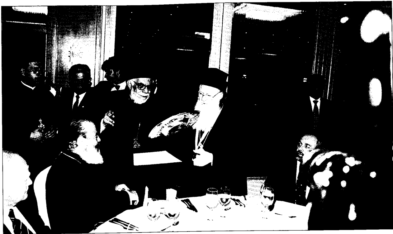
Κατά τὸ ἐπίσημο γεῦμα ὁ Σεβ. Μητροπολίτης Ἰωαννίνων κ. Θεόκλητος προσφέρει γιαννιώτικο ἀσημένιο δίσκο στὸν Πατριάρχη.