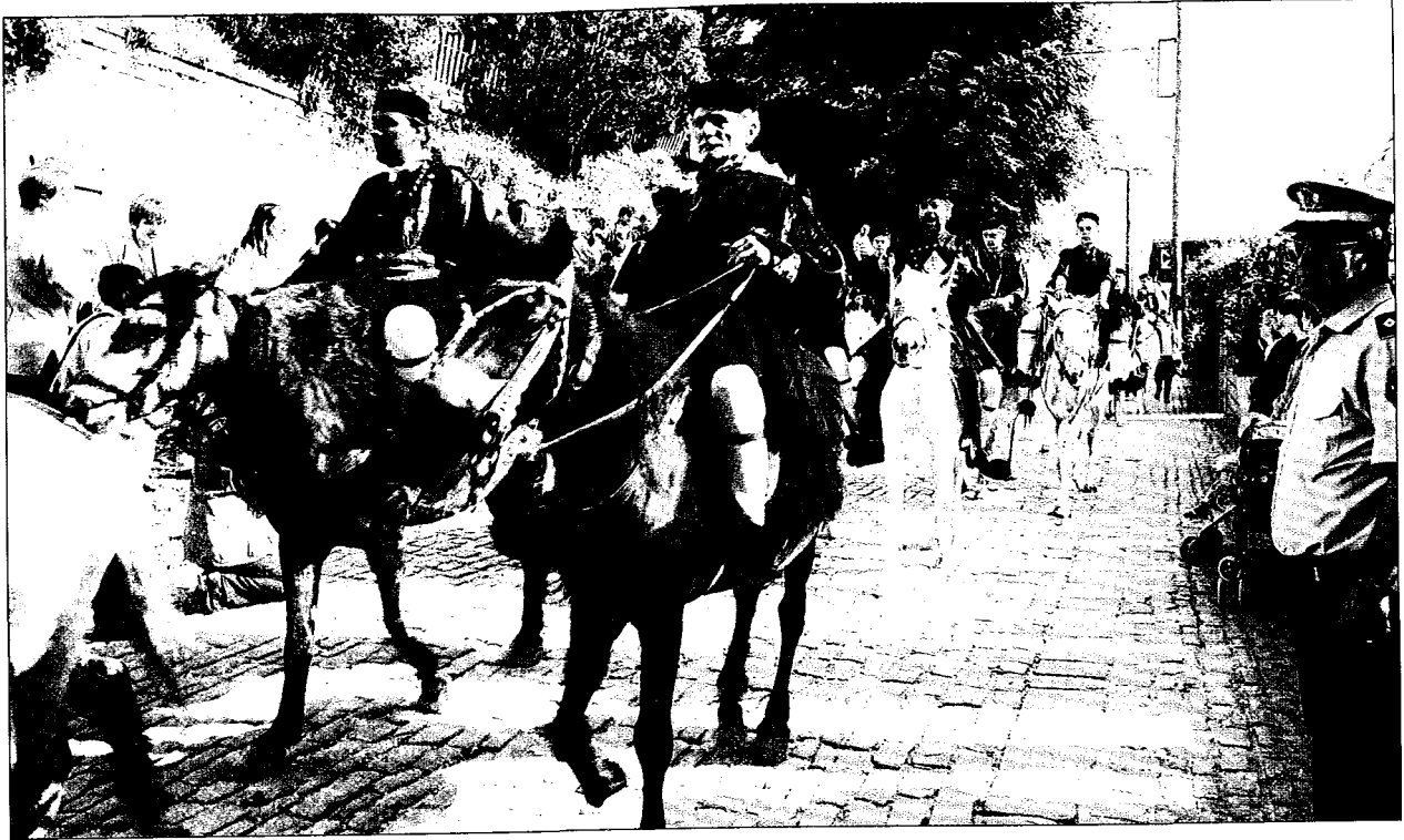
Καβαλαραῖοι Μετσοβίτες προπορεύονται κατά τὴν ὑποδοχὴ τοῦ Πατριάρχου.