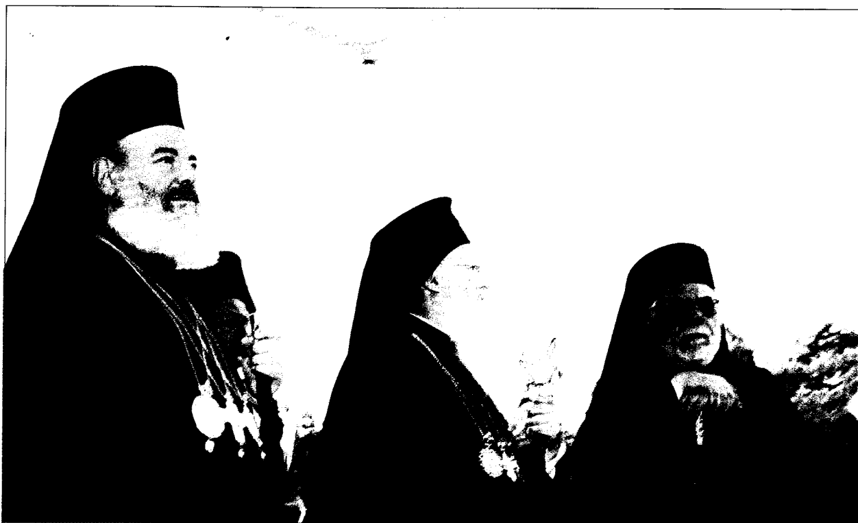
Ή Α.Θ. Παναγιότης ό Πατριάρχης μας, με τόν Μακ. Αρχιεπίσκοπο και τόν οικείο Ιεράρχη κ. Θεόκλητο πάνω στήν ειδική εξέδρα.