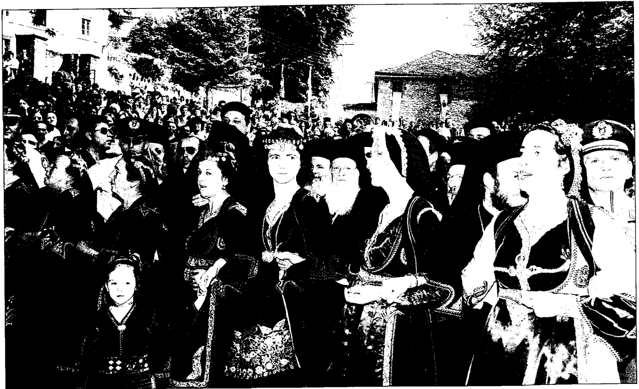
Νεάνιδες καὶ γυναῖκες τοῦ Μετσόβου μὲ παραδοσιακὲς φορεσιὲς χορεύουν στὴν κεντρικὴ πλατεία πρὸς τιμὴν τῶν Ὑψηλῶν Ἐπισκεπτῶν.