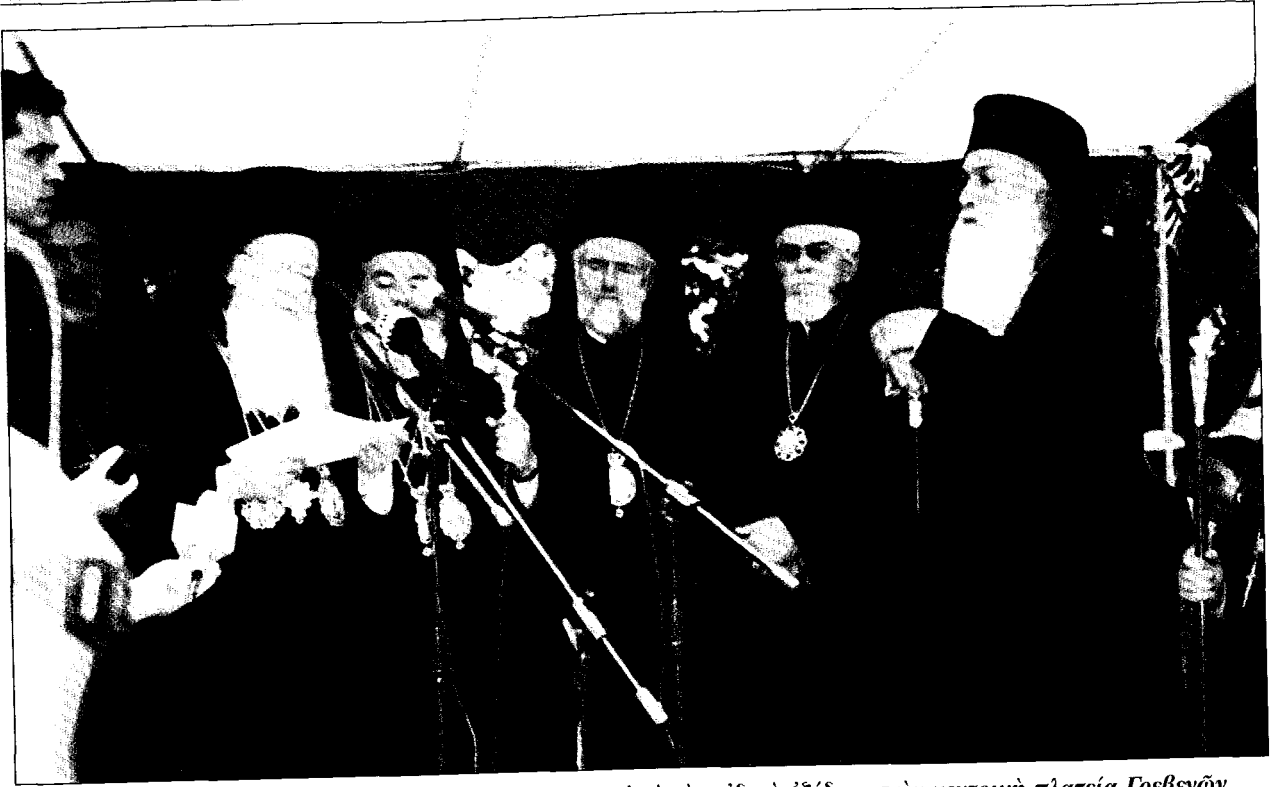
Ό Πατριάρχης εκφωνεί την εμπνευσμένη όμιλία του από την ειδική εξέδρα, στην κεντρική πλατεία Γρεβενών.