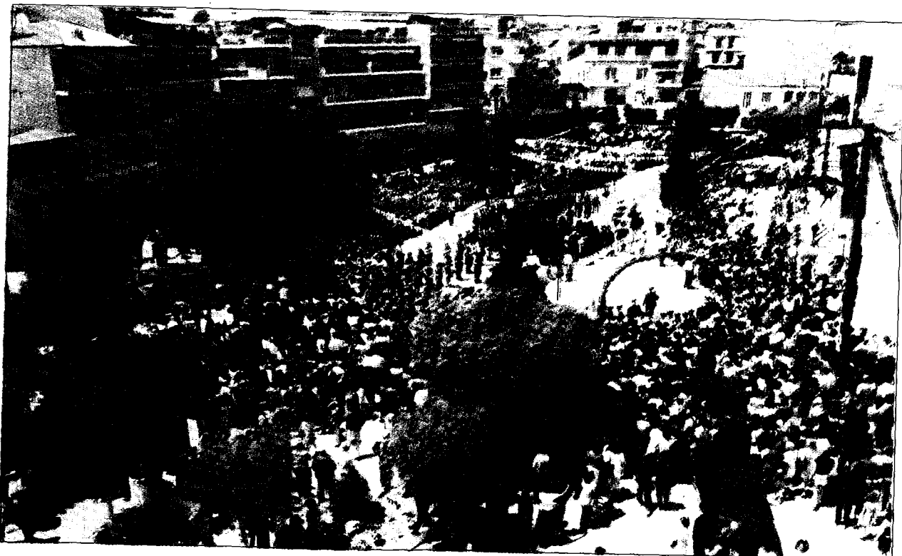
Στὴν κεντρικὴ πλατεία Αἰμιλιανοῦ κληρῶς, λαὸς καὶ τιμητικὸ στρατιωτικὸ ἄγημα, ὑποδέχθησαν τοὺς Ὑψηλοὺς Ἐπισκέπτες μας.