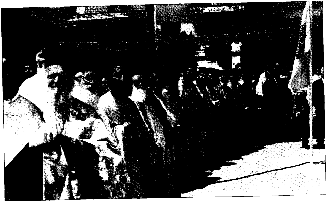
Ό ιερός κλήρος, σε παράταξη, αναμένει τον Πατριάρχη και τον Αρχιεπίσκοπο προδ του μητροπολιτικού ναού Γρεβενών για την επίσημη Δοξολογία.