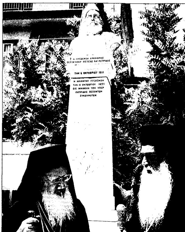
Τό παρελθόν και τό παρόν του Γένους. Έμπρός στην προτομή του Έθνομάρτυρος Μητροπολίτου Γρεβενών Αιμιλιανού. Η Α.Θ.Π. με τόν Σεβ. Μητροπολίτη Γρεβενών Σέργιο.