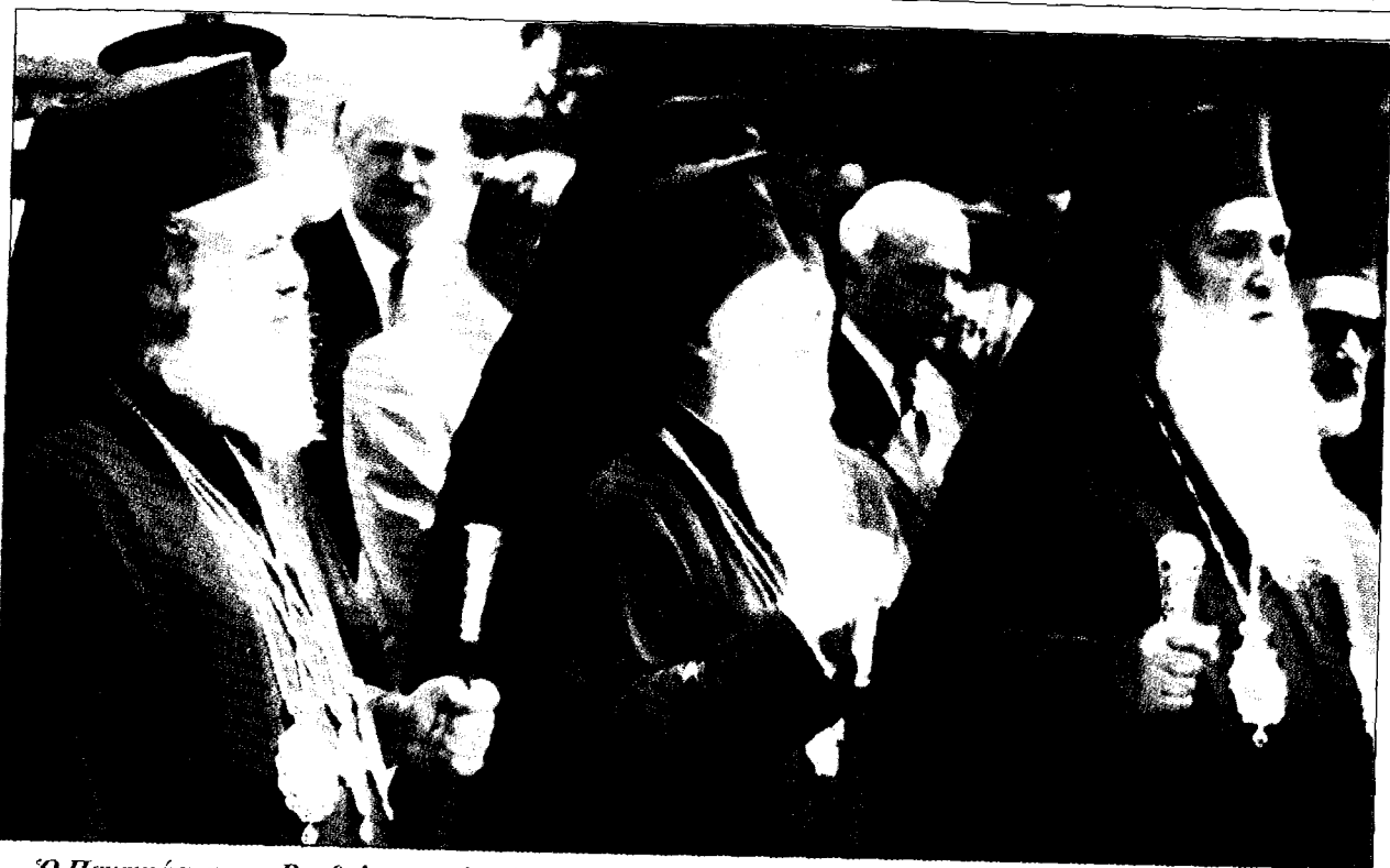
Ο Παναγιώτατος κ. Βαρθολομαῖος ἐν μέσῳ τοῦ Ἀρχιεπισκόπου Ἀθηνῶν κ. Χριστοδούλου καὶ τοῦ Μητροπολίτου Γρεβενῶν κ. Σεργίου.