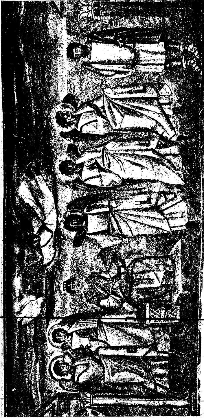
3. Ο Ευαγγελισμός της Θεοτόκου εικονιζομένης ως βασιλίσσης (ψηφιδωτόν τῆς ἐν Ρώμῃ βασιλικῆς τῆς S. Maria Maggiore τοῦ ἔτους 432).