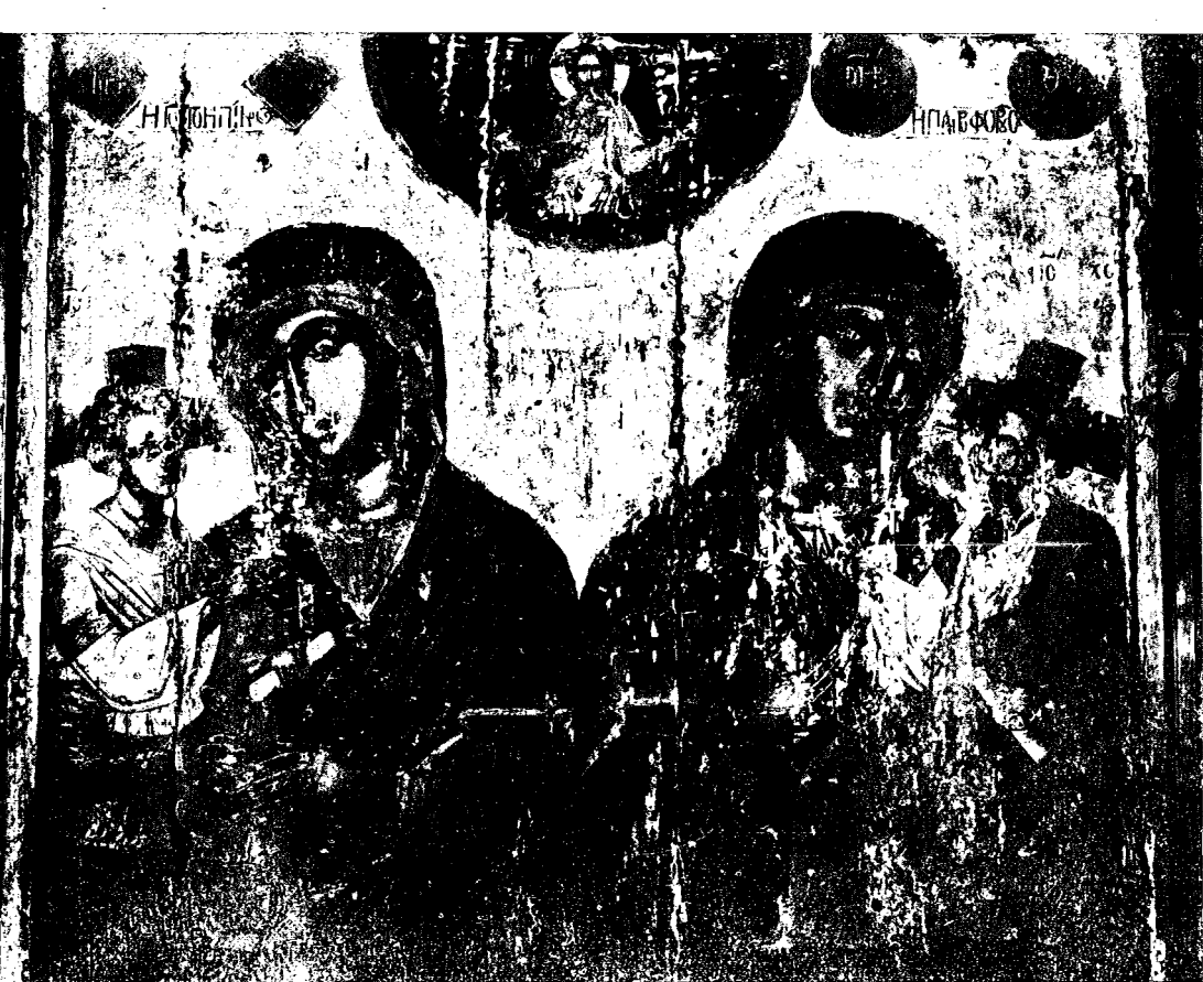
17. Εικών διδύμου Θεοτόκου (Γοργοπηκίδου και Πληροφορούσης) Κύπρου.