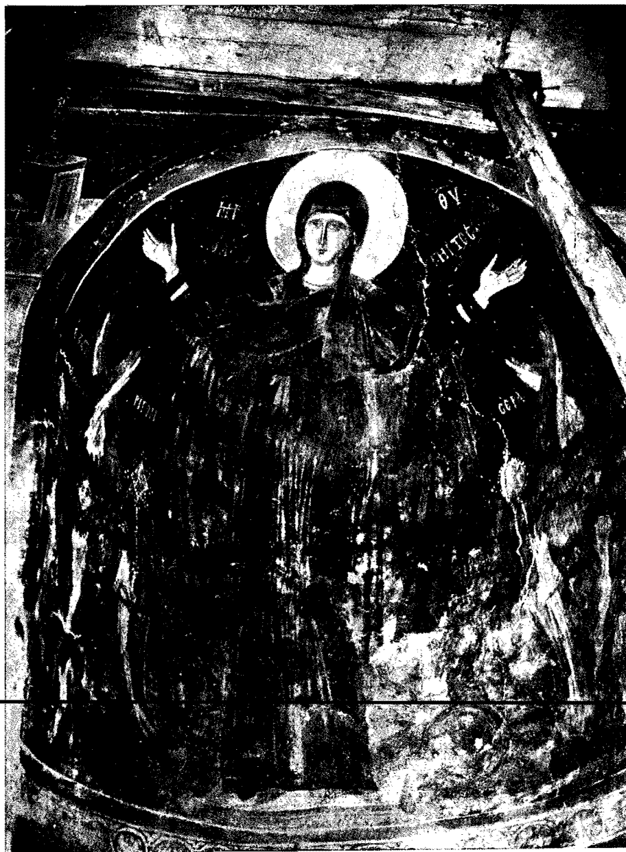
δ. Ἡ Θεοτόκος δεομένη μετὰ τῆς ἐπιγραφῆς «Ἡ Ἀχειροποίητος» (τοιχογραφία 14ου αἰ. τοῦ ναοῦ τοῦ ἁγ. Νικολάου τοῦ Κυρίτση ἐν Καστορίῳ).