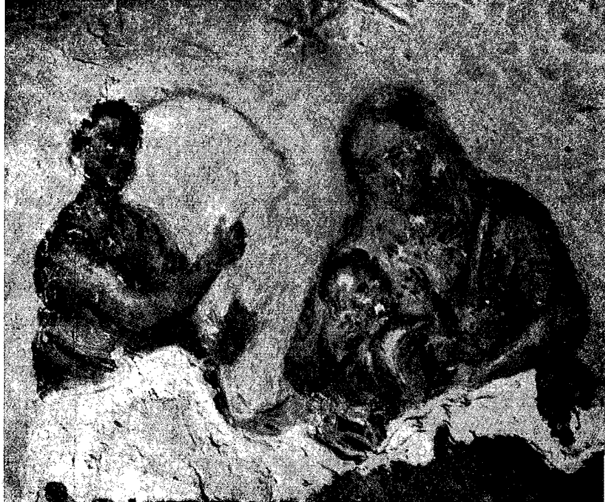
1. Ἡ Θεοτόκος μετὰ τοῦ Προφήτου Ἡσαίου (τ. ιχογραφία τῆς κατακόμβης τοῦ ἁγ. Καλλίστου Ρώμης).