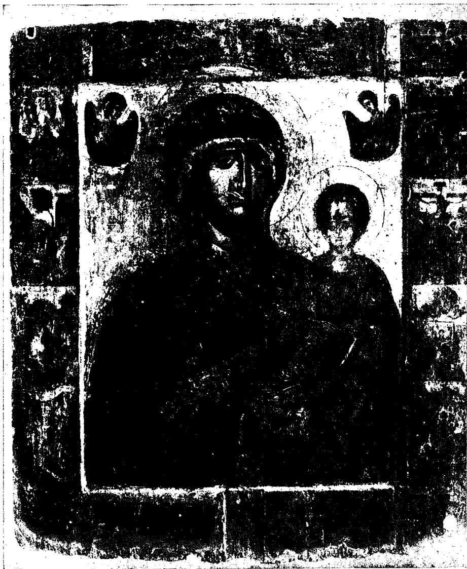
6. Εικόνη τῆς Θεοτόκου Ὁδηγήτριας 14ου αἰ. (εἰκόνη τοῦ Βυζαντινοῦ Μουσείου Ἀθηνῶν).