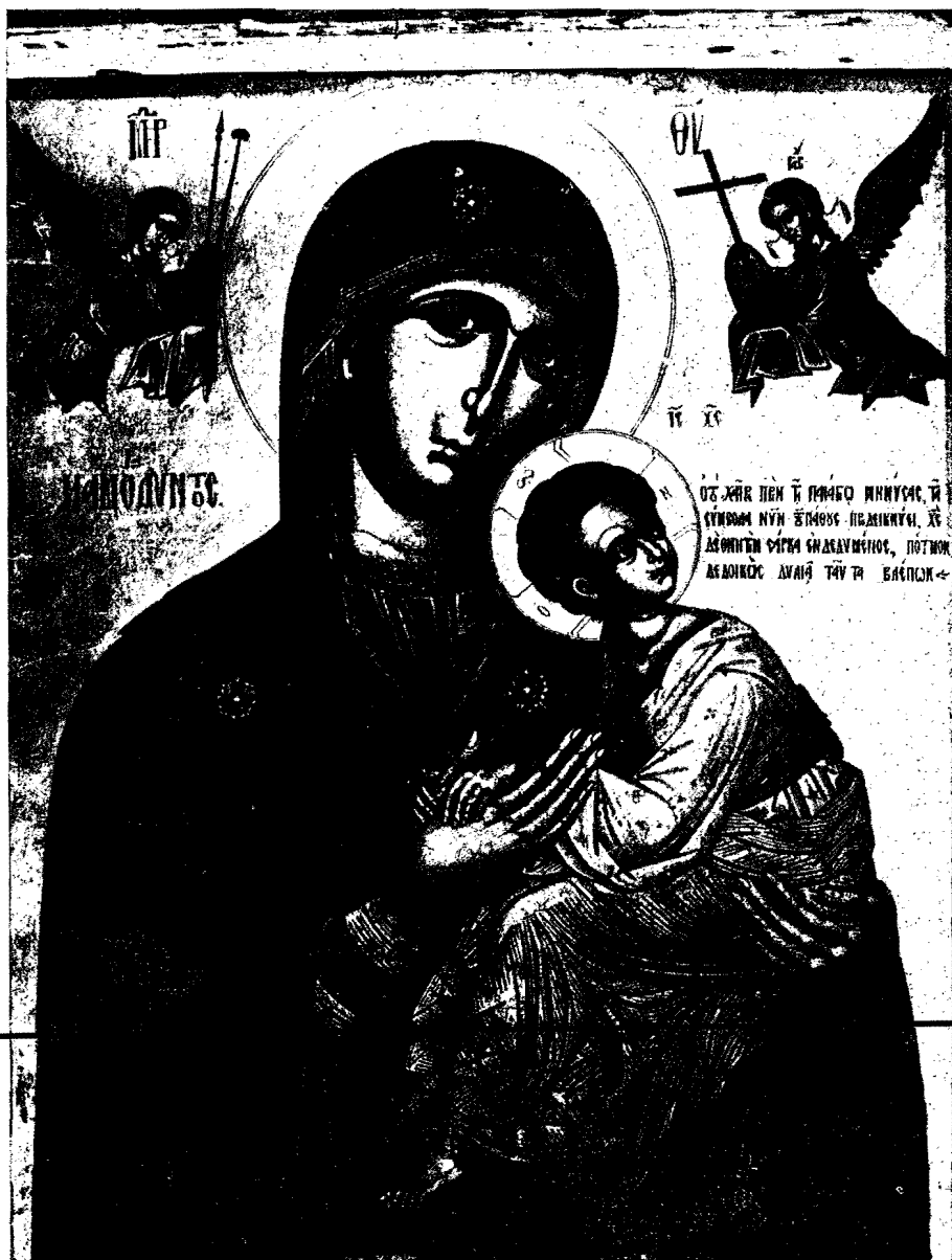
15. Εἰκὼν τῆς Θεοτόκου τοῦ Πάθους (ἢ Ἀμόλυντος) (εἰκὼν τῆς Μονῆς τοῦ Ὁρους Σινᾶ).