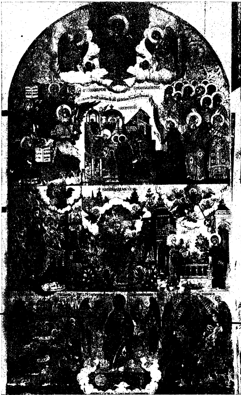
22. Εἰκὼν μετὰ τῆς ἐπιγραφῆς: «Ἐπὶ Σοὶ χάρις» (εἰκὼν τοῦ Βυζαντινοῦ Μουσείου).