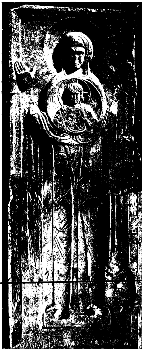
7. Ἀνάγλυφος εἰκὼν εἰς τύπον Βλαχερνίτιδος μετὰ τῆς ἐπιγραφῆς «Ἡ ἐπίσκεψις» (τοῦ ναοῦ τῆς Παναγίας Μαζουνιτίσσης).