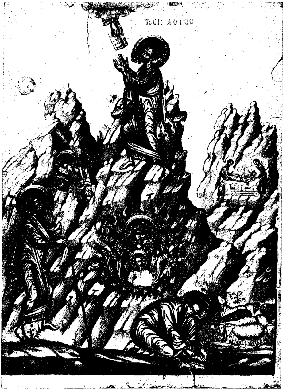
16. Εικόνη τῆς ἁγίας Βάτου (τῆς μονῆς τοῦ ὄρους Σινᾶ).