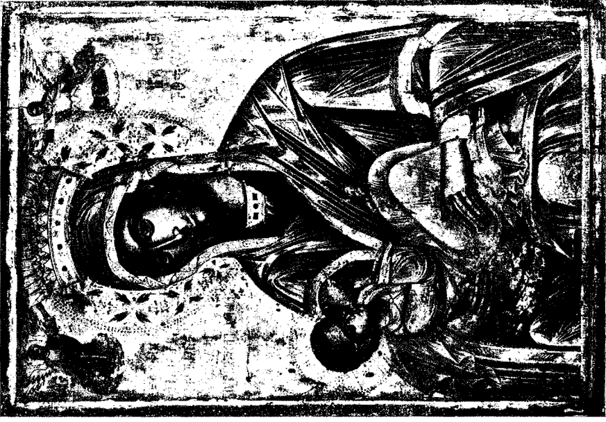
14. Εικών τῆς Θεοτόκου Γαλακτοτροφούσας (εἰκὼν Βυζαντινοῦ Μουσείου).