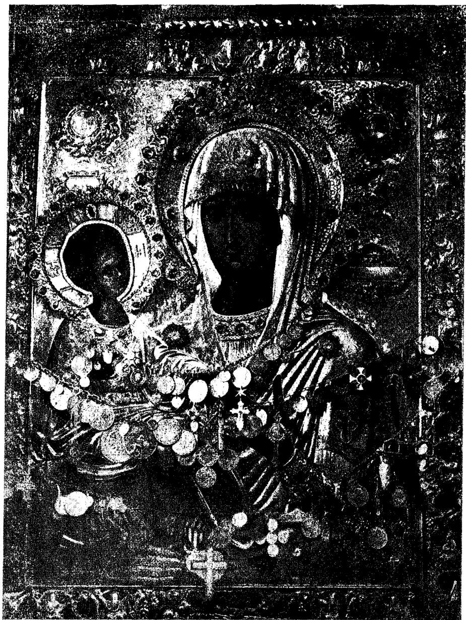
19. Ἡ θαυματουργὸς εἰκὼν τῆς Τριχερούσης τῆς μονῆς Χελανδαρίου τοῦ Ἁγίου Ὁρους.