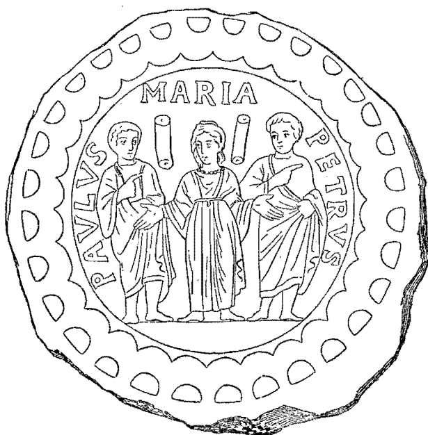
2. Ἡ Θεοτόκος ἐν τῷ μέσῳ τῶν ἀποστόλων Πέτρου καὶ Παύλου (εἰς πυθμένα ὑαλίνου δοχείου ἐκ τῶν εὑρεθέντων εἰς τὰς Κατακόμβας τῆς Ρώμης).