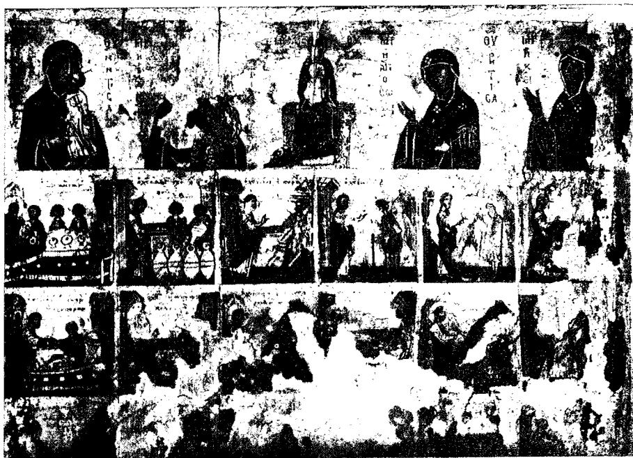
8. Εικόν 11-12 σι. τῆς Μονῆς Σινᾶ παριστῶσα ἄνωθεν τῶν θαυμάτων τοῦ Χριστοῦ 5 εἰκόνας τῆς Θεοτόκου (Βλαχερνίτισης, Ὁδηγητρίας, Πλατυτέρας, Ἁγιοσοριτίσης καὶ Χυμευτῆς).