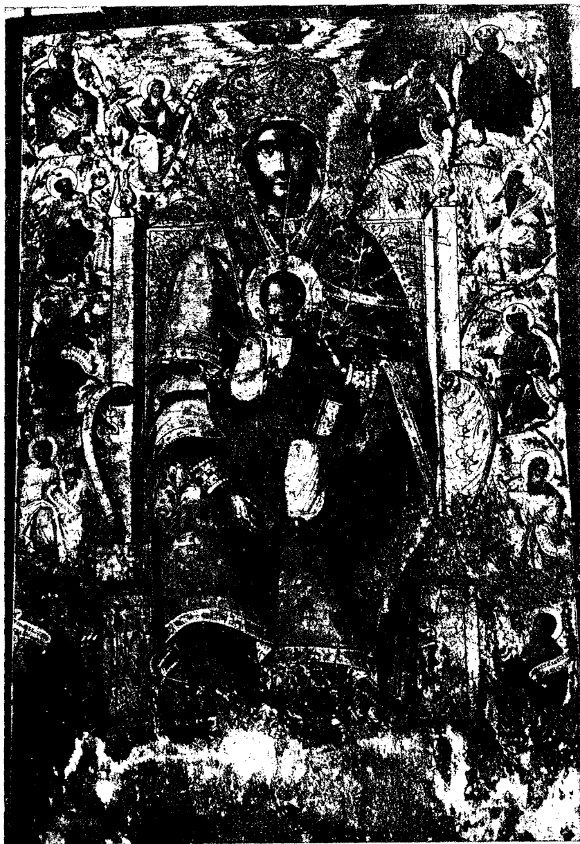
21. Εικών μετὰ τῆς ἐπιγραφῆς «Ἄνωθεν οἱ Προφῆται σὲ προκατήγγειλαν» (εἰκὼν τοῦ Βυζαντινοῦ Μουσείου).