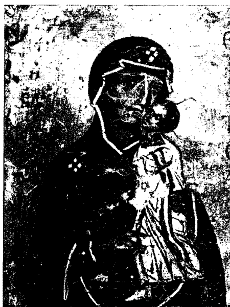
9. Λεπτομέρεια τῆς εἰκ. 8 (Ἡ Βλαχερνίτισσα, παλαιότερου τύπου)