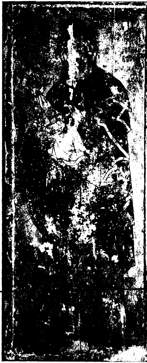
7α. Εἰκὼν τῆς Γεωργοσπηκίου (Ἀθηνιωτίσσης) (εἰκὼν τοῦ ναοῦ ἁγ. Γεωργίου ἐν παλαιῷ Καίρῳ).