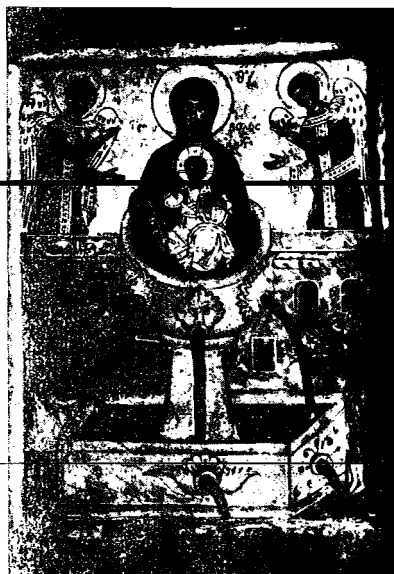
18. Εικών τῆς Ζωοδόχου Πηγῆς (Βυζαντινοῦ Μουσείου).