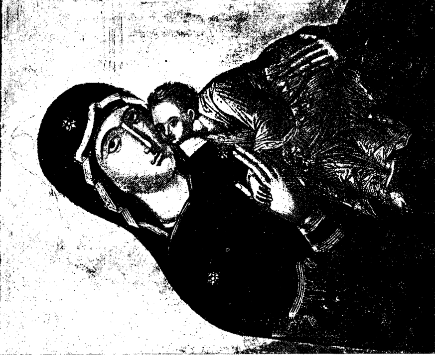
18. Εἰκὼν τῆς Θεοτόκου Γλυκοφιλοῦσας (εἰκὼν συλλογῆς Λαχάτσου).