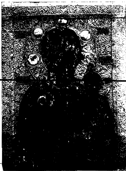
10-12. Αί παρατιθέμεναι εἰς τὴν ἑλληνικὴν Ὀρθόδοξον Ἐκκλησίαν ὡς εἰ- κόνες τοῦ Ἐθαγγελιστοῦ Λουκά (10 Μεγασπηλαιώτισσα, 11 Κυκλάωτισσα Κύπρου, 12 Σουμελιώτισσα Τραπεζούντος).