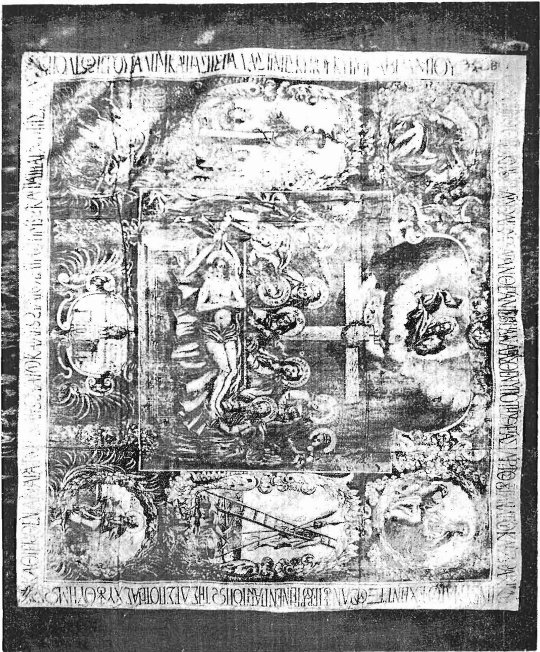
Είχ. 1. 'Αντιμήνοιον καθαγιασθέν υπό τοῦ Πατριάρχου 'Ιεροσολύμων 'Αβραμίου.