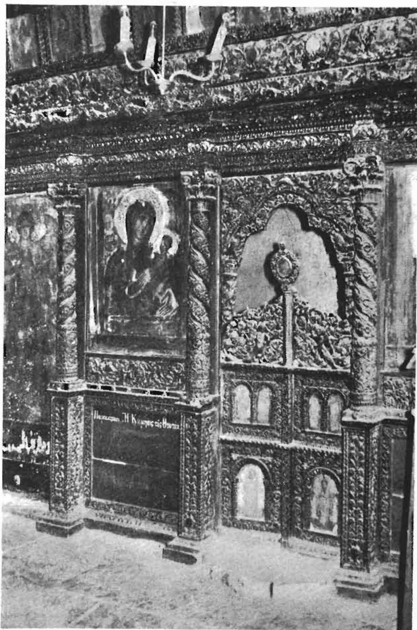
Εικ. 3. Τὸ ξυλόγλυπτον τέμπλον τοῦ Παρεκκλησίου Κοιμήσεως τῆς Θεοτόκου τοῦ Ἱ. Ναοῦ Προφήτου Ἡλίου Χρυσουπόλεως