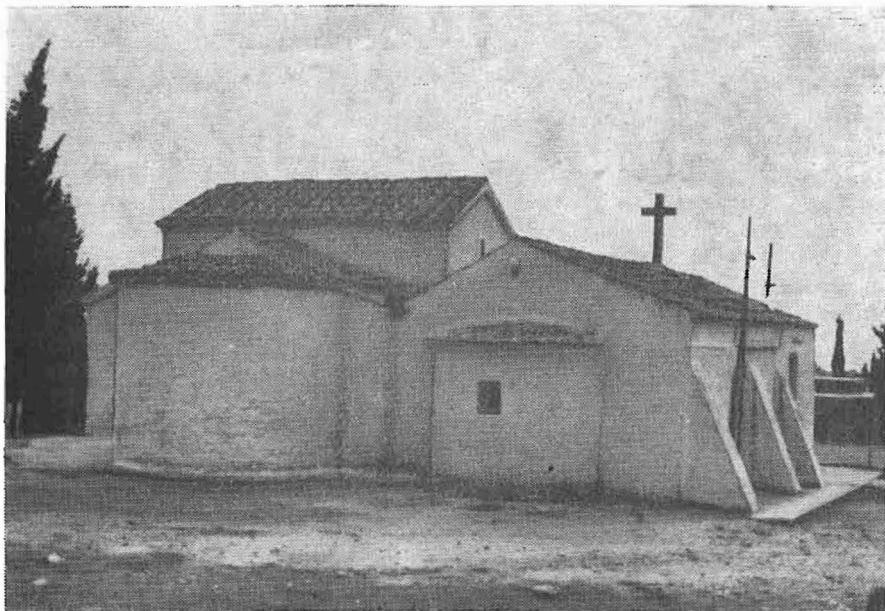
Εἰκ. 3. Ἡ ἀνατολική πλευρά τοῦ ναοῦ.