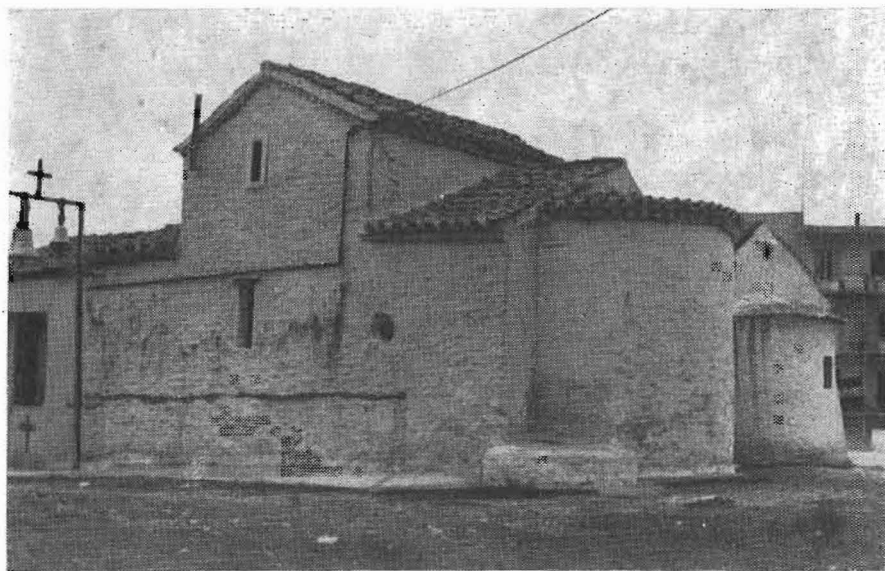
Εἰκ. 1. Ἡ νοτιοανατολικὴ πλευρὰ τοῦ ναοῦ.

Ἡ τοιχοποιία τοῦ ἐξεταζομένου ναυδρίου εἰς τὴν ἀρχικὴν του μορφήν, ἀποτελεῖται ἐξ ἀργῶν λίθων, ἡ μοναδικὴ δὲ ἐξωτερικῶς διακόσμησίς του εἶναι μία ὀδοντωτὴ ταινία κάτωθι τῆς κεραμώσεώς του (Εἰκὼν 1η).