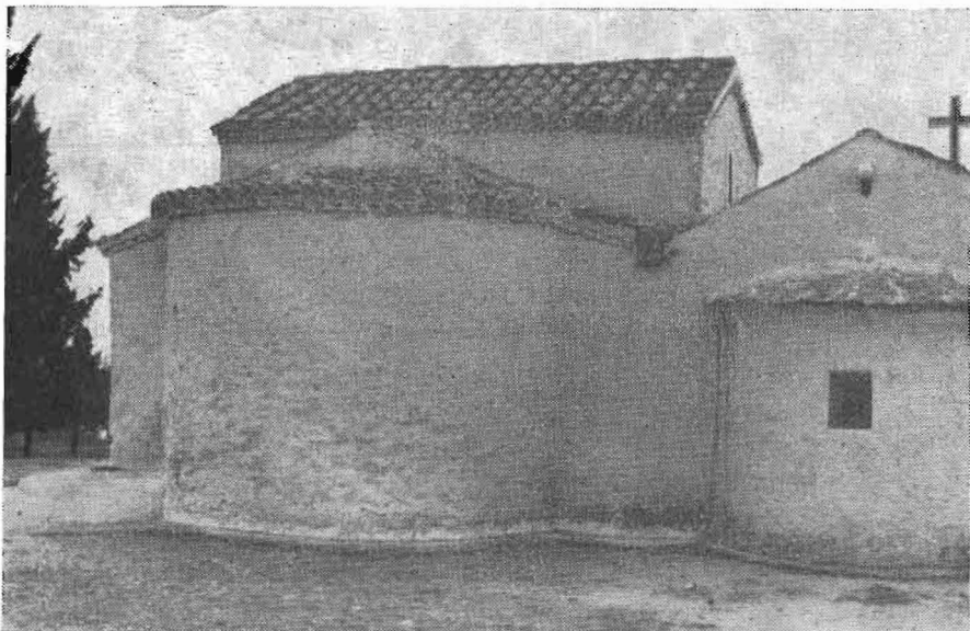
Εἰκ. 2. Ἡ ἀνατολική πλευρά τοῦ ναοῦ.