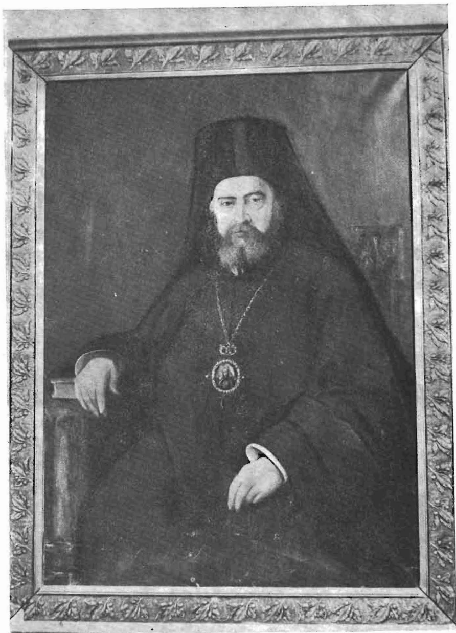
Πίν. 7. Ἀγαθάγγελος Κωνσταντινίδης, Μητροπολίτης Ἐφέσου. Μ. Συνοδικὸν Ἱ. Θεολ. Σχολῆς Χάλκης.