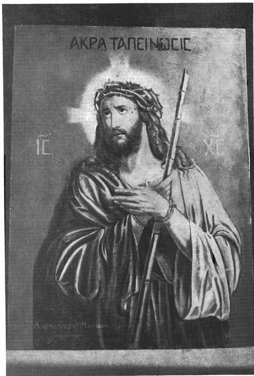
Πίν. 5. Ἡ Ἄκρα Ταπείνωσις. Ἰ. ναὸς Προφ. Ἡλιοῦ Χρυσουπόλεως.