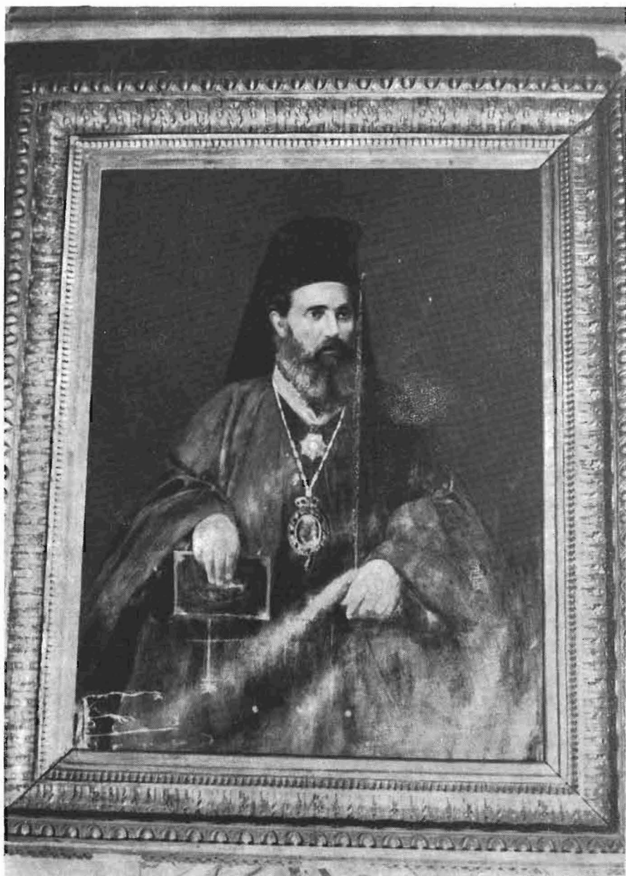
Πίν. 6. Α. Χριστοδούλου, Μητροπ. Σταυρουπόλεως. Μ. Συνοδικὸν Ἱ. Θεολ. Σχολῆς Χάλκης.