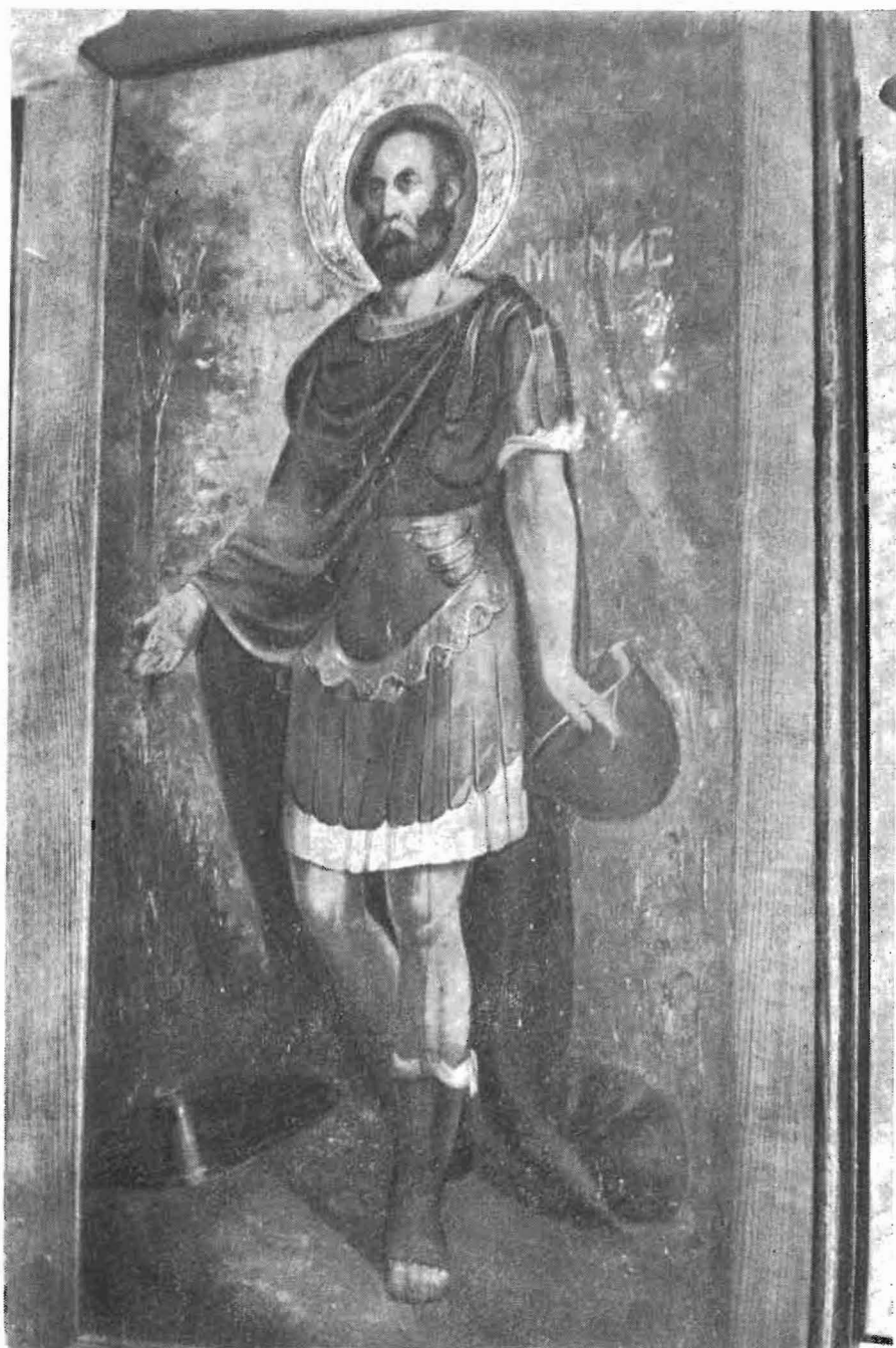
Πίν. 4. Ὁ Ἅγ. Μηνᾶς. Ἰ. ναὸς Ἁγ. Τριάδος Χαλκηδόνος.