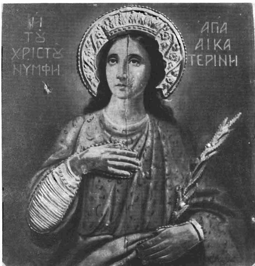
Πιν. 3. Ἡ Ἀγ. Αἰκατερίνη. Ἱ. ναὸς Ἀγ. Τριάδος Χαλκηδόνος.