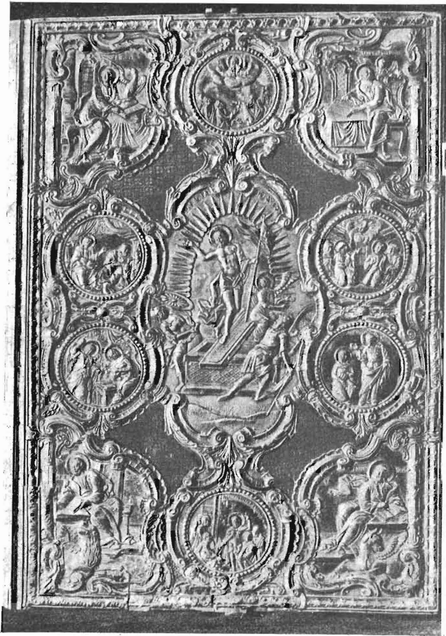
Ἐμπροσθία ὀψις Εὐαγγελίου (1811).