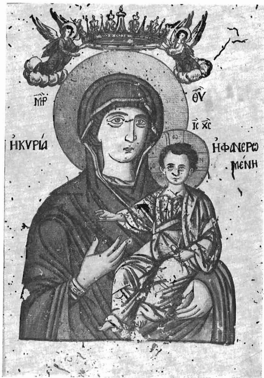
Ἐκ βιβλίου Πράξεων τοῦ Ναοῦ.