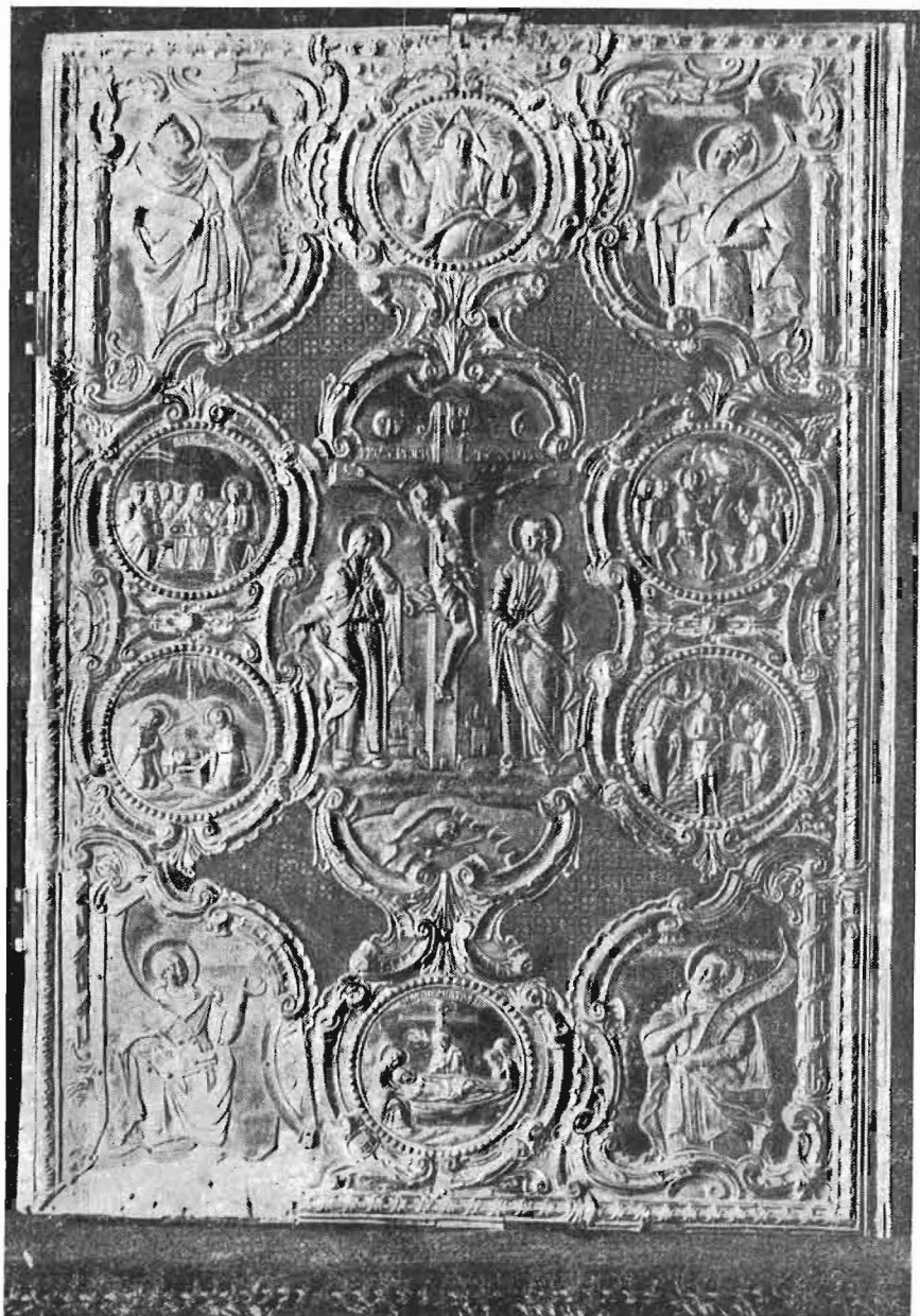
Ὁπισθία ἔψις Εὐαγγελίου (1811).