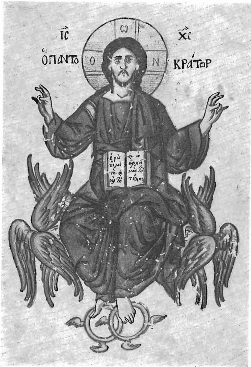
Ἐκ βιβλίου Πράξεων τοῦ Ναοῦ.