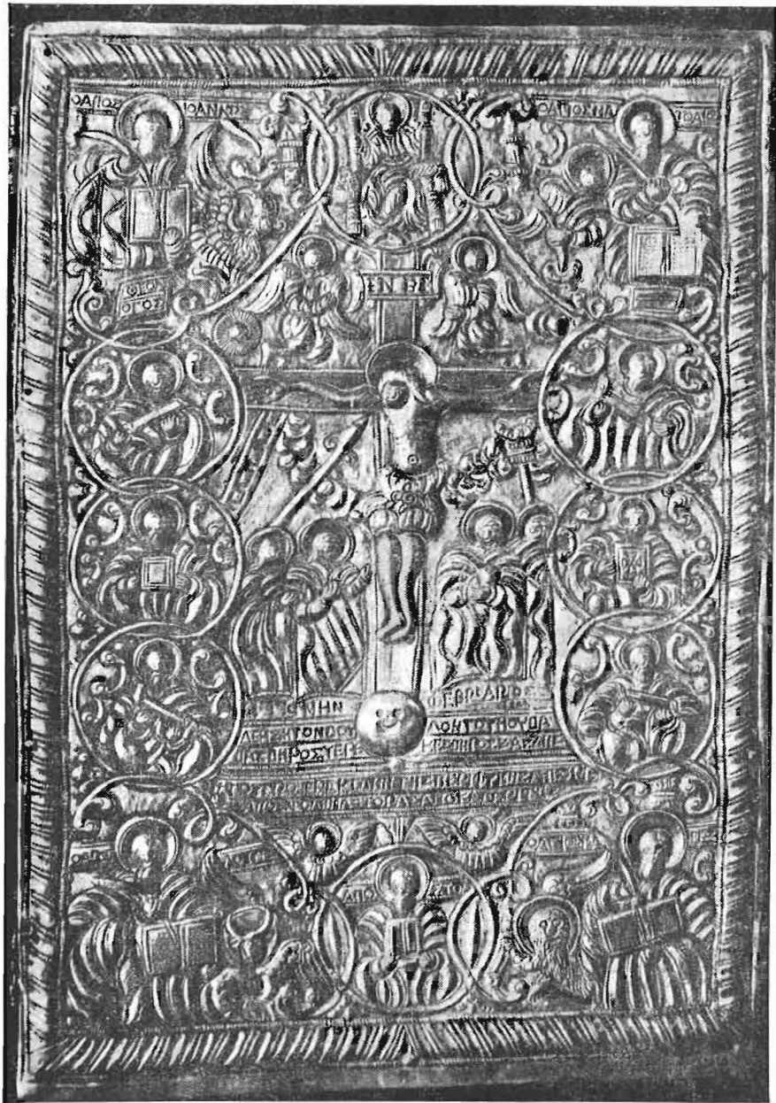
Ὅπισθα ὀψις Εὐαγγελίου (1614).