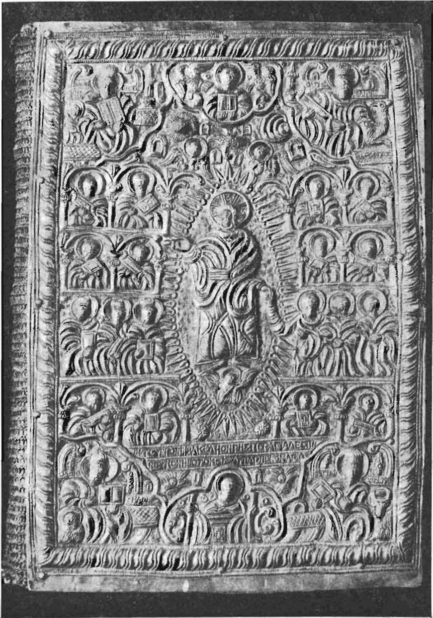
Ἐμπροσθία ὄψις Εὐαγγελίου (1614).